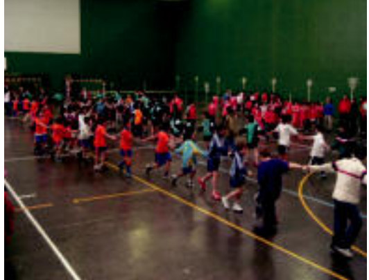
Jolaserako tartea ere hartu zuten ikasleek. HITZA