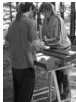
Txalaparta ez zen falta iaz. HITZA

Bosgarren urtez jarraian, Haitzetan Raju mendi taldeak Ibarra ingurutik eginiko mendi irteera eta zikro jatea antolatu du hilaren 10erako, igandeko. Irteera 09:00 etan izango da plazan, eta 3 ordu ondoren Berastegiko Urto parkera iritsiko dira. Bertan zikroa jango dute eta 18:00etan autoz edo autobusez itzuliko dira. Izena emateko lekuak Zubiaurre eta Atari taberna izango dira. Informazio gehiagorako 652 715 800 zenbakia jarri dute.