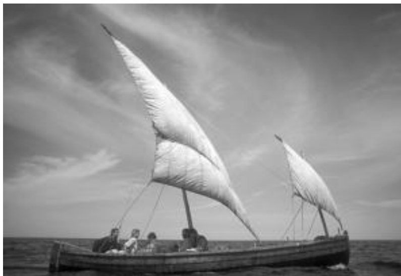
2006. urtean Kanadan 7 lagunek egindako espedizioa. HITZA

2006an baleontzi batean egindako bidaiari abiapuntuzat hartuz, euskal itsaso ondarea izanen du hizpide Maiak