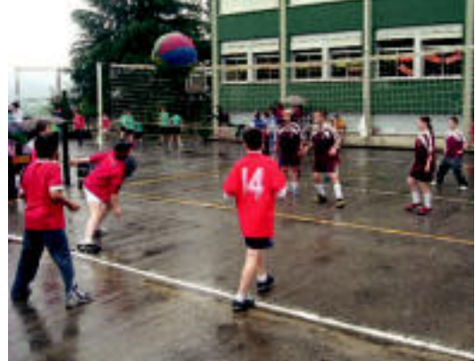
Pilota erraldoi batekin ere aritu ziren jolasean. HITZA

Hain zuzen ere, 25 urte bete dituzte Eskolapioetako Barrutiko ikastetxe guztietako —Bilbokoa, Gasteizkoa, Tafallakoa, bi Iruñekoak eta Tolosakoa— kirolean ibiltzen diren Lehen Hezkuntzako 5. eta 6. mailako ikasleak egun batean elkartzen direla euren ikastetxeetarako batean. Topaketa horietan kirola dela medio, «egun pozgarri bat» igarotzen dutela azpimarratu dute arduradunek.