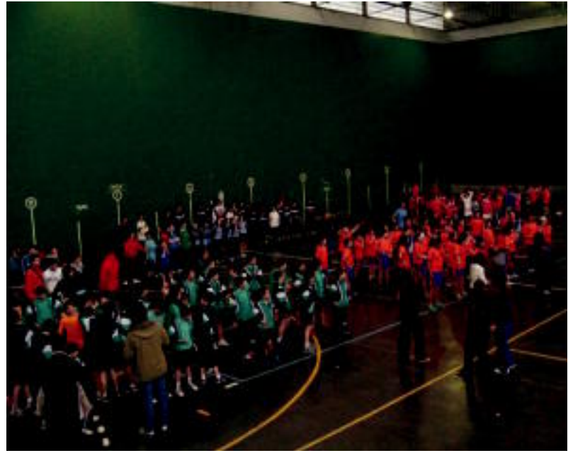
Kiroldegia herri ezberdinetako Eskolapioetako ikasleek bete zuten, kirola egiteko. HITZA

TOLOSA ▶ Eskolapioek Euskal Herrian dituzten ikastetxeetako Lehen Hezkuntzako ikasleek pasa den larunbatean bildu ziren Adiskidetasu Jolasetan