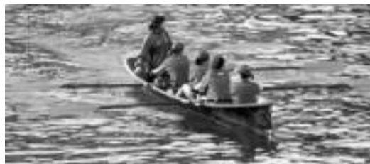
Batel tradizioari bultzada ematea du helburu ekimenak. N. LIZARTZA

«Batel festa ospatzeko asmoa dugu, ez bakarrik aurten baita hurrengo urteetan ere, horrela arraunak Tolosan eta Tolosaldean izan dezan denok desio dugun eta batel tradizioa duen herri honek eskaturiko bultzada, eskola mailan». Hori- xe da antolatzaileen hitzetan ekitaldiaren helburua. Kirol topaketara Ibarra, Villabona eta Alegiako ikastetxeak deitu dituzte, «DBHko arraunlari gazteen erakustaldia. DBH maila. 12:45. Tolosako Bandera eskuratzeko finala sailkatutako lau batelen artean. Babxilergo maila. 13:00. Bandera eta beste dominen emanaldia. ▶ Ikasleek Zerkausi jarriko diren ergometroak erabili ahalko dituzte, goizean zehar.