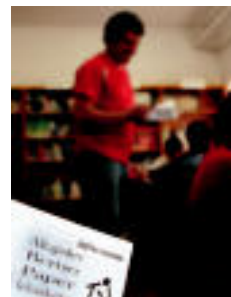
II. Bertso Paper Lehiaketako sariak banatuko dituzte. N. U.