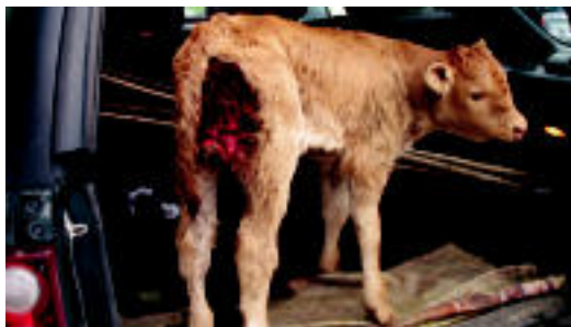
Putreen erasoaren ondorioz, atzealde guztia txikituta dauka. HITZA

egin zioten, putreak han zeudela esateko. Animalia hartu eta albatariarenera eraman zuten, lasaigarriak eta halakoak emateko.