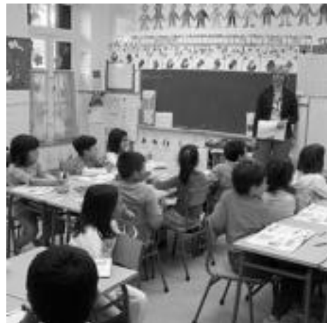
Erantzuna. Zizurkilgo alkatea hiru eskoletan izan zen. HITZA