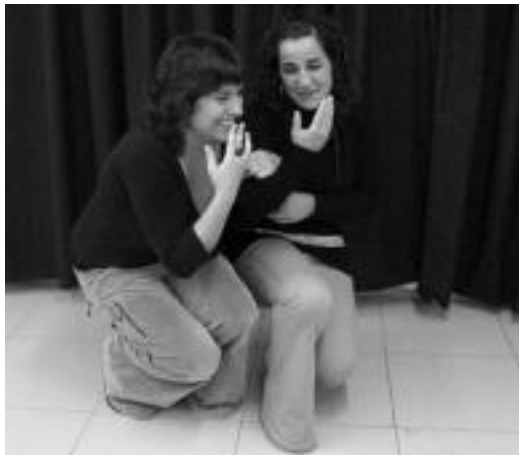
Herri antzerkiko zenbait parte-hartzaile entsegu batean.

Guztira lau esketz antzeztuko dituzte. Horietatik bi Ama begira zazu antzezlari ezagunetik aterata daude. Beste bat ekografia baten inguruan da eta laugarrena aktore beraiek idatzi dute eta kiroldegi berriaren gimnasioaren inguruan