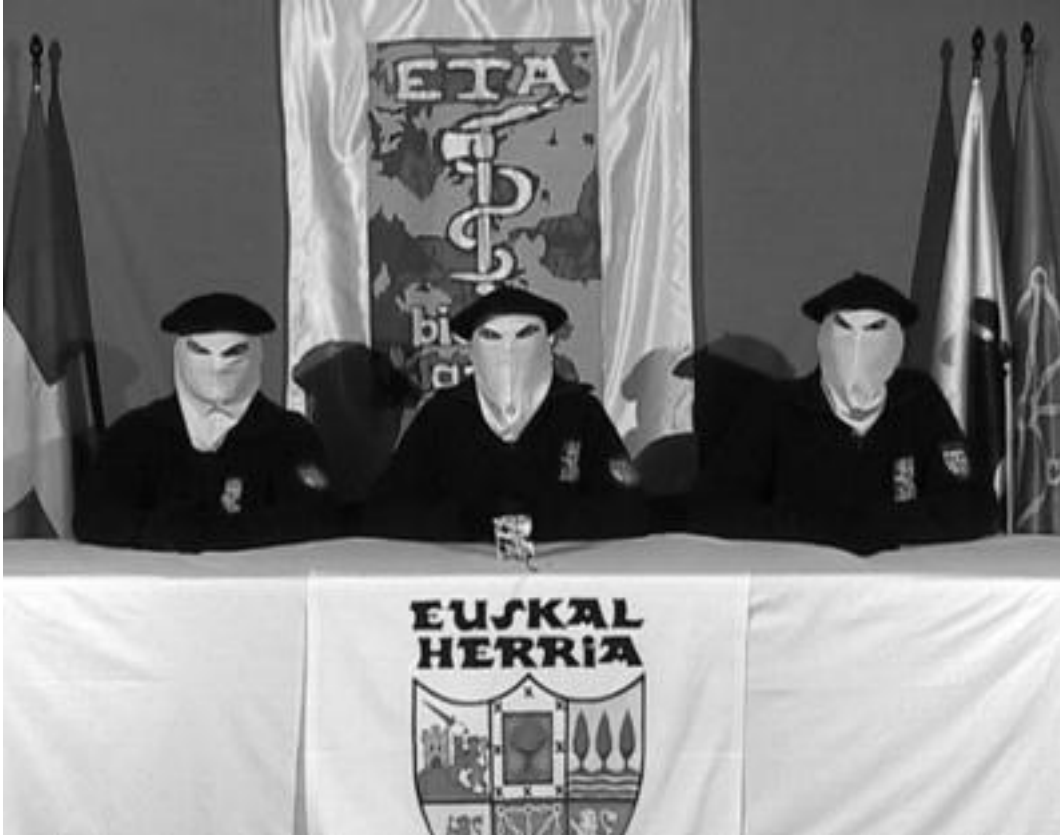
ETAko hiru kide, su-eten iraunkorraren iragarpena egin zutenean, 2006ko martxoan.

ETAk su-eten iraunkorra hautsizat eman du gaur gauerdetik aurrera; Tolosaldeko eta Leitzaldeko politikari, eragile zein norbanakoen iritzia bildu ditu HITZAK