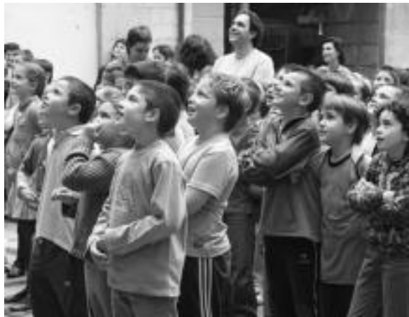
Berdez. Kolore honetako nikiak jantzita atera ziren kalera gazteboak. E. EZEIZA