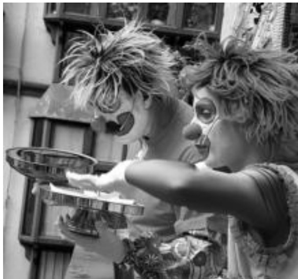
Manifestua. Pirritx eta Porrotx pailazoek irakurri zuten atzo goizean. E. EZEIZA