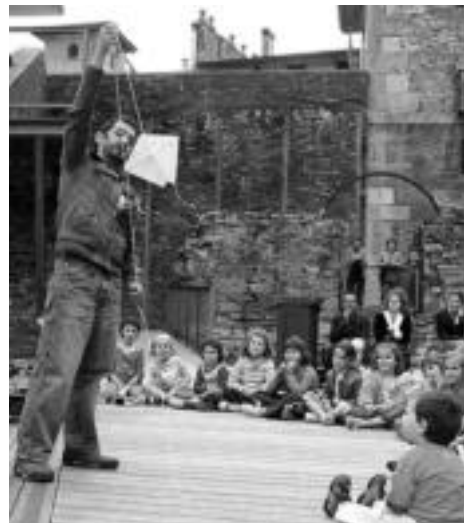
Ipuin kontalaria. Haurrei ipuinak kontatu eta kometat egiten erakutsi zieten Errotako parkean. E. EZEIZA