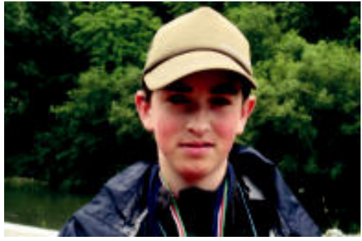
Igandean lorturiko sariaren ondoren ateratako argazkia.

Txapelketa honetan arrantzatutakoaren kopurua eta hauen tamaina hartzen da kontuan. Igandean, Alegian Oria