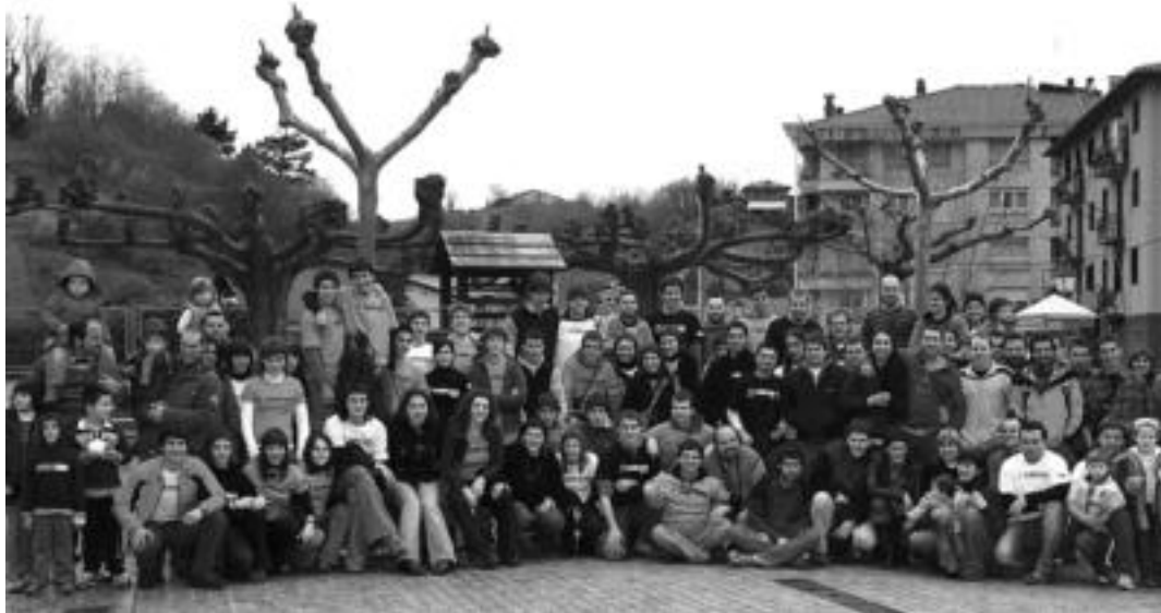
Ibarrako Gaztetxetik igarotako belanaldi guztiekin familiako argazki atera zuten marboan egindako I.go Pipermin Egunean.

Hilaren 15, 16 eta 17an antolatu ditu Gazte Asanbladak, autogestioa oinarri duela