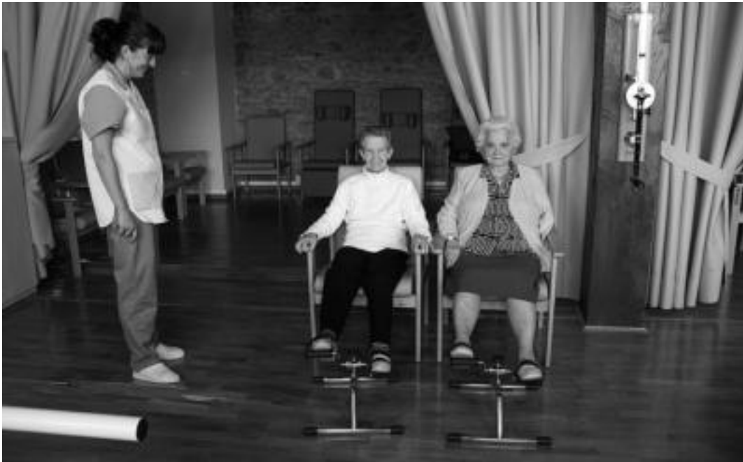
Berastegiko Eguneko Zentroko bi printzesak Arantzazu zaintzailearen begiradapean, goizetako bizikleta ariketak egiten. ASIER IMAZ