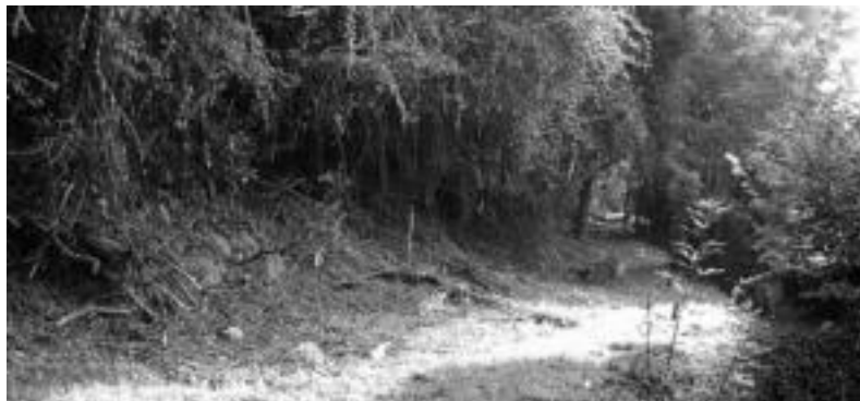
27.000 metro karratu neurtzen ditu Elosegi parkeak, eta eremu ugari sasiak hartuta daude. HITZA

27.000 metro karratuko eremu hau berreskuratzeaz Goroldi enpresako zortzi langile arduratuko dira