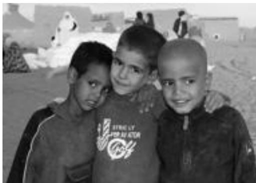
3 haur saharar errefuxiatuen kanpamentuetan. I. TERRADILLOS

Izena emateko epea ekainaren 15a da; uztaila eta abuztua igarotzen dituzte gurean