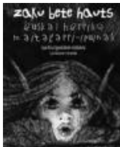
Liburuaren azala.