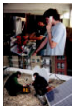
Hitzarmena sinatzen. E.E

Hitzarmena sinatu dute Udalak eta Goroldi enpresak ▶ 2