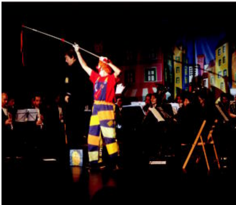
Poxpolo eta Mokolok eta Musika Bandak ikuskizun berezia osatu zuten. HITZA

TOLOSA ▶ Jende ugari bildu zen Leidorren Poxpolo eta Mokolo pailazoek Musika Bandarekin batera eginiko ikuskizunean, Musikaria astearen baitan