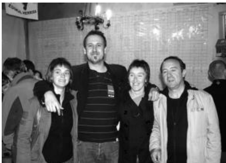
Intxurren bildu ziren EAE-ANVko kideak. «Emaitza oso onak jaso ditugu», azaldu zuten. I. TERRADILLOS