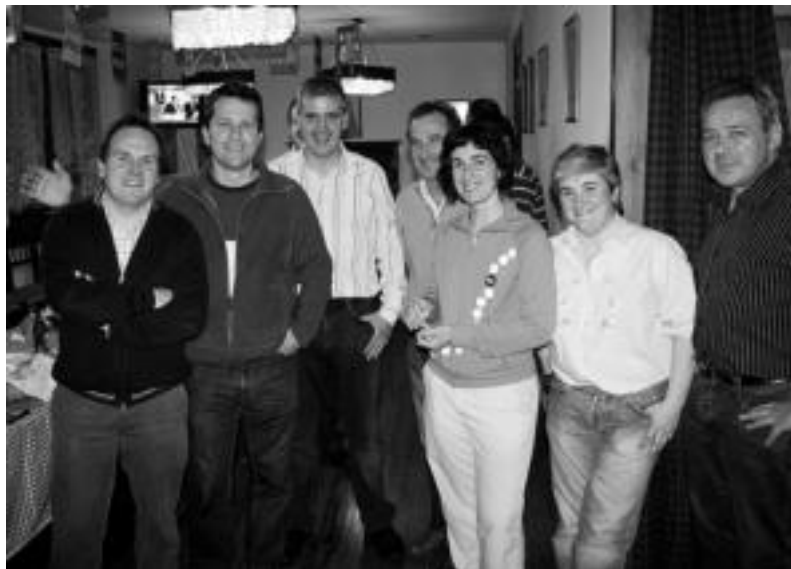
Batzokian «ospatzeko moduko emaitzak» jaso zituzten jeltzaleak.

Orain ekainaren 16ra arte itxarotea besterik ez da gertatzen, herritarrentzat behintzat. Izan ere, ordura arte, hainbat bilera egin behariko dituzte alderdietako kideek, udal gobernu osatu asmoz.