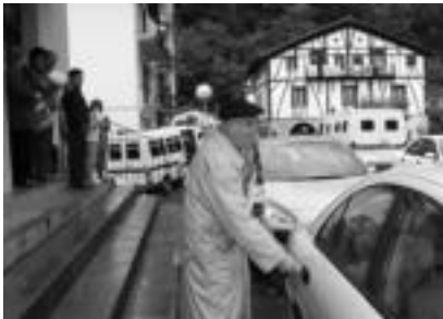
Lizarteko boto kontaktuan PPK ordekarik bezala aritu zena auzoan sartzen herririk ateratzeko, AISEN BAZ

Kontaktuen osten zenbait herritan aginduko duen alderdia aldatuko da; beste batzuetan, berriz, aldatetako izan daitezke