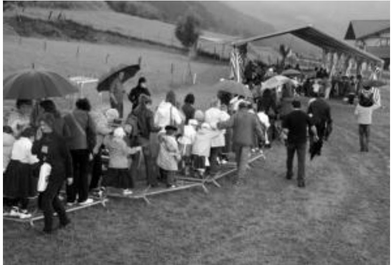
Alurr dantza taldeko haurrak eta ikusleak burdinezko hesien gainetik ekitaldiaren lekura iristen. ASIER IMAZ

Dantza saioa eta merienda- ren ondoren, bertsolarien bigarren saioa iritsi zen. Jaiak amaiera emateko, berriz, 19:00etatik 20:30era erromerian elkartu ziren atzo Izaskunera festez goatzera joan zirenak.