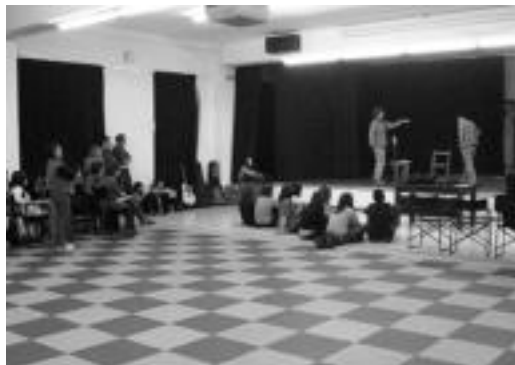
Larunbatean entsegua egin zuten Kultur Etxean. N. GARZIA

Mezquitak emanaldia deskribatzeko garaian, hitzari ematen dio nagusitasuna: