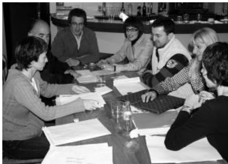
Alkartean izan ziren EAKo kideak. Euren alderdia bozkatu zuten herritarrak eskertu zituzten. I. T.

EAE-ANVek 4 zinegotzi izango litzuke beraien datuen arabera