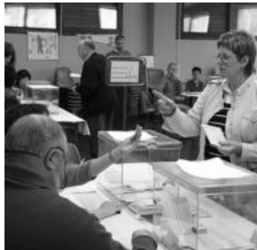
Tolosa, herenegun, herritar bat bere bozka ematen. N. LATABURU

Zenbaitetan gehiengo lortu arren ezingo dute gobernatu; hauteskunde ezaugarrietako bat abstentzioa izan da