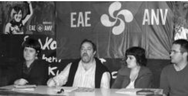
Anoetako EAE-ANVk gaztetxean, «udala eta gazteen artean harremana etena» dagoela esan zuten, Adunan berriz, «herriarren alde lan egiten jarraituko dutela» esan zuten. HITZA