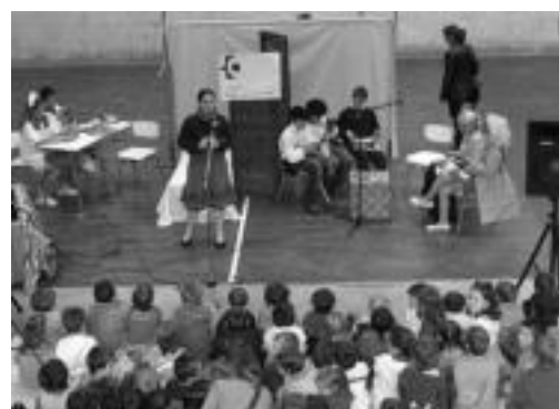
Bidegoiango eskolako ikasleak antzerki emanaldian.