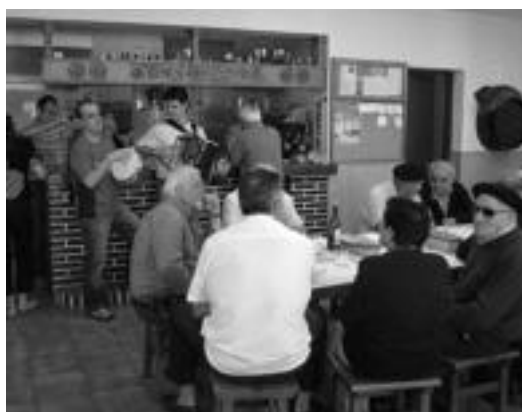
Iaz jende asko elkartu zen Harri Jaian. Txingor maluta handiak izan ziren Bedaion.

Mezaren ondoren hamaiketako elizako plazan egingo dute; igandean, berriz, Jubilatuen eguna ospatuko dute