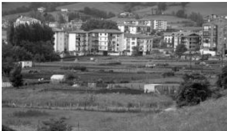
Leitzako Landa Goikoa, bertan eraikiko dituzte etxebizitzak. N. GARZIA

Astelehenean egindako bileran alkateak 3 talde politikoen adostasuna daukatela azaldu zuen, herritarrek batzarrean beraien kezka azaldu zituzten arren