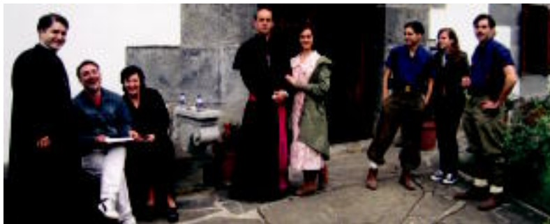
La buena nueva filma grabatzen hasi dira Leitza. N. GARZIA