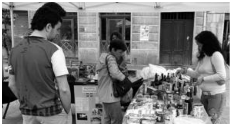
Jaima handiaren kanpoaldean postutxo batzuk jarri zituzten. Irudian, Dominikar Errepublikakoa. N. URBIZU

Bizikleta. Tolosako udaltzaingoa Plaza Berriko Iraxo tabernaren aurrean jasotako mendiko bizikleta jasota dago. Norbaitek galdu badu, udaltzaingorearen egoitzatik pasa argibide gehiago jasotzeko.