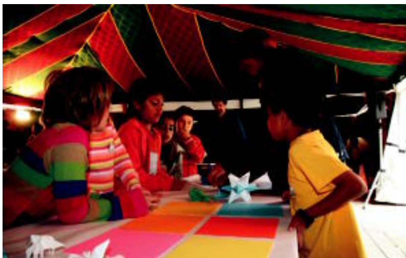
Plaza Berrian jarritako jaimen barruan ekintza desberdinak antolatu zituzten atzokoan. NEREA URBIZU

TOLOSA ▶ 'Kulturartean' jardunaldien baitan, atzo kultura desberdinak ezagutzeko aukera izan zen ▶ 6