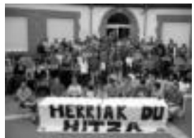
Ostralean, herriko plaza egindako ekitaldia. Irurako hainbat talde eta eragilek «herritarrez osaturiko zerrenda bakarra» babestu dute. Irurako hainbat talde eta eragilek «herritarrez osaturiko zerrenda bakarra» babestu dute.

Irurako hainbat talde eta eragilek «herritarrez osaturiko zerrenda bakarra» babestu dute