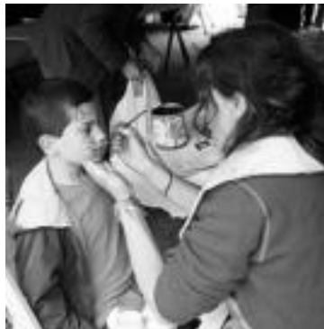
Arupegiak margotzen, ezkerrean. Hizkuntza ezberdinetan idazten irakatsi zuten.

Bihar, 20:30ean Leidor Aretoan La Masai blanca filma izango da, Hermine Huntgeburth-ena. Bertan, Keniako oporraldi batzuetan gertatutako maitasun istorioa eta arriskuak ere ikusi ahal dira. Honekin, amaiera emango diote Kulturarte an jardunaldiak.