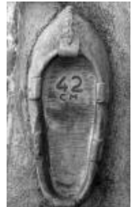
42 zentimetrotako oinak.