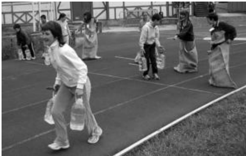
Aurten ere herri kirolak egingo dituzte Berazubín, 13 herrietakoak haien artean nahastuta. N. URBIZU