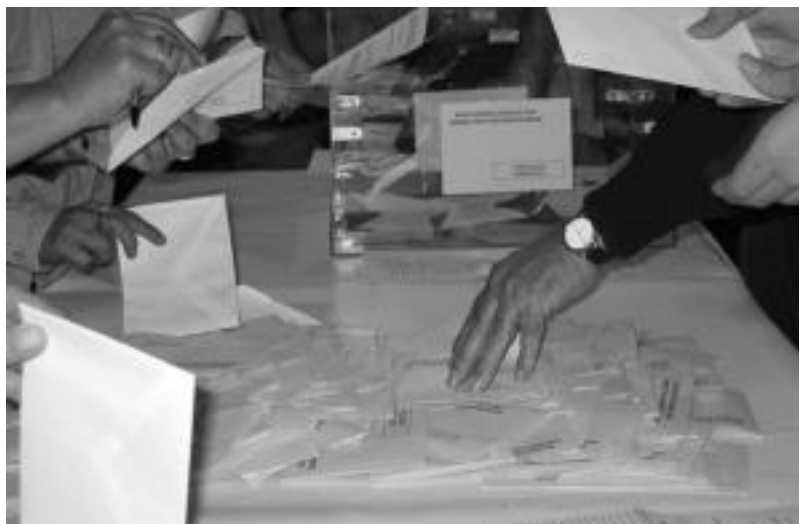
Hamabost egun iraungo dituen kanpainaren ostean, bozka emateko unea iritsiko da.