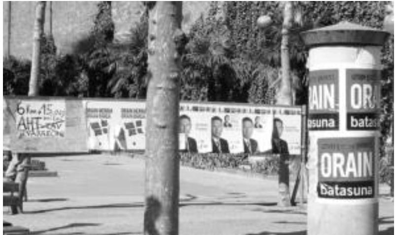
2005 hauteskundetan bezala, kartelez beteko dira kaleak oraingo kanpainan ere.

Kanpaina gaur hasi bada ere, honek soka luzea dakar atzetik; izan ere, une batzuk lehenago jakin ahal izan zen hilaren 27an zein alderdi bozkatu dezaketen herritarrek.