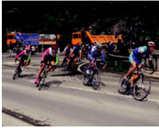
Alebinak, Alegiara sartzen, Altzoko bidegurutzetik igarotzen.