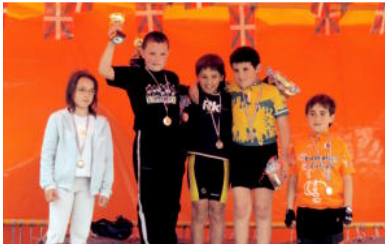
Asteasuko Elizmendir duatloi probetan txikiak ere hartu zuten parte.

Gaur, berriz, 11:15ean meza entzun ahal izango dute Santa Kruz ermitan, eta ondorengo hamaiketakoan Laja eta taldearen musikak giroa alaituko dute. Arratsaldean, 18:00ak inguruan sokamuturra izango da, eta berriz ere, Laja eta taldearen saio dotorea. Ximon berriz ere elizako dorrera igo beharko da, festei amaiera emateko. Hau 21:00etan izango da, baina alai bukatzeko Laja eta taldea izango da.