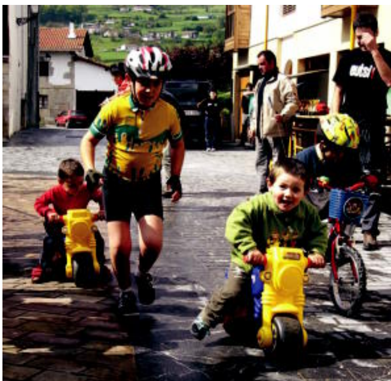
Elizmendi auzoan duatloia egiten zuten jaiak hasi aurretik; argazkian, maila txikiaren proba.

AMAIERA ▶ Gaur gozatu ahal izango dituzte herritarrek festetako azken ekintzekin ▶ 5