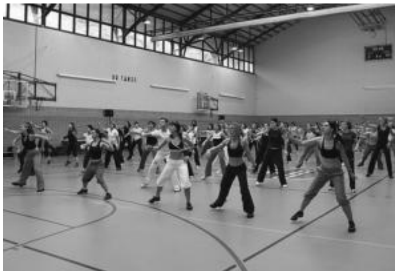
80 pertsona inguru bildu ziren atzo Ibarrako kiroldegian. N. GARZIA

Gipuzkoatik ez ezik, Nafarroatik ere etorri ziren atzo egin zuten Elkartasunaren Aerobik Maratoian parte hartzeko