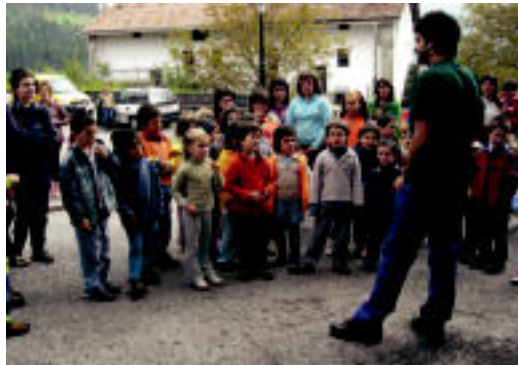
Orexan, Altxorren bila jokuko azalpenak adi entzuten.

Asteasuko Elizmendir duatloia izan zuten, eta Orexan 'Altxorren bila' aritu ziren; gaur, herri kirolak izango dira