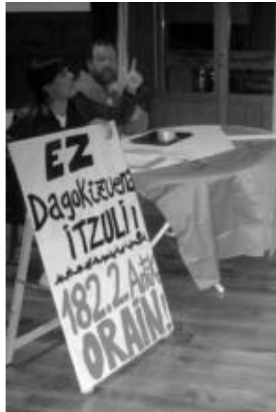
Larrain Herri Plataformako kideak. n.g.