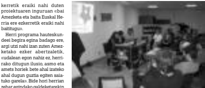
50 lagun inguru elkartu ziren herri programaren aurkezpenean. IMAZ

Herenegun ezker abertzaleak herri programa aurkeztu zuen Badator udaberria/Badator Euskal Herria/Badator Amozketa berria/leloaren. 50 lagun inguru elkartu ziren ezkerretik eraiki nahi duten proiektuaren inguruan «bai Amezketa eta baita Euskal Herria ere ezkerretik eraiki nahi baitugu».