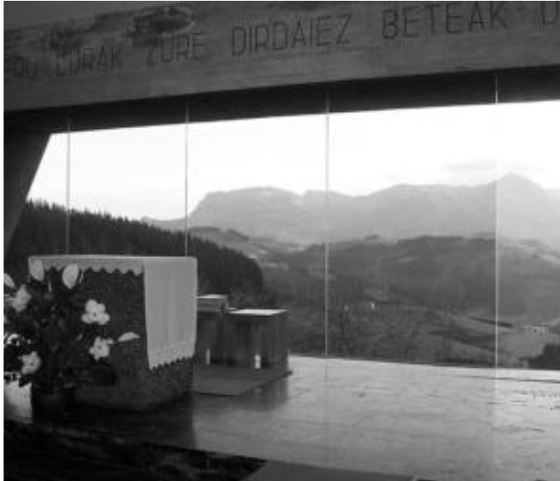
Eliza barrura sartu eta aldarera begira eserita jarri ostean Aralarko mendikatea ikus daiteke. ENERITZ MAIZ

Perez San Roman arkitektoak hala eskatuta, eraikinaren hiru paretak blokez eginak daude eta kanpo aldetik pinta-tu gabe dago. Aldarea den alde guztia kristalezkoa du eta barrutik kanpora dena ikus daite-