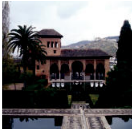
Granada. «Ez da harritzekoa Alhambra munduko zazpi leku zoragarrietako bat bihurtu ahal izatea». GARBINE UGALDE