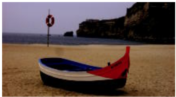
Portugal. «Nazaré herriko hondartzan txalupa bakartia». LOURDES GARATE