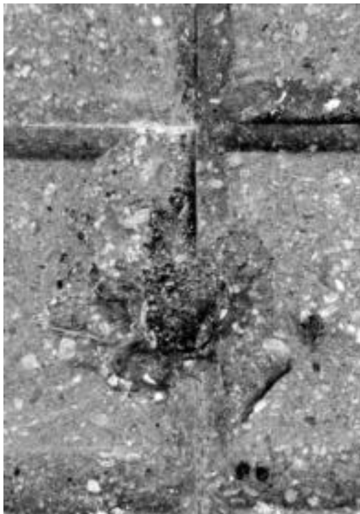
Irurako industriagunearen ondoan dagoen hesiaren aurka eduki zituzten bi gazteak. Lurrean tiroak egindako zuloa ikusten da. A, IMAZ