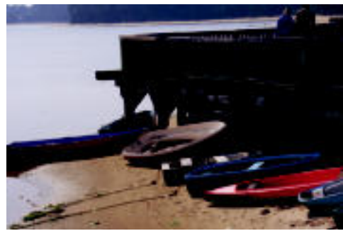
Landak. «Vieux Boucau herrira joan gara». TXEMA ZABALA