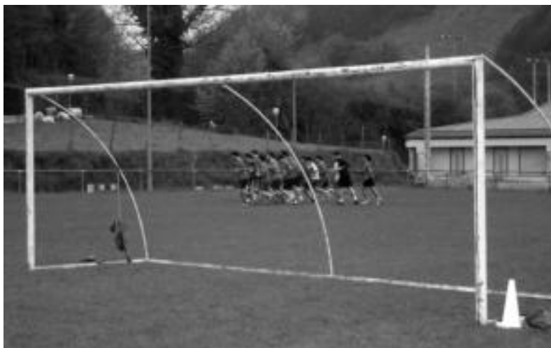
Aurrerako jokalariek entrenamendu batean, asteazkenean.

Irabaziz gero, eta fase hau amaitzeko hiru jardunaldi falta diren arren, leitzarrak zuzenean mailaz igoko dira