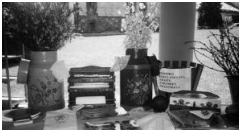
Iazko traste zaharren eta eskulanen erakusketan ikusi ahal izan zirenetako batzuk. HITZA