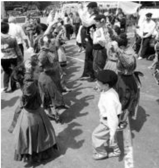
Aurten ere dantza emanaldiak ikusteko aukera izango da. E. EZEIZA

10:00ak aldera bi suziri bo-teaz iragarriko dute larreak irekitzen direla. Hala ere, Larraitzeko sarbidetik ez dira igaroko abelburuak, hemen nitrogeno bidez markatu bakarrik egingo dituzte. «horrenbeste jenderekin abereak aztoratu egiten baitira», azaldu