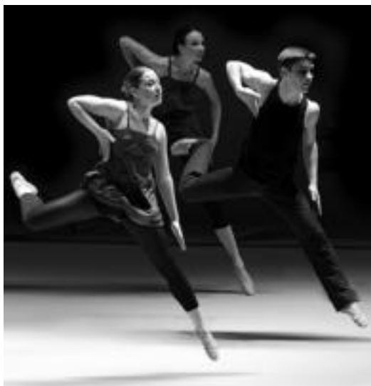
Biarritz Ballet Junior ere ariko da Leidorren, bihar.

Gipuzkoako Dantza Profesionalen elkarteak antolatu du ekitaldia