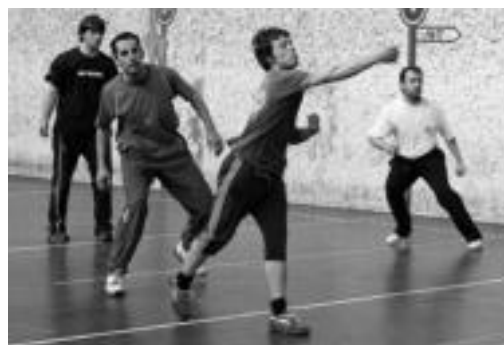
7e Pasa Pilota Txapelketan 19 bikotek hartu dute parte. E. EZEIZA