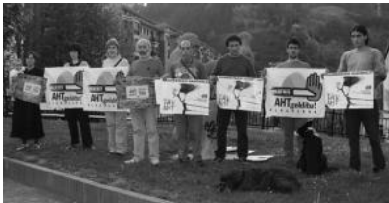
Herenegun AHTren kontrako manifestazio nazionalerako deialdia egin zuten.

Autobusa antolatu dute eta Tolosako Triangulo plazatik abiatuko da, ondoren Anoetatik eta Villabonatik igaroz