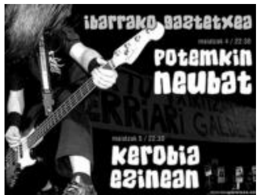
Garagardo festan lau kontzertu antolatuta dituzte Gaztetxean. HITZA