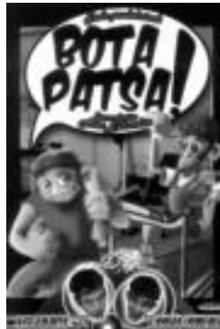
Bota patsa!-ren kartela.