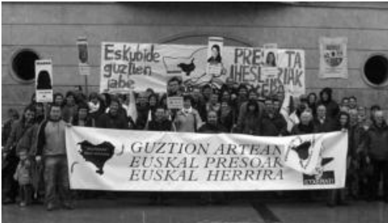
Joan den hilean, urtemugem omenez Ibarren egin zen azken ostiraleko elkarretaratze berezia. HITZA