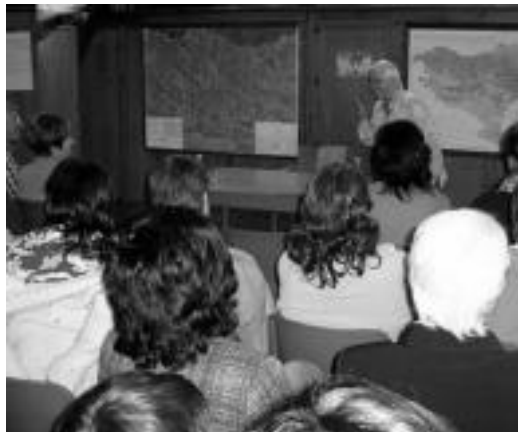
Jendea «gustura» egon zen Toti Martinez de Lezea entzuten.

Ostiralean iluntzean Toti Martinez de Lezea Altzoko Lizarben izan zen. «Oso harre- ra ona izan zuen», beteta baitzegoen, eta bide batez, «interesgarria» izan zen hitz egin zuena: Euskal Herriko sorginez baliatu zen XVII. mendeko istorioak kontatzeko, eta egia eta gezurraren arteko nahasketak argitzeko. Dirudienez, ez zen guk eza-gutuzen ditugun sorginik izan.