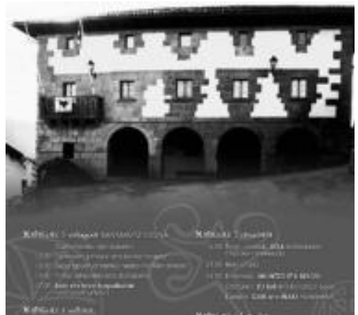
Oreako jaiak iragartzen dituen kartela aurkeztu dute.