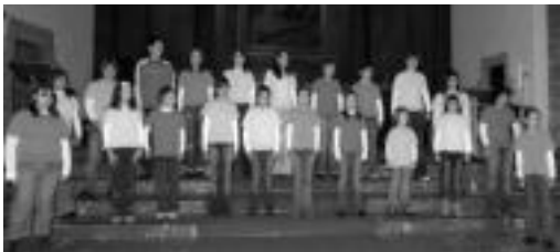
Txintxarri Txiki Abesbatza Alegian egindako saio batean. E. ARRAYET

Hiru egunez izango dira eta etzi abiatuko dira zazpi kantako kontzertua eskaintzera