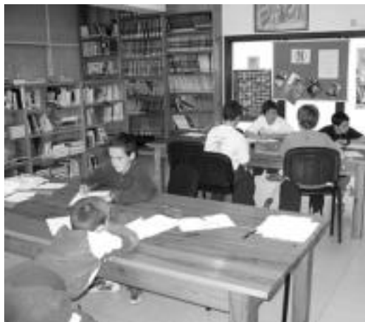
lazkoa I. Bertso Paper Lehiaketan gaztekoen mailan. N. URBIZU

Eskolako liburutegian egingo dituzte, adinetan eta mailatan banatuta; helduen epea maiatzaren 18an bukatuko da