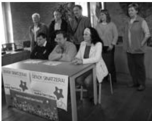
Tolosa ezker abertzalekoak sinadura bilketaren aurkezpena. E. E.

Ezker abertzalekoen esanetan, «herritar hauek guztiak sinatzearekin, ezker abertzaleak hauteskundeetan egon behar duela aldarrikatzeaz gain, prozesu demokratikoaren alde eta era berean, ilegazazioaren aurka daudela erakutsi dute mila-herriarrek». Bestalde, gaitzetsi dute zenbait alderdiren jarrera «faltan bota baititugu