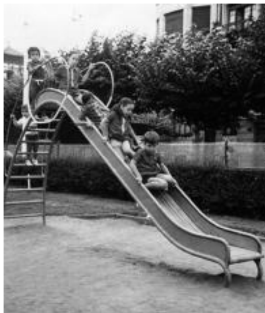
60. hamarkadako haur parkea.