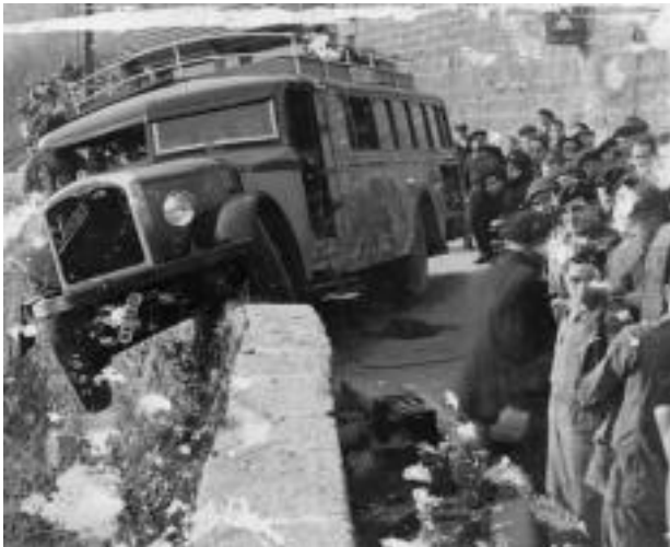
Nazional Iean izandako istripu baten irudia.