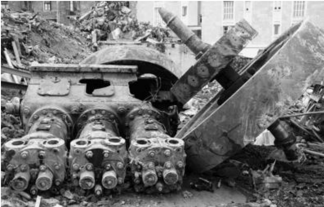
Tolosako ur eta argi zentrallean erabiltzen ziren zilindroak, alternadorea, dinamoa eta inertzia bolante zaharra. ASIER IMAZ

Gerontologiko berria doan lekuan egindako lehen lanek ezusteko alemaniarra eta berarekin batera Tolosaren bilakaera agerian utzi dute