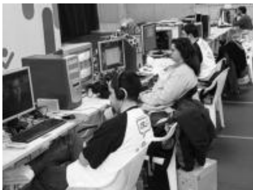
Gipuzkoa Encounter topaketako une bat, Usabalen.

Denera 300 ordenagailu eta 600 lagun inguruk hartu dute parte jai honetan. Parte-hartzaile gehienak gipuzkoarrak izan dira, %42, hain zuzen; bizkaitarrak %30a izan dira, nafarrak %9a eta arabarrak %7a. Gainerako %19ari dagokionez, atzerriatik etorritakoak izan dira. Hauetatik, gehienek sarean jokatzeko bideojokoak aukeratu dituzte, %45ak. Hauen ostean, Linux-a aukeratu dute, eta baita modding -a ere. Erabiltzaileen artean 9.000 euro inguru banatu dituzte antolatzaileek egin diren lehiaketa