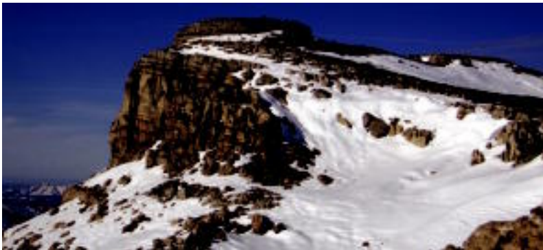
Urkulu mendiaren gainean zaintze-dorre baten hondakinak daude. HITZA