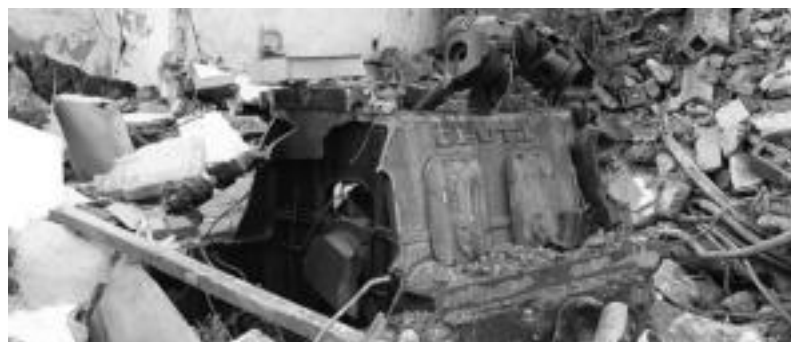
Lanen ondorioz kutxarearen «zauriekin» Otto Deutz motor dieselaren zati bat.

tzean zeuden ametsak berarekin agortu ziren. Gaur egun Tolosaren zati bat Tolargik hornitzen badu ere, beste zati bat herriatik kanpoko enpresa pribatuen esku geratu da. Inguuruan 15 langile izan zituen Otto Deutz zaharraren teilatua bota dute eta kutxareen zauriez agerian geratu da, burdin zati zahar baten moduan. Museotan ere baztertu egin dute Deutz alemaniarra, «Gipuzkoako erakundeetara joan gara irtenbide bat aurkitu nahian. Baina handiegia da eta ez du baliorik». Aranzadik ere ikerketaxo bat egin zioten, baina argazkiak atera eta hor geratu da. Baliorik sortzeko gaitasunik gabe, zahar gixa, zakarretarako beste lekurik gabe.