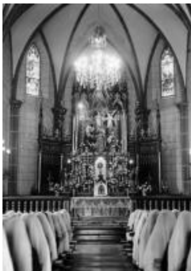
Jesusen Alabako artxibotik. Jesusen Alaba kastetxeko eliza XX. mendearen erdialdean.