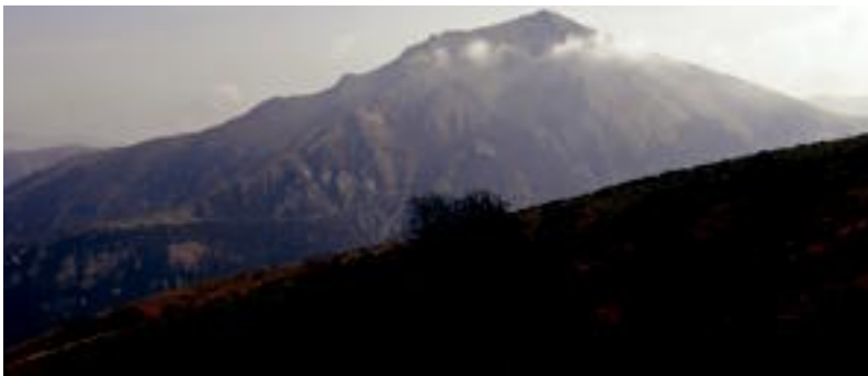
Erozate mendiaren ikuspegi, Beherobitik abiatuta igoko duten lehen mendia. HITZA

Ibilbide guztiaren iraupena zazpi ordu ingurukoa izango da eta 24 kilometro egingo dituzte mendizaleek. Izena eman nahi dutenek 943 69 44 58 zenbakira deitu behar dute edo Aizkardiren egoitzara joan behar dute. Bihar da azken eguna horretarako. Irteera Olaederra kiroldegia ondotik izango da, igandean goizeko zazpitan.