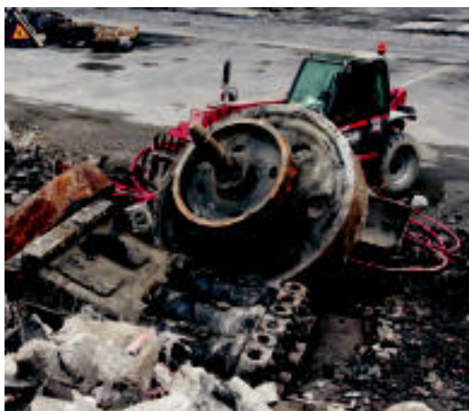
Otto Deutz izeneko motor dieselaren zati bat.

IKERKETAK ▶ Hainbat museok zein Aranzadik baztertu egin dute motorra, baliorik ez duelakoan ▶ 6