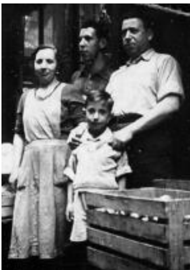
Aroztegieta kaleko janari denda bat.