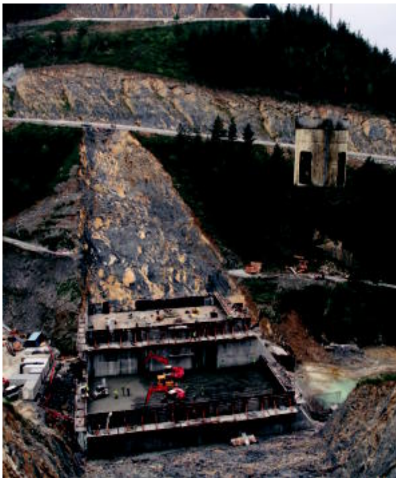
Presa itxura hartzen hasi da: dagoeneko jarri beharrekoaren laurdena jarri dute.

Bainuontzi erraldoi batekin pareka daiteke Ibiur; sei hilabete inguruan presaren laurdena egin dute, hormigoiez