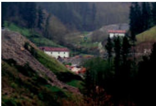
Urtegia egitearen ondorioz irudiko baserriak eraitsiko dituzte. N. U.

Ondoren, hustu eta urez betetzen hasiko da, hainbat erreka txikitatik bildutako urarekin, Txindokin jaiotzen den errekekarekin batera. ◀