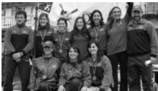
Jubenil-senior mailako neskak irabazi eta gero. HITZA

Gipuzkoako Ligaxkaren ondoren, asteburu honetan Eus-