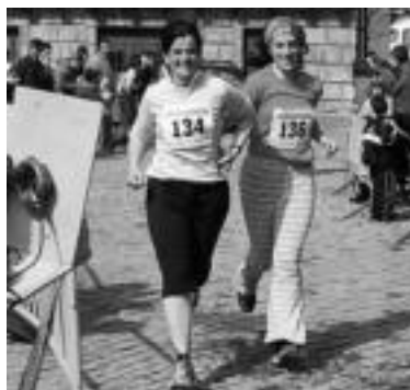
Plazan, helmugara iristen. I. AZPILIKUETA