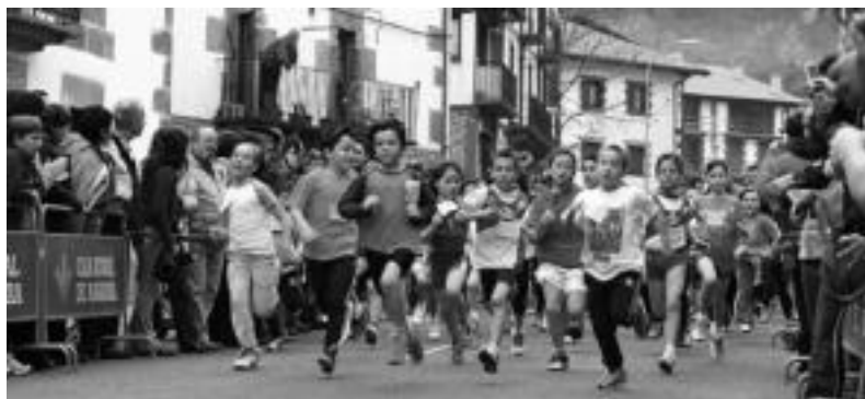
Haurrak, lasterketa hasieran. I. AZPILIKUETA

Beteranoen artean kopuruak gora egin du, 16 pertsonekin, baina umeen partaidetza aurten nabarmen gutxitu da