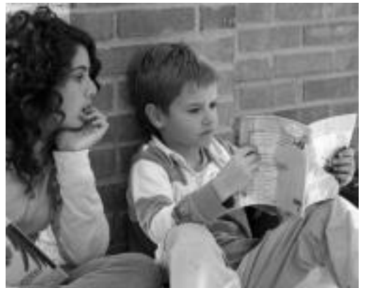
Bi ikasle bikote irakurleen saioan. I. GARCIA