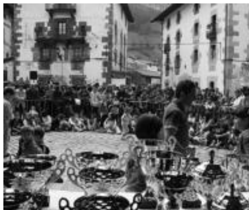
Jende asko bildu zen sari banaketara. I. AZPILIKUETA