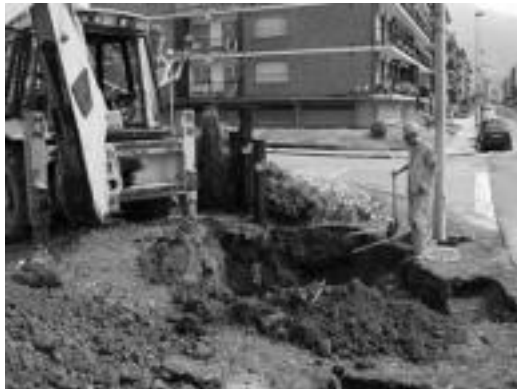
Zenbait lagin egiten ari ziren atzo herriaren irteeran. I. GARCIA

Obra hauek Villabonarako sarreran eragozpenak sortuko ditu, lurra zulatu behar baitute hodiak sartu ahalizateko. Egun hauetan zenbait lagin egiten ari badira ere, laster Burdinezko Zubiaren ondoko biribilgu-