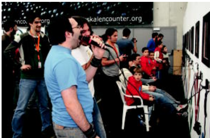
Kantu lehiaketa eta dantza lehiaketa burutu zituzten atzokoan Gipuzkoa Encounterren. ASIER IMAZ

«300 ordenagailu inguru» instalatu dituzte Usabal kiroldegian hiru egun iraun duen topaketako partaideek