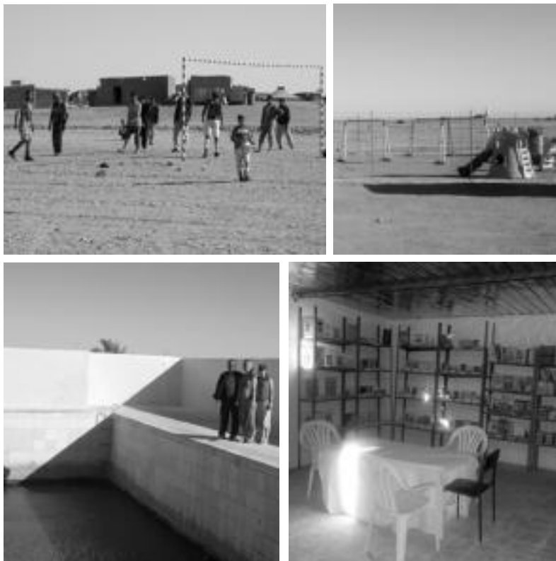
Futbol zelaia, jolas-tokia, igerilekua eta liburutegia ditu, Tolosako elkarrekin lagundutako proiektuak.

Tolosaldea Sahararekin elkarrekin burutzen dituen ekimenen bidez lortutako diruarekin igerilekua, jolas-tokia, liburutegia eta Internet gela dituen gunea erakitzen laguntzen ari da, eta elkarteko kideek azken egonaldian ikusi ahal izan dutenez, «bide honetik doa proiektua». Hau amaitzen dutenean Fronte Polisarioak ikusiko du non dagoen behar handiena, eta orduan hurrengo proiektu horretarako bideratuko du elkarrekin Tolosaldean bildutako dirua.