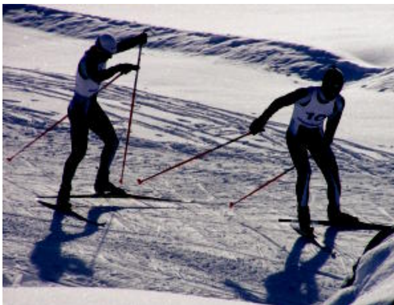
Rojo anaiek lehen postua erdietsi zuten, kadete eta senior mailan. HITZA

HITZORDUAK ▶ Asteburu honetan Espainiako Kopan hartuko dute parte Candanchun ▶ 2