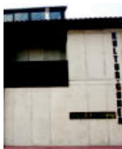
Kultur gunearen eraikina.