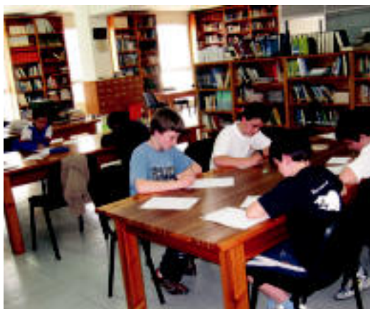
lazio parte-hartzaileak, 16 urtetik beherako mailan. N. URBIZU

Lehiaketaren oinarriak iazkoak dira, hau da, parte-hartzaileak adinaren arabera, bi taldetan banatuko dira. A taldean 15 urte baino gutxiago dutenak, eta B taldean 16 urte