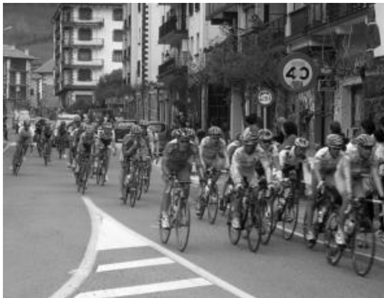
Huitzi igo ondoren, Leitzara jaitsi eta herri erditik igaro ziren herritarren gozamenarako.

Ikusgarritasuna lehenek jarri ezinean, 25 urteko alemaniar gazte batek jarri zuen, izan ere, Jens Voigtek erakustaldi aparta eskaini zuen atzokoan. Ibilbide gogorari bizi-bizi aurre egin zion, nahiz eta Huitzi