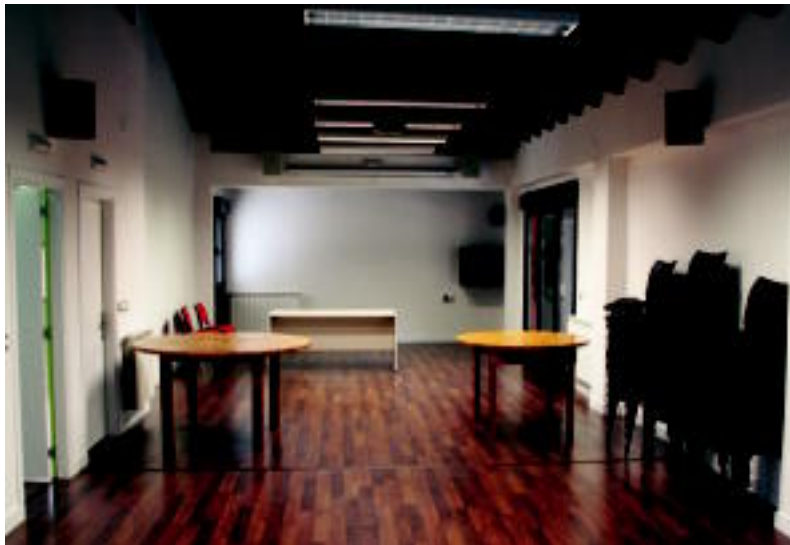
Balioanitzeko gela goiko solairuan dago. I. GARCIA

Behe solairuan bi gela daude. Horietako batean liburutegia eta KZgunea jarri nahi dute.