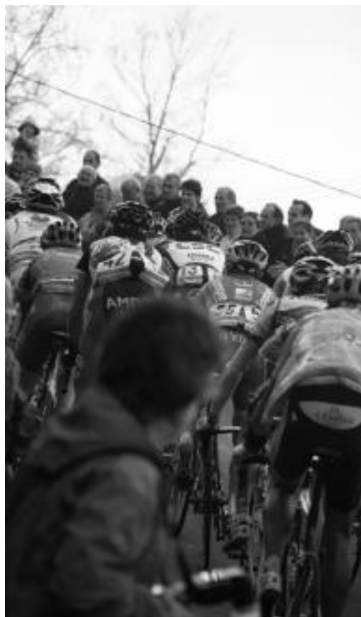
Leaburu gainean pelotoia jendez inguratutik.