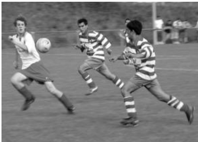
Aurrera Taldeko futbolariak, joan den urteko norgehiagoka batean. JAOINE ASTIBIA

Arerioa azkenaurko doan arren, amaitzeko 5 jardunaldi falta dira, eta Aurrerak bi partida gogor ditu jolasteko