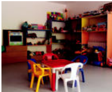
Ludotekarako atonduta duten espazioa eta eskulana egiteko gela. I. GARCIA

Orain bi zerbitzu horiek udal-tertxean eskaintzen dituzte eta Kutxari eskaturiko diru laguntza batean zain daude materialen lekualdaketa egiteko. Beste gela egun meditazio ikastarorako erabiltzen dute. «Hasiara batean medikuaren kontsulta jartzea nahi genuen, baina Osakidetza ezekoa eman zuen», dio Urkaregi. Behe solairuan, komun publikoak daude ere. Kanpotik sartu ahal da eta beti dago irekita.