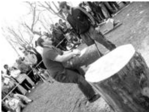
Harri-jasotzea izango da, eta irekia izango da parte-hartzea. N. LATABURU

Ahari proba, zaldi lasterketa edota motozerra erakustaldia izango dira