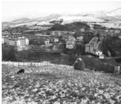
Lizarain zerrategia zegoen eremuan joango dira etxebizitzak. I. GARCIA

Maiatzaren 15ean amaituko da 33 areako etxebizitzaren zozketan parte hartzeko epea