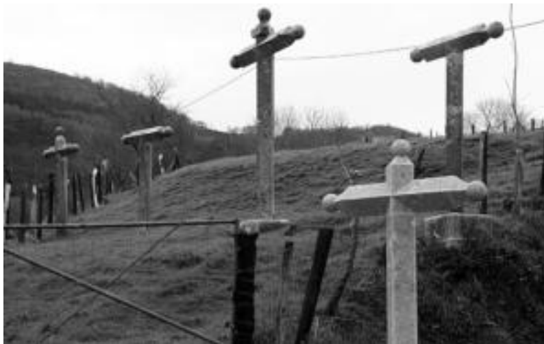
Udalak bi gurutze berri jartzeaz gain bat konpondu ditu «herriko ondare kulturala» berreskuratzeko. A. IMAZ