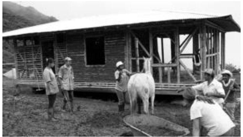
Goian, etxe bat egiten. Behean, mandoen bidez materiala igotzen eta haurrak marrazkiak egiten. HITZA

dik ikastetxeko borondatea eta elkar ulertzea eragingo duen adiskidetasuna ezartzeko nahia adierazi dute. Bestalde, bi ikastetxeek, ardura edota betebeharrak batzuz zehaztu dituzte: eskola-materialak, ingurumenekoak, kultura esperientziak, eta informazioa trukakutako eta elkarbanatutako dituzte.