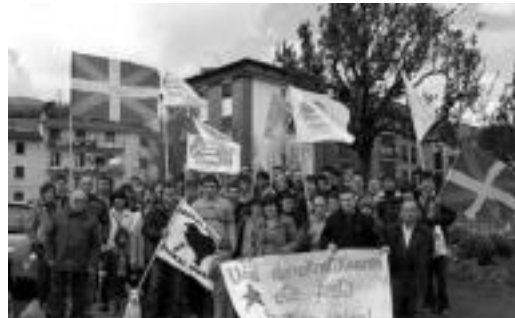
Prentsaurrekoa egin zuten talde ezberdinetako ordezkariak.

Zentzu honetan, datozen Anoetako festak hauteskunde- en ondoren ospatuko direnez eta «Udala egoera demokratikoan eratu egoteko aukerak daudenez, Udaletik kanpo sortu dugun dinamika eta herrita-