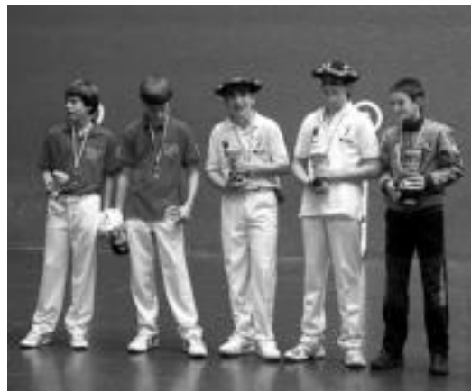
Txapelketaren amaieran pilotariak garaikurrekin. HITZA

Gauzak oso gaizki jarri zitzaizkion Beotibar taldeari, 2-11 galtzen jarri baitzen. Arrerago markagailuak 11-20 erakusten zuen. Hala ere, Beotibar taldeko pilotariak partidan sartu eta zumaierrei erantsi zieten. Aldea pixkanaka gutxitzen joan ziren eta partidaren hondarreen lortu zuten berdintzea lehenengo, eta ondoren azken tantoa egitea, markagailua 30-28 geldiaraziz, eta Gipuzkoako Txapelketari amaiera bikaina emanez.