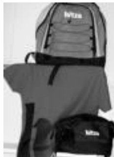
Hitzako materiala. E. EZEIZA