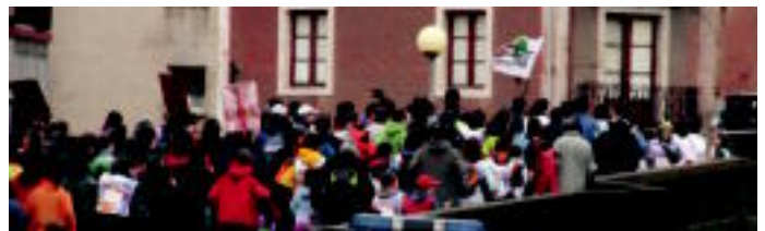
Villabonatik Zuzkilerako zuban jende multzo handia bildu zen Korrikaren aldeko oihua, saltoka eta irrifarrez errepikatuz, euria beldur handirik gabe. A. IMAZ

ranga herriko kaleetan zehar ibili zen. Tolosan eta Leizaldean Herriak, diada bi urte bezalaxe, Korrikan parte hartu nahi izan zuen eta horretarako Zubi Be- rrin hartu zuten lekuko. Korrika apirilaren 1ean Iru- ñera iritsiko da. Karrantzatik atera eta 10 eguneko Euskar He- rria zeharkatu eta gero, ondo- rengu jolasean: Heidu herrizari! Heidu hiritzari! Heidu euskarlari! Heidu euskarari! Heidu le- kuari! Heidu!