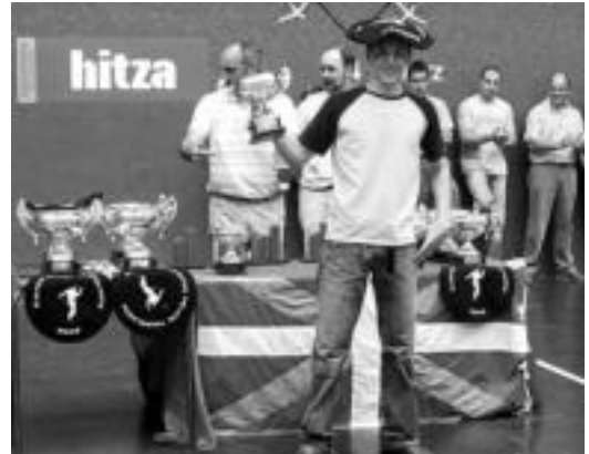
HITZAK gizartearen ere leku garrantzitsua du: Korrikan, pilotalekuan, lehiaketetan... Aurten IV. Hitza Txapelketa antolatuko dute. L. MONTES

2006-12-18. Eskualdeko egunkariaren proiektuak 5 urte bete zituen.