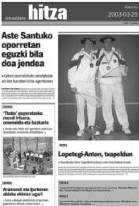
TOLOSALDEKO HITZAREN lehenengo alearen azala. HITZA

HITZAK lau urte bete ditu, eta irakurlearen hobearekin lan egiten du. Helburu nagusia eskualdeko albiste berri ematea da, euskaraz, eta objektibotasuna galdu gabe. HITZAK irakurleen beharra du; HITZAK, berriz, irakurleek egunkari honen beharra izatea nahi du. ◀