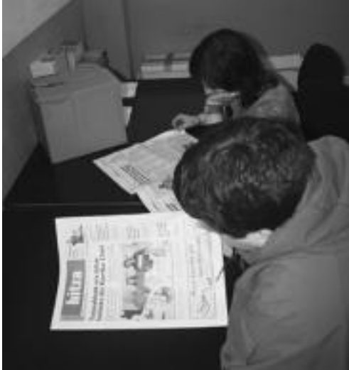
HITZA irakurleak, papereko edizioan, eta webgunearen bidez. N. URBIZU

Postontzietan jasotzen den egunkaria, eskualdeko egunkari euskaldunaren urteurrena gaur da; trabak izan dituen arren, beti atera ditu gure berriak