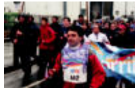
Anoetan sartu aurreko une euriak baino abak. A. IMAZ