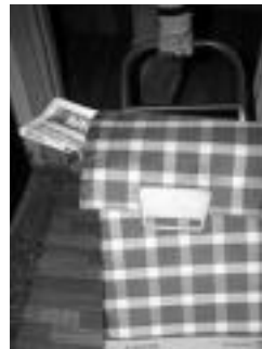
HITZA banatu egiten da. HITZA

Edukiari buruzko erantzunak interesgarriak izan ziren: orokorrean denetarik dagoela diote askok, baina «hirigintzari buruzko albiste gehiago» jorratu beharko lituzkeela ere bai. Kazetaritza lantzerako or-