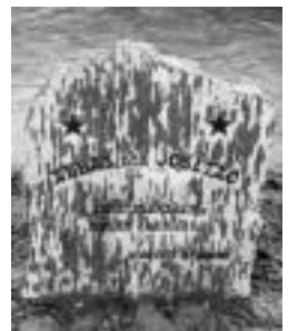
Arane iturririko monolitoa. A. IMAZ

«Soldaduskatik itzuleran jarri serioagoaz» aurkitu zuten ingurukoek. «Politika kontuei jarraipen handiagoa» egiten hasi zen, eta komunikabideek jokatzaren zuten «garrantzia ikusirik», La Voz de Españaren aurkako boikota egiten hasi zen antolatzen zituen kirol eta kultur ekitaldietan. Ondoren, 1975ean ETAn sartu eta 1977an erahil zuten Guardia Zibilek kontrol batean.