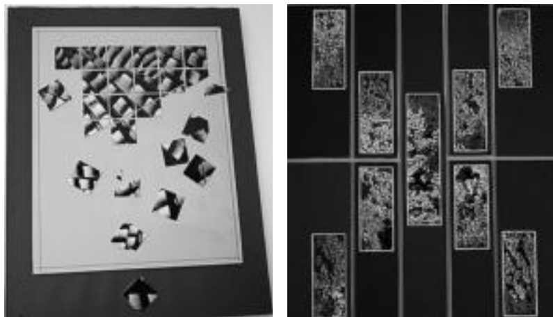
Exkixu-lumak. Konposizio honetan Zufiaurrek Exkixu-lumak erabili ditu eta alegoria hori adierazteko, hauei ateratako argazkiak txikitu ondoren, esanahi estetiko bat eman die. HITZA