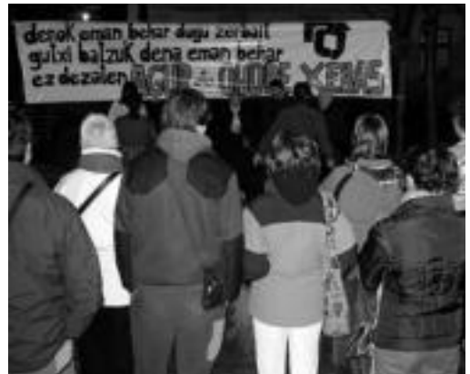
Berrogeita hamar lagun inguru elkartu ziren omenaldian. A. IMAZ