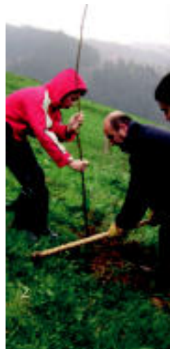
Gazteak landatzen. HITZA

Zuhaitz Eguna egin zuten atzo ikastolako ikasleek; xarma, urki eta astigar berriak izango dira ur biltegia ▶ 4