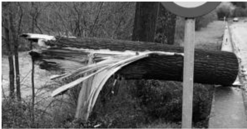
Asteazkenean, Txaramarako bidean haizeak botatako zuhaitzak zeresanak ekarri ditu.

Goñik, Leaburu-Txaramako alkateak, errepideen inguruan kritika «zorrotza» egin die Diputazio eta Tolosako alkateari