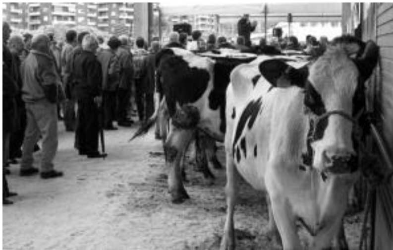
Bigantxak, 2004. urteko enkantean. O. ESKITXABEL

Lau arraza ezberdinetako bigantxak ikusi ahalko dira eta osotara, 94 izango dira enkantean jarriko dituztenak