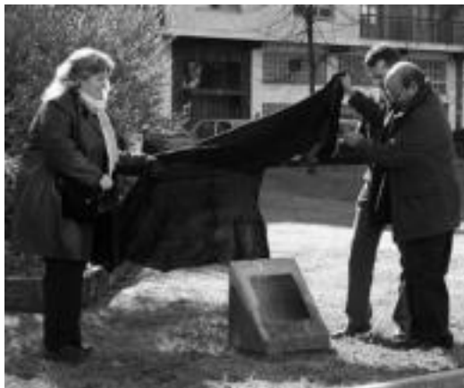
Saharar errepublikaren 30. urteurrena dela eta, Tolosako Udalak plaka bat jarri zuen joan den astean. E. EZEIZA

20:00. Argazki erakusketaren inaugurazioa, Aranburu jaure-