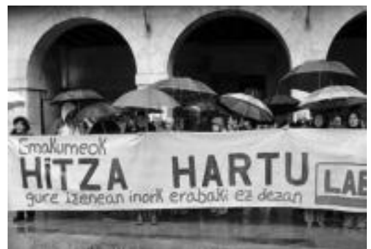
LAB sindikatuak elkarretaratzea egin zuten Tolosan. HITZA

TOLOSALDEKO ETA LEITZALDEKO HITZAK gaur eta hurrengo egunetan Emakumearen Nazioarteko Egunarekin loturik dauden ekitaldiak eta izango direnak atzoko alean argitaratu zituen.