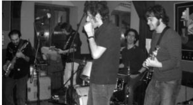
King Bee taldeak iaz emandako kontzertuaren une bat. A. ETXAN IZ

V. Blues Musikaren Jaialdiaren baitan, lau talde ariko dira bihar gauean Aurrera, Atxulondo eta Egarri tabernatan