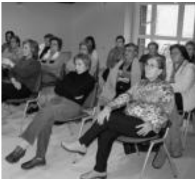
Landareei buruzko hitzaldia Elduainen. ASIER IMAZ