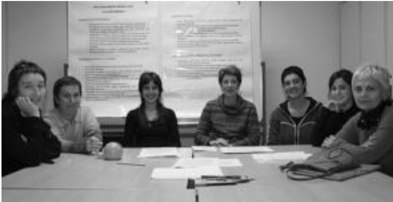
Bilgune Feministako kide batzuk, egindako batzarraren ondoren. HITZA

Bi eskualdeetan antolatutako ekitaldiak aurrera eraman ziren, Tolosako zezen plazan egin behar zen murala ezik