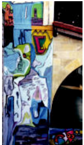
Bi muralen bat egitea. Ur-jazirean bidez kolore eta forma ikuriztatuz nahastu dira. Margolarak bi munduen banaketak eta ezberdintasuna adierazi nahi du. Bertan, izarrak (kerroa), pertsona handia, amarrak (gozeta eta emakume)...