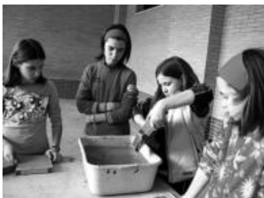
Paper berziklatua egiten ikasi zuten atzo ikasleek. E. EZEIZA