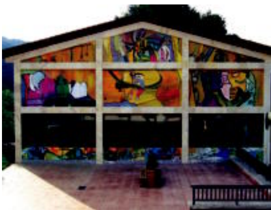
Plaza aldetik begiratuta Tfontorpe pilotalekuak duen ibura. Gure mundua azaldu nahi izan dute. HTZA

Hogei urte eta gero Leaburuko Tfontorpe pilotalekuko lanak bukatu dituzte; plazari bizitasuna eman nahian, kanpotik pintatzea bururatu zitzaizen Udalekoiei