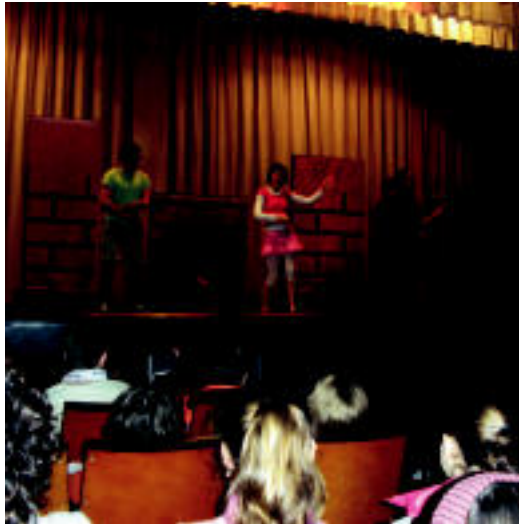
Donostian ikusi zuten antzezlaren une bat.

TOLOSA ▶ Laskorain ikastolako ikasleek Donostian izan dira 'Dejame entrar' antzerkia ikusten