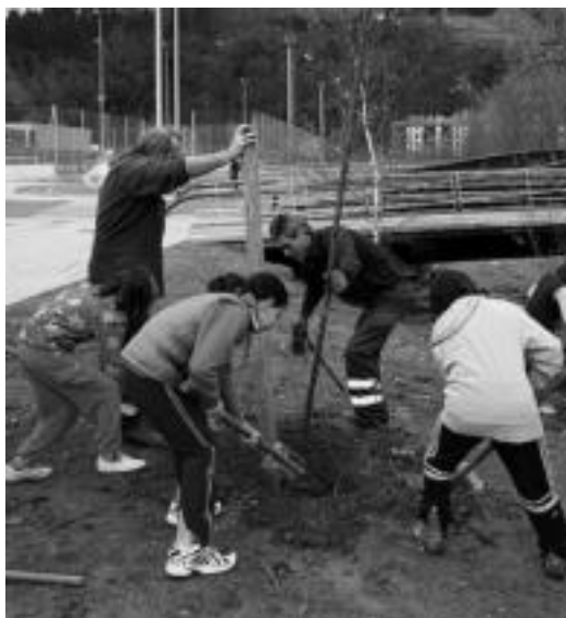
80 zuhaitz landatu zituzten atzo, Usabaleko eremuetan. E. EZEIZA