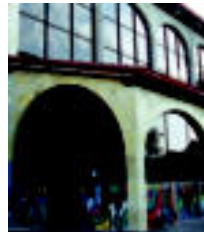
Behoko zatia. Besebengandik banandu egiten da. Plazari dagozkoen gauek dira; urteak jolasean (gordetzan), kirolak (poltka, jokasakia, futbola) akelarrea, festa... HTZA