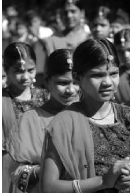
Goian, Afrikako emakumeak eta behean Indiako emakume talde bat ikasten. Ezkerrean, Indiako Gujarateko haurrak. HITZA