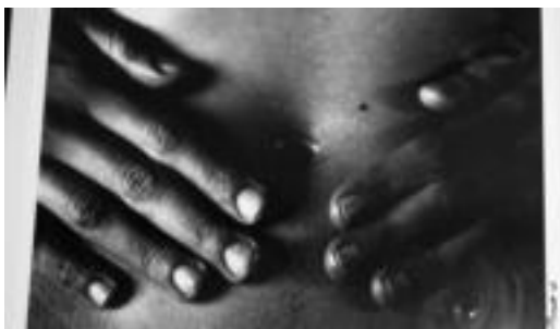
Gorputza. Giza gorputzari dagozkion atalak ere erretratatu ditu: irudian, emakume baten sabela, zuri beltzean. J. MERCADER