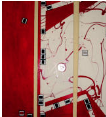
Triptikoa. Margolan bat ere badago: diapositibekin eta margoarekin osatu du. J. MERCADER