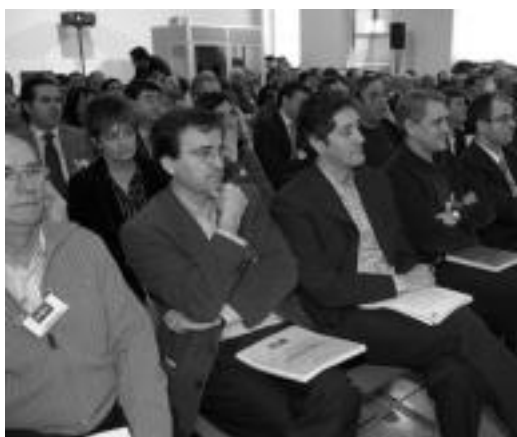
Hego Euskal Herriko 113 alkate bildu ziren denera. HITZA

baino handiagoa den sendotasun finantzarioa lortu dute. Baldintzatu gabeko finantzia-zioan, Espainiako udalek per