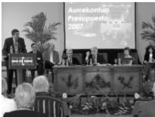
EUDEL-eko elkarteburu eta elkarteburu ordeak batzarrean. HITZA

EUDELen elkarteburuak ondorengoa adierazi zuen atzoko batzarrean: «Euskadiko udalek heldutasuna lortu dute, eta ohiko erregimeneko udalena