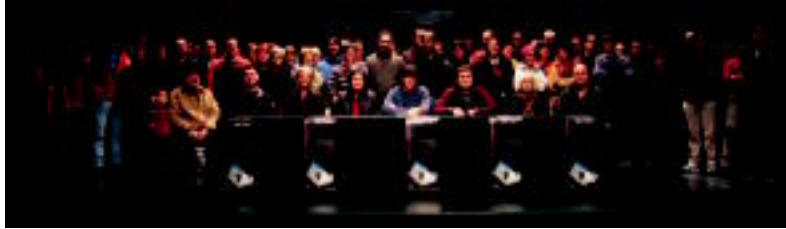
Eskualdeko inputatuek babesa jaso dute, Gurea aretoan egindako agerraldia, esaterako. NEREA URBIZU

Olarrak egungo mementu politikoaren baitan kokatzen du erabakia: «Nik uste datozen bi hilabeteetan Euskal Herrira-