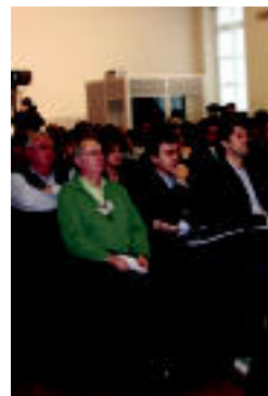
Euskadiko Udalen Elkartearen (EUDAL) Ohiko Batzarra. E. EZEIZA

GAIAK ▶ Lurzoru eta Hirigintza legea eta Euskadiko Udal legearen aurreproiektua aurkeztu zituzten ▶ 3