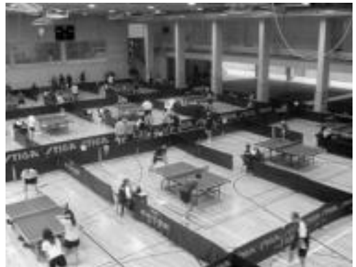
150 jokalaririk aritu ziren lehian Euskadiko Txapelketan. HITZA

Gipuzkoarrak nabarmen nagusitu ziren, 61 dominetatik 42 eskuratu baitzituzten