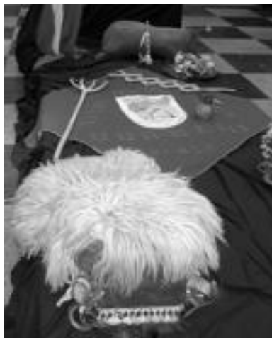
Tolosako Kultur Etxean dagoen erakusketak, Udaberri dantzari taldeak bere 50 urteetan zehar erabili dituen hainbat dantza tresna ikusteko aukera eskaintzen dio gerturatzen denari. A. IMAZ

rela jakin badakigu, baita ere taldeak jarraipena behar duela, horregatik nahiz eta ez gauden momentu onenean, aurrera joan behar dugu. Aurten baditugu ekitaldiren batzuk, adibidez Kataluniarako irteera bat eta airean dagoen Galiziarako beste bat. ◀