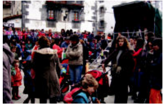
Herriko plaza jendez lepo bete zen arratsalde partean. N. GARZIA

▶ HITZAK ez du bere gain hartzen egunkarian adierazitako esanen eta iritzien erantzukizunik.