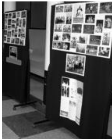
Argazkiak dira nagusi erakusketan. Paneletan bezala argazki albunetan ere aurkitzen dira, azken hauetan bidaia ezberdinetako argazkiak ikus daitezke. A. IMAZ