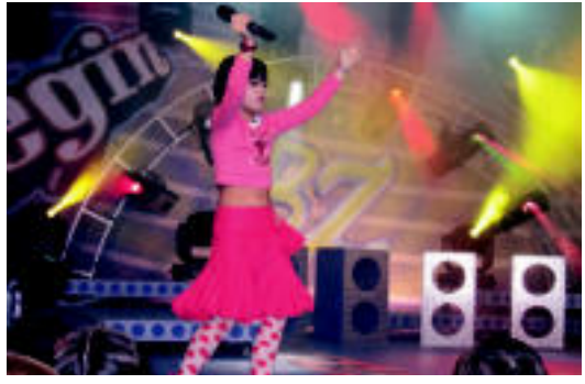
Artista gazteek ederki egin zuten euren lana.