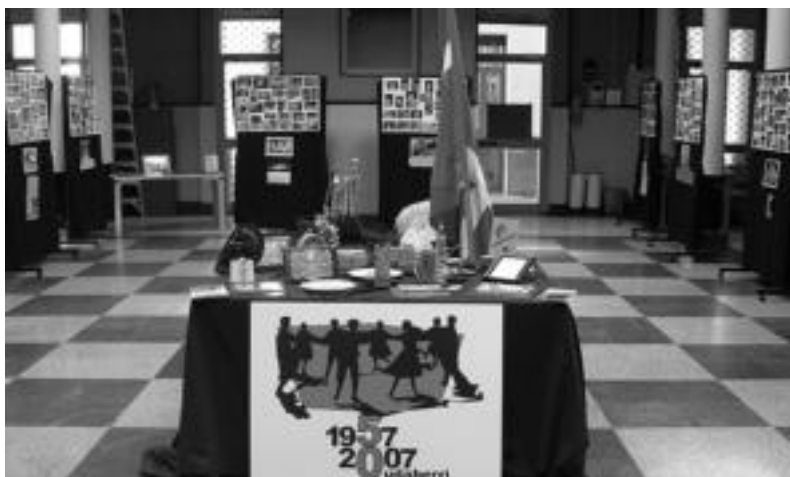
50 urtetako ibilbidea ikusteko aukera izango du gerturatzen denak. Erakusketa igandera arte izango da zabalik. Gaur eta igandean, 17:30etik 20:30era. Bihar, berriz goizez ere irekita egongo da; 10:00etatik 13:00etara, hain zuzen ere. Arratsaldean ohiko ordutegia izango du, 17:30etik 20:30era. A. I.