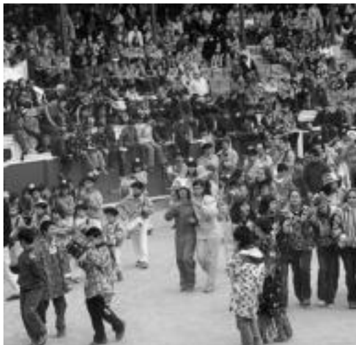
Lan handia egin zuten txarantgetako herria alaitzen.

Karroza eta konpartsei dagokionean, «ohikoa» den arazoa izan zen, ez ziela denbora eman talde guztiei ibilbidea egiteko. Horren arrazoietako bat, «karrozek geldialdi luzegiak egiten zituela izan zen». Irtenbide gisa, lehenagotik atez-