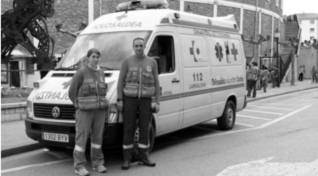
Larrialdi guztietarako prest izango dira Gurutze Gorriak; gehienak eskualdekoak badira ere lanean baxandakutuko dira Inauterietan. I.ASENSIO

Urteroko gauza da, Inauteriak goza ditzagun beste batzuk lanean aritu behar izaten dute; parrandan ibili eta lan egitea ez omen dira guztiz bateraezinak