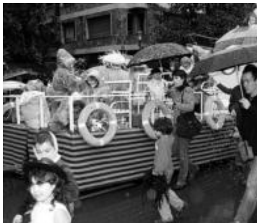
Konpartsa. Aurreko larunbatean moztorro irabazleak izan zirenak konpartsan atera ziren: Popeie marinelaren konpartsan. A. IMAZ

31. urtez, hamaika ume ikusi ahal izan ziren Tolosako kaleetan zehar. Danborrak lepotik edo gerritik zintzilik eta baketak eskuetan, hots zainduak egin zituzten haurrek. Eguraldiak ez zuen jendea desanimatu eta euritakoak eskuetan gurasoak, eta xirak soinean jantzita umeak, atera ziren desfilea egitera, San Frantzisko ibilbidea zeharkatuz, Triangulo plazara.