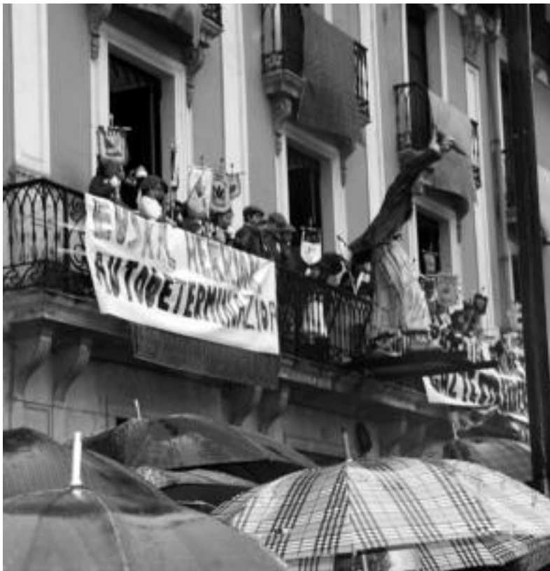
Balkoia. Kultur Etxeko balkoian Haur Danborradako kantinerak eta zuzendariak elkartu ziren. Zuzendari gazteek azken danbor soinuak bertatik zuzendu zituzten, kantinerak erritmoa mantentzen zuten bitartean. N. URBIZU