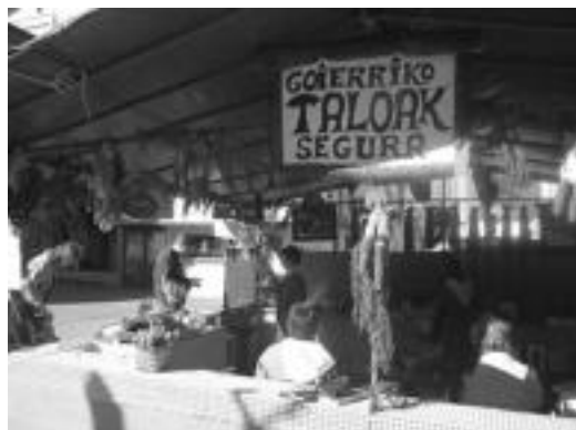
Taloak. Goierriko taloak eta Ataungo taloak izenpean, urtero bi postu egoten dira San Frantzisko etorbidean. E. EZEIZA