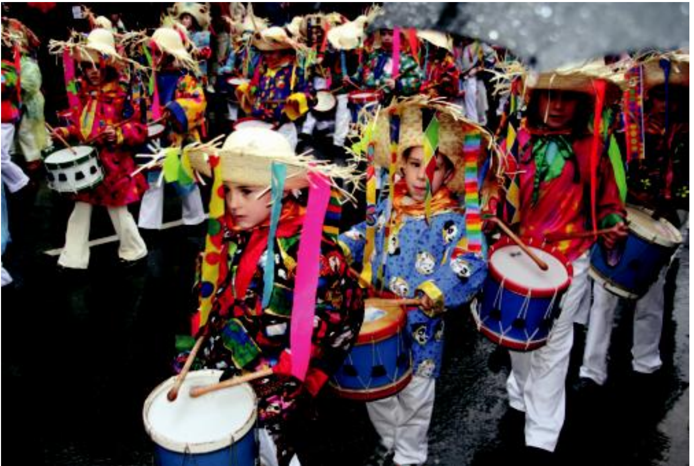
Txantxoak. Euriak danborrada busti zuen, baina ez zuen festa zapuzterik izan; umeez gogor jo zioten danborrari. NEREA URBIZU

ZALDUNITA ▶ Asteetan zehar tolosarrek prestatu dituzten konpartsak, karrozak eta mozorroak kalera aterako dituzte gaur ▶ 4-5