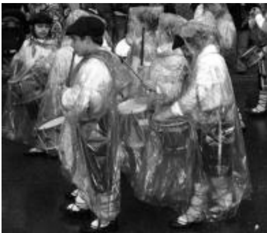
Marinelak. Itsasoko uraren beharrik ez zuten izan marinel gaztetxoek, galtzadan aurkitu baitzuten oinak bustitzeko adina ur. N. U.