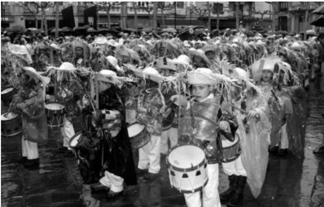
Txantxoak. Triangulo plazan denek batera jo zuten. Laskoraingoak izan dira aurtengo txantxoak. ASIER IMAZ