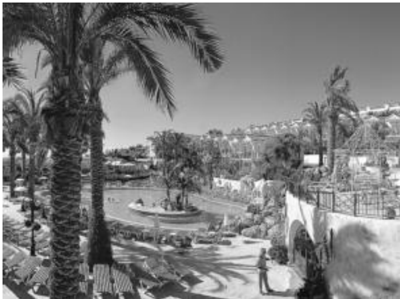
Kanariar uharteetara joan ohi da bidaia ugari Inauterietan. HITZA

Bidaia zutenen artean, ohikoa da ere urtero jende berdina topatzea. «Batzuk badira normalean joan-etorri bat egiten dutela neguan eta Inauterietatik aprobetxatzen dituzte horretarako. Horiek Kanariar uharteetara joaten dira», azaltzen du Etxarri. Cotok ere baieztatzen du hori: «Badago beti urtero errepikatzen due-