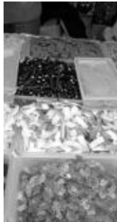
Gozokiak. Kolore bizi eta forma guztietako gozokiak. E. EZEIZA

baina aldi berean, gogorra aukeratu dute kale saltzaile hauek. Eguraldi ona nahiz txarra egin, ez dute hutsik egiten, eta iada, Tolosako Inauterietan zati bilakatu dira. Kalean ikusi eta bizi daitekeen paisaiaren osagarri dira.