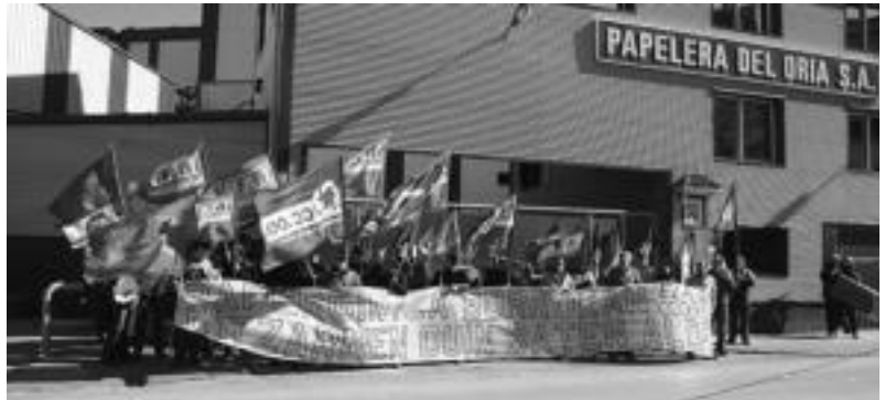
Oria paper fabrikaren aurrean egin zuten kontzentrazioan ertzainak ondoan izan zituzten. N. URBIZU

Eskualdeko paper fabrika guztietako langileek elkarretaratzea egin zuten