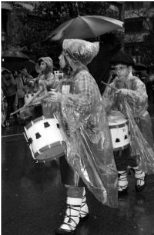
Errementariak. Eurpean desfilatu zuten San Frantzisko ibilbidetik Triangulo plazaraino. Sardeskak eskuetan hartu beharrean, makilak hartu zituzten. N. URBIZU