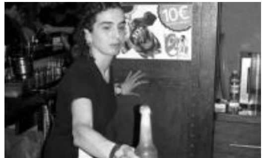
Garagardoa barra-barra zerbitu beharko dute K-2n egunotan.