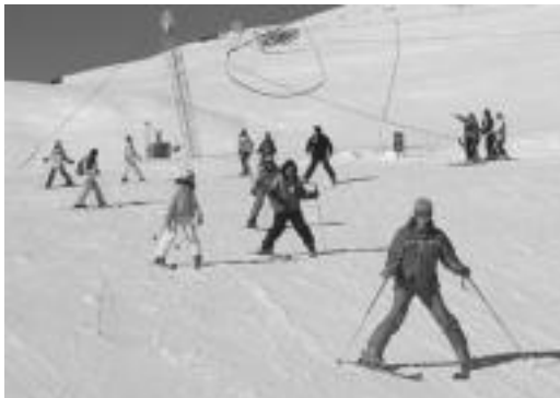
Lagun batzuk eski ikastaro bat egiten. HITZA

Bidaia zutenen artean, ez zutenen artean ere aldatzen dira urtearen poderioz. «Asko aldatu da Formigal. Lehenengo aldiz bertara joan nintzenez tele-