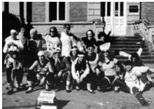
Aerobik-en ordeko euskal bik atera zuten Udaberrikoek 1998an. HITZA

Gero taldeak urte batzuetako hutsunea (1976-78) izan zuen eta 1979an berrindartu zen Bordondantza berritua aurkeztuz. Hirugarren belaunaldi honek atzerrira badaia dezente egin zituen: Britainia (1981 eta 1982), Ekialdeko Alemania (1984), Espainia (1985), Katalunia (1986), Irlanda (1987), Austria-Praga (1988). 25. urtemugako argitalpena eta ekitaldiak burutu ziren. Musikariet txaranga ere asko indartu zen garai honetan.