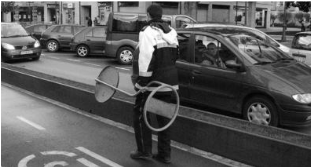
Trafikoa zuzendu, señalizazioa jarri, kaleak moztu, autoak aparkalekuetara zuzendu... lan ezberdinak egin beharko dituzte udaltzainek. HITZA