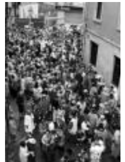
lazio Dianaren une bat. i. t.