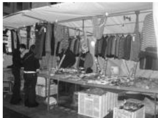
Arropa. Prakak, nikiak, poltsoak, Inauterietako osagarriak etabar erosi daitezke kaleko postu hauetan. E. EZEIZA