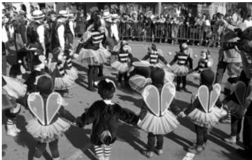
Villabona. Arratsaldeko hiruretan, Errebote plazan elkartu ziren herriko haurrak. Erle mozorroak, Txantxoeren jantziak, Charleston garaikoak eta Mari Motots ugari elkartu ziren bertan. Hainbat gurasok ere ikuskizuna erretratatu nahi izan zuten bere argazki eta bideo kamerekin. Ondoren kalejira egin zuten herritik. A.I.