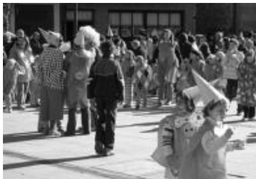
Ibarra. Goiz-goizetik hasi ziren festarekin Uzturpen. Gelaz gela argazkia atera ondoren, herriko plazara jeitsi ziren. Bertan, buruhaundiak, musika eta txistorra izan zituzten gerturatu ziren guztiak. Haurrak bezala irakasleak ere mozorrotu ziren. A. IMAZ