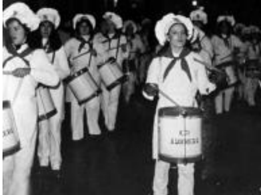
1983. urtean atera zen konpainiaren zenbait partaide.