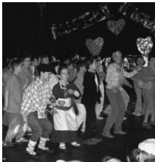
Anoeta-Irura. Ederki gozatu eta nahiko barre egin zuten Anoetako Herri Ikastolako eta Irurako Ikastolako ikasleek Inauteri Jaialdirako prestatutako esketx barregarriekin. HITZA