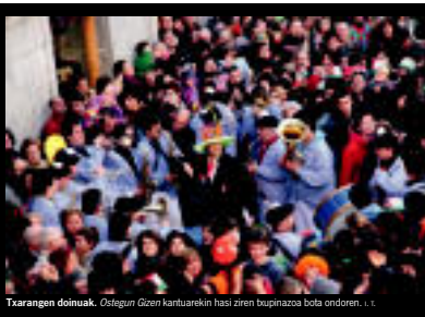
Txarangen doinuak, Otegun Gizon kartuarekin hasi ziren txupinazoa bota ondoren, I. T.