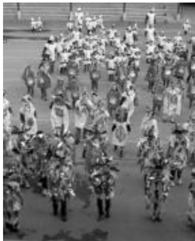
Berastegi. Astelehenean, Muñagorri eskolako 104 ikasleek energia iturri berriztagarriak gaia erabili zuten mozorrotzeko hizpide: itsaso, eguzkia, haize eta uraz jantzi ziren, kaleak kolorez beteaz. HITZA