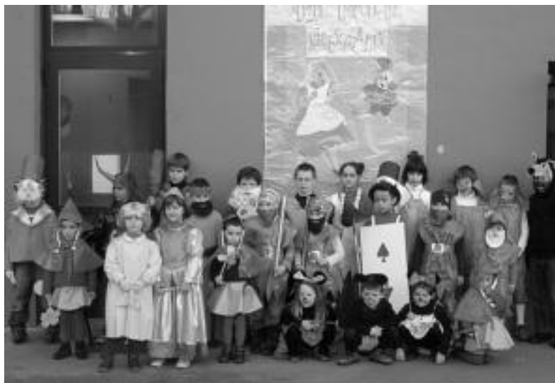
Tolosa. Inauteriak behar bezala hasteko, jaialdi handi bat egin zuten atzo Laskorain ikastolakoek. Hori dela eta, aurten ipuin klasikoan inguruan murgildu ziren, eta esaterako Hiru Txerriboez, Pabxi errementariak, Harriketarrez eta beste hainbat ipuinetako pertsonaiez mozorrotu ziren. HITZA

Gaur inauteriek jarraipena izango dute, bai Tolosa eta bai inguruko hainbat herrietan. Zizurkilan, atzo argitaratutakoa zuzenduz, gaur 15:00etan egingo dute kalejira eta Joxe Arregi plazako emanaldia.