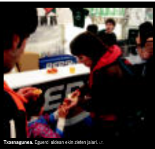
Txosnagunea, Eguerdi aldean ekin zieten jaiari, I. T.