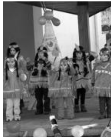
Albiztur. Indioz mozorrotu ziren atzo gazteak. Atzean etxebtoa zutela, irakasleen laguntzarekin, dantza bezei bat eskaini zieten hara gerturatutako gurasoei. E. EZEIZA