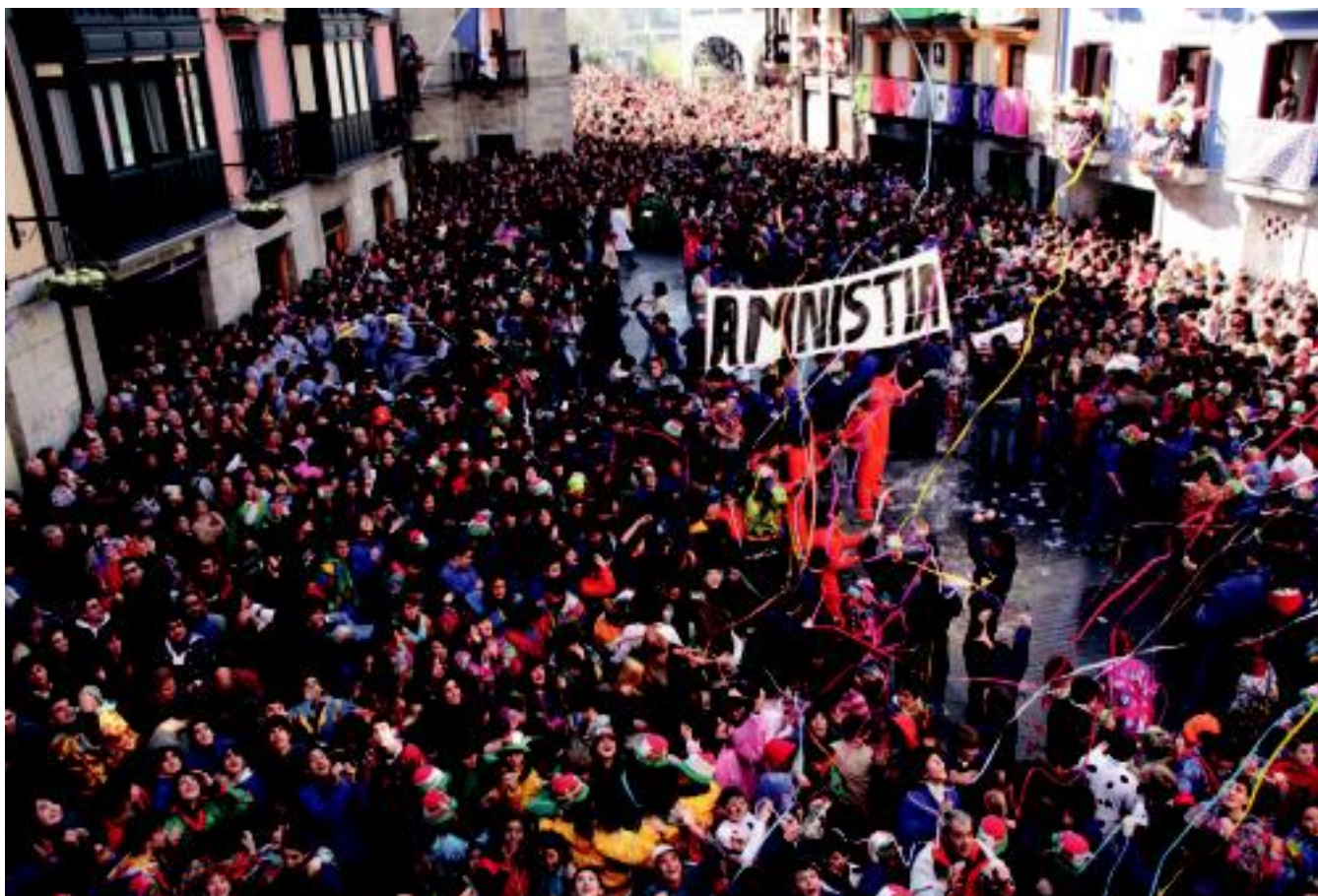
Tolosa. Ehunka lagun bildu ziren Alde Zaharrean Inauteriei ongiatorria emateko. I. TERRADILLOS

PREGOIA ▶ Jubilatuentzat Disneylandia modukoa antolatzea eta txuletoiaren festa izan zuten hizpide Kabi-Alai elkartekoek ▶ 2-6