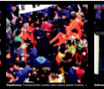
OpaKizuna, Txanpainarekin ospatu zuten batzuk, jaiaren hasiera, I. T.