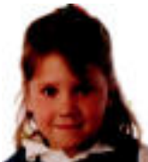
URTE ASKOAN 14 urte eta oraindik hain bikia? J.J. ...