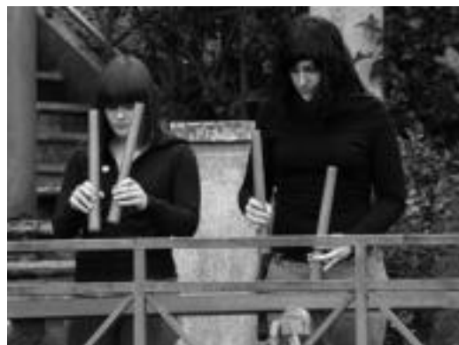
Ekitaldian txalaparta doinuekin hasi zuten entzugai.