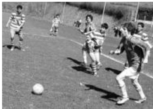
Aurrera, aurreko urteko denboraldian. J. ASTIBIA

Zeuk idatzi. Gure eskualdeari buruzko albisteak sartzeko aukera eskaintzen dizu gure webguneak Zeuk idatzi izena duen atalean. ▶