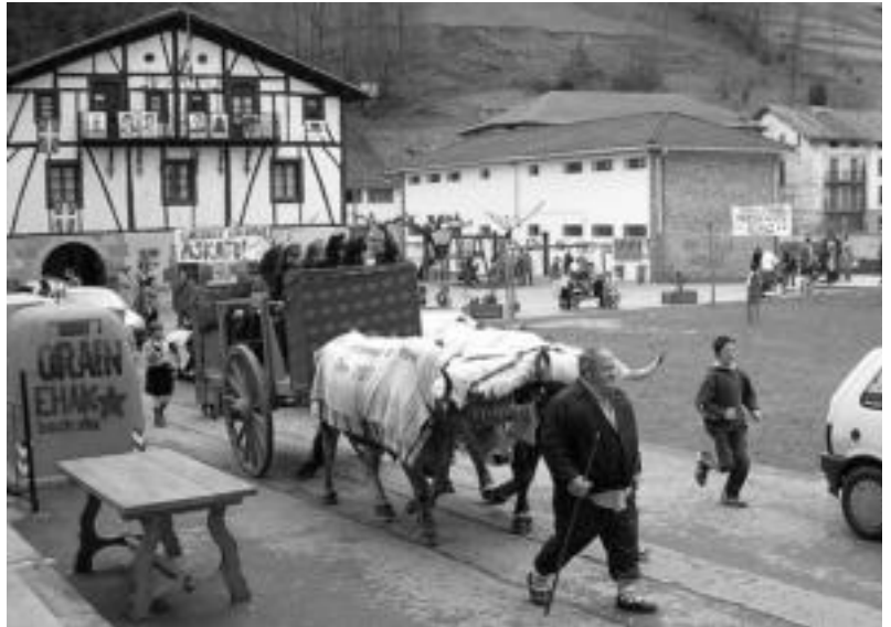
Inauterietan aukeratutako alkatesa eta udal korporazioa. IÑIGO ASENSIO

Herriko plazan ijito erreketarekin eman zitzaion amaiera Lizartzako inauteriei. Goizez, dantzariak eta txantxoak ibili ziren herriko kaleetan zehar puske-biltzen. Xoxa batzuk eta zer jana bildu eta gero, eguerdian, bertako usadio diren inauteri dantzen emanaldia eskaini zuten herriko plazan. Herri bazkaria eta Isk&bila txaranga alaitu zituen inauterien azken orduak.