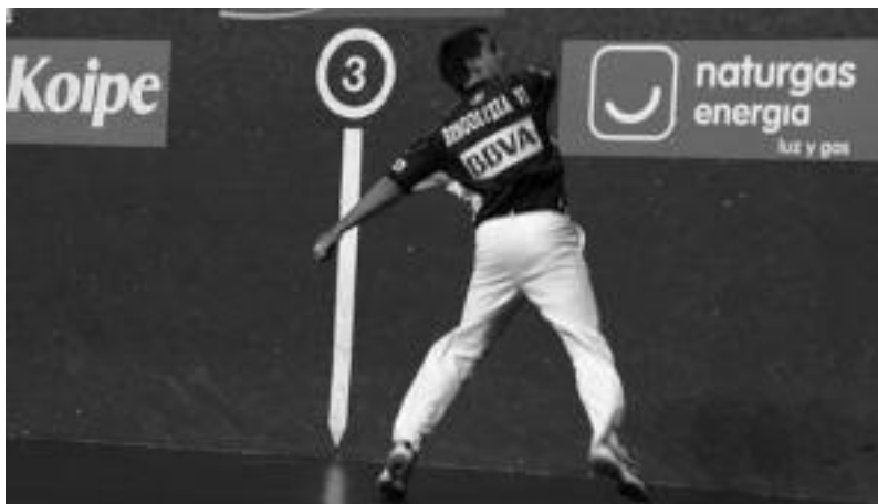
Bengoetxea VI.a Errastiren omenaldian.

Bai Olaizola I.ak baita Belokik ere «pilotari indar handia» ematen diotela adierazi du Leitzako aurrelariak, finalaurreko norgehiagokari begira