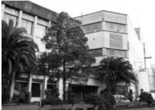
Amaroz auzoan kokatua dago izen bereko paper fabrika. E. EZEIZA

Bestalde, plana dela eta, oraindik ez dute zehaztu zerta-