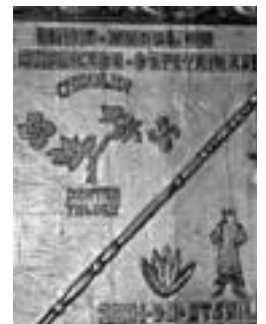
Otsolaroko ohorezko kapitain. A. I.

dantza taldea. Izena berriz ez da aspaldikoa, federazioan-eta izena eskatzen hasi ziren, diru laguntzetako eta. Orduan baikoitzak izen bat bota genuen,