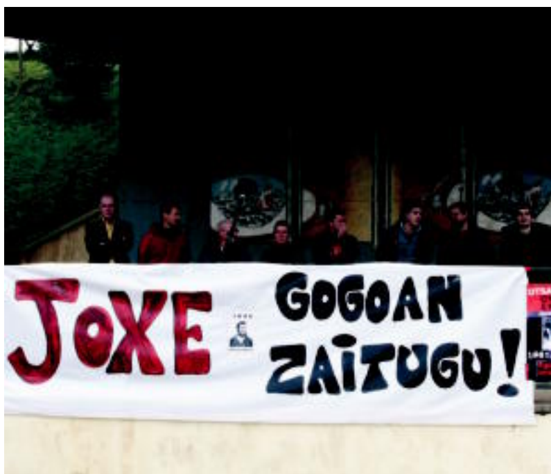
Herenegun egin zuten ekitaldia Zizurkilgo Joxe Arregi plazan. I. ASENSIO

ZIZURKIL ▶ TATk torturaren aurkako lan ildoak aurkeztu eta abiarazi duten kanpaina azaldu zuen ▶ 4