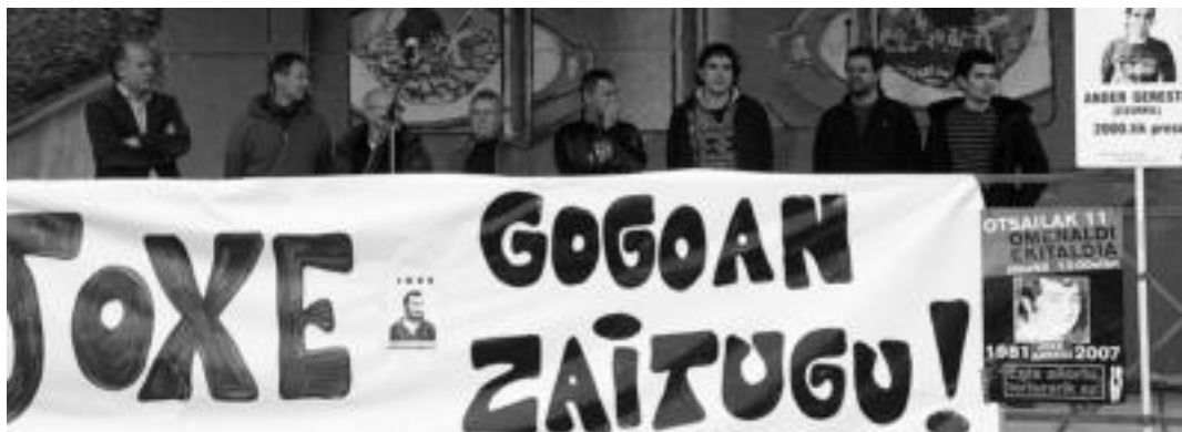
Torturaren Aurkako Taldeko kideak, herenegun Zizurkilgo Joxe Arregi plazan, haren omenez eginiko ekitaldian. I. ASENSIO

Ekitaldian, Torturaren Aurkako Taldeko kideek torturaren aurka adosturiko lan ildoak aurkeztu zituzten eta abiarazi duten kanpainaren berri eman zuten