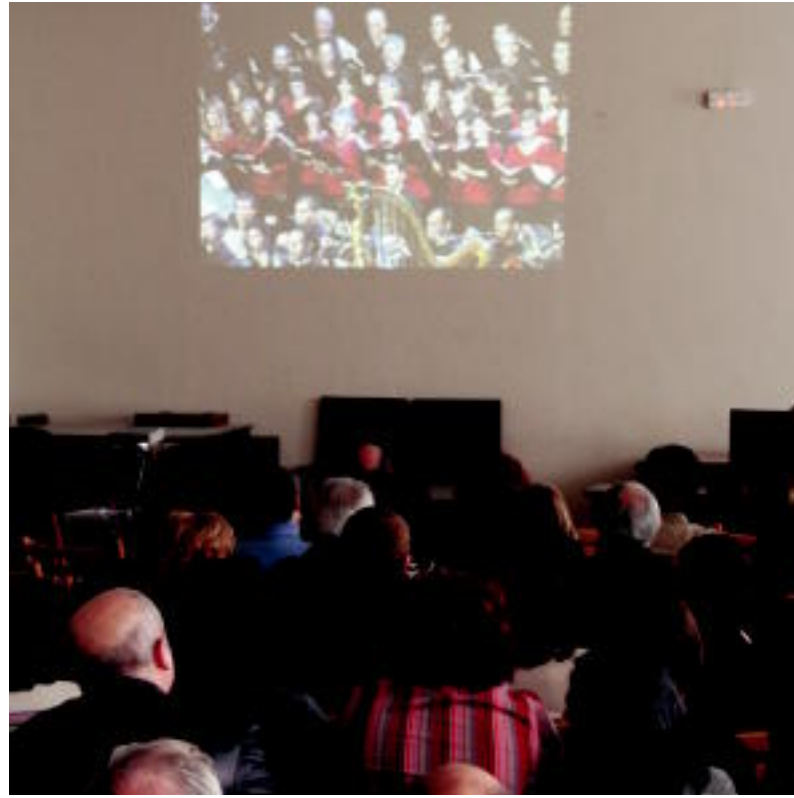
Jende ugari bildu zen Tolosa kantuan DVDaren aurkezpenean. I. ASENSIO

TOLOSA ▶ Udalak 'Tolosa kantuan' 750. urteurreneko kontzertua biltzen duen DVDa kaleratu du; herenegun egin zuten aurkezpena Musika Eskolan