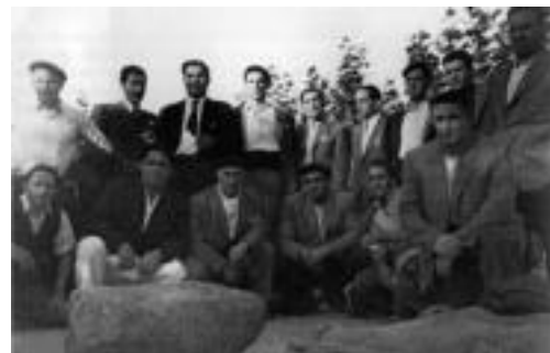
1947an egindako jaialdian parte hartu zuten karga-jasotzaileak, J.M. Oterminen Amezketa liburutik aterata.

Ezagunak dira Euskal Herrian egin izan diren apustuak eta zama kontuekin lotutako lehiatan euskaldunak trebeak izan direna. Amezketa Albitzuri Aundia sasi-apustu hauei esker egin zen ezagun.