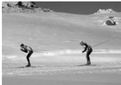
Rojaño aiak Candanchun joan den asteburuan. HITZA

Aurtengo elur eskasia dela-eta hau da lehen proba eta Mundu eta Europakoak puntuagarriak diren zenbait proba bertan behera geratu ziren.