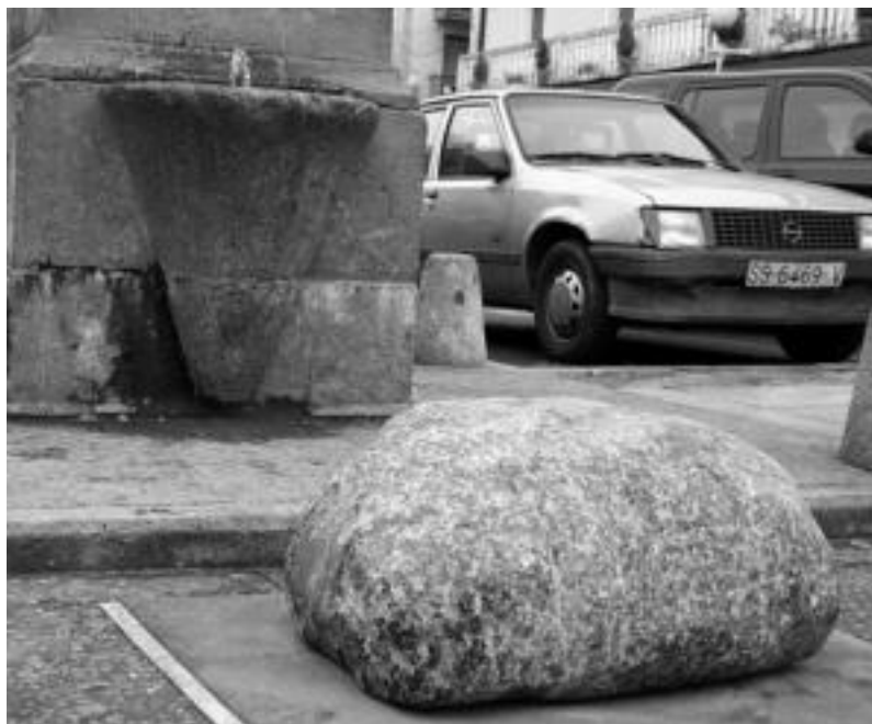
Bolumen handirik ez badu ere, 166 kilo ditu eta ez du heltzeko inongo lekurik. N. URBIZU

10 harri-jasotzaile bilduko dira pilotalekuan eta 10 minututan harriaren altxaera kopurua izango da kontuan