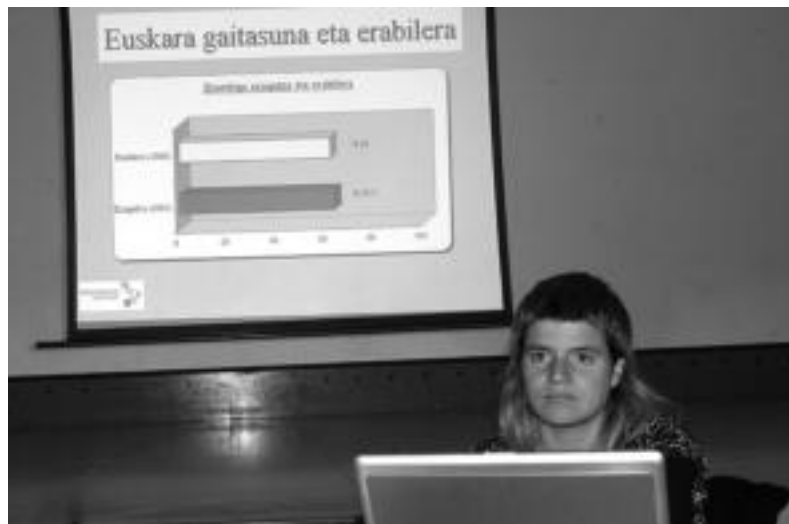
Larrait Garmendiak eskaini zituen Soziolinguistika Klusterrak buruturiko neurketaren datuak. M. SOROA

Adinaren arabera, haurrak dira euskaraz gehien hitz egiten dutenak; adinekoak ordea, gutxien mintzatzen direnak