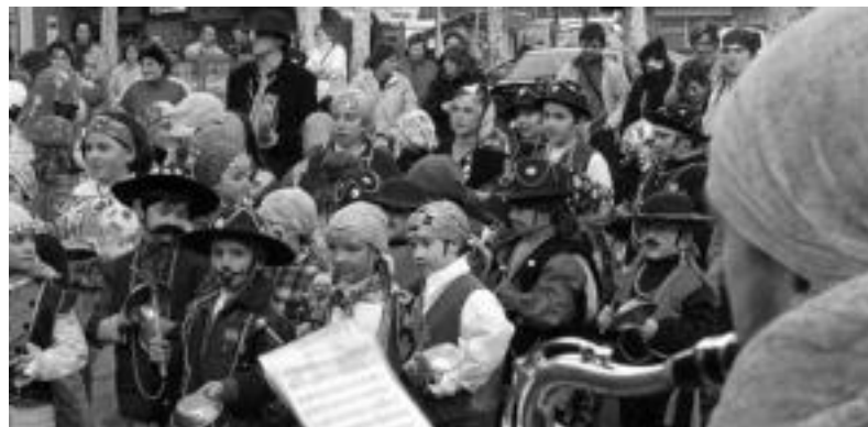
laz Anoetatik Irurara egin zuten ibilbidea Loatzo musika eskolakoekin batera herritarrek. N. URBIZU

Ibarra. Entsegu ugari egin dituzte azken egunetan gaurko kalejira behar bezala atera dadin. Loatzo musika eskolakoekin batera, herriko plaza-tik abiatuko dira herritarrek 18:00etan, ijitoz jantzita eta zartariak eskuetan.