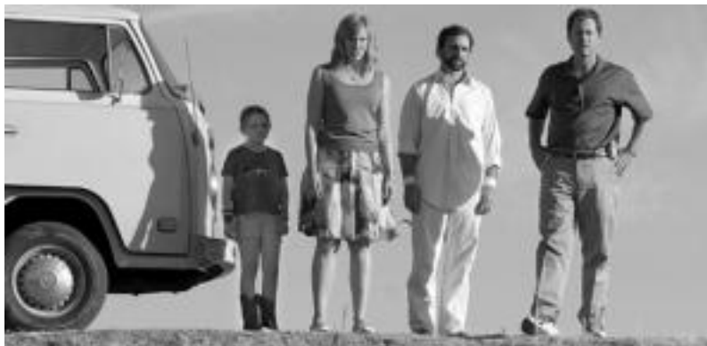
Olive, Miss Sunshine txikia (Little Miss Sunshine) filman. HITZA

2006ko Donostiako Ikusleen Saria irabazi zuen filmaren emanaldia 22:30ean izanen da, eta igandean, 19:30ean