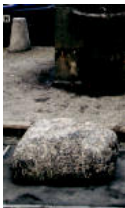
Albitzuri Aundia harria. N. URBIZU