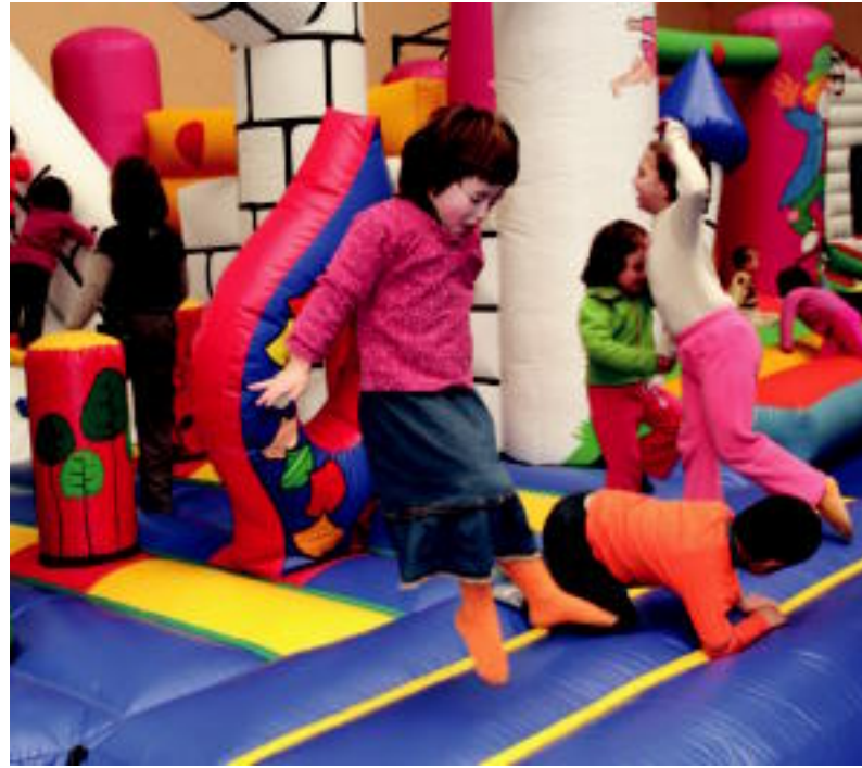
Puzgarrietan haur asko izan ziren: batzuk erori gabe salto egitea lortu zuten.

IBARRA ▶ Atzo amaitu zen Uzturpe ikastolako Kultur Astea, haurrei zuzenduriko jaialdiarekin; puzgarriak eta musika izan ziren Belabietako kiroldegian