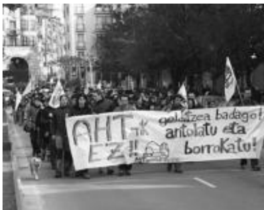
Triangulotik abiatu zen manifestazioa, lehenengo Alde Zaharrera joanez, San Frantzisko etorbidean berriz azalduz. N. U.

Manifestazioaren bukaeran idatzi bat irakurri zuten: «Udaletxeen betebeharrak da kalte-