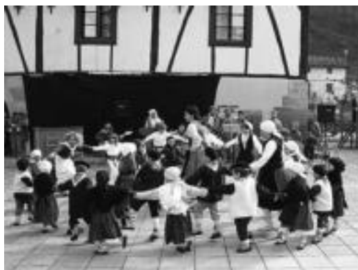
Otsolar dantza taldekoek saio bat eskaini zuten atzo goizean. HITZA