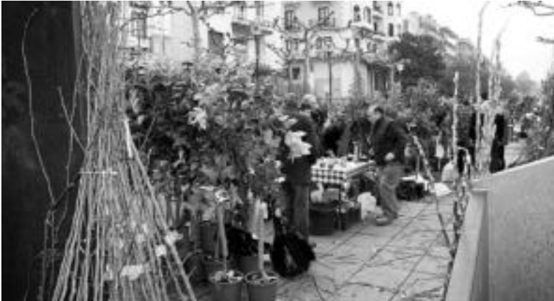
Hurrengo urteetan horrelako zuhaitzek emango dituzten fruituen adibideak ere izan ziren. N. URBIZU

Arrosa landareak izan ziren eguneko deigarrienak eta salduenak