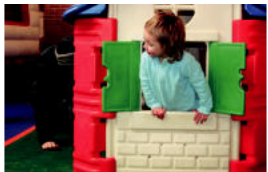
Guraso batzuk ere animatu ziren haurren jostailuekin jostatzera. N. U.