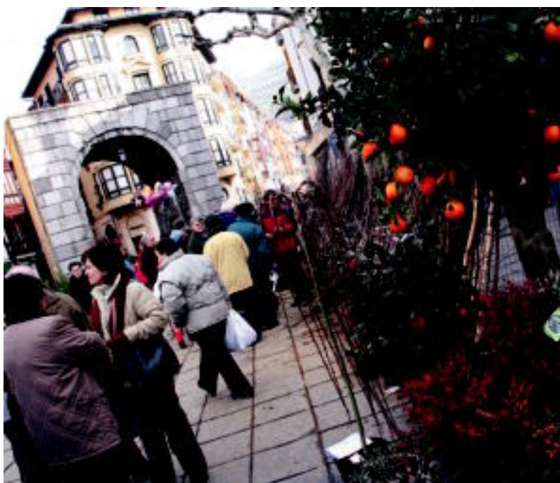
Zuhaitzez gain, landare eta lore ederrak izan ziren ikusgai.

POSTUAK ▶ Guztira 18 izan ziren Triangulon, bi eskualdekoak; salduena arrosa landarea izan zen ▶ 4