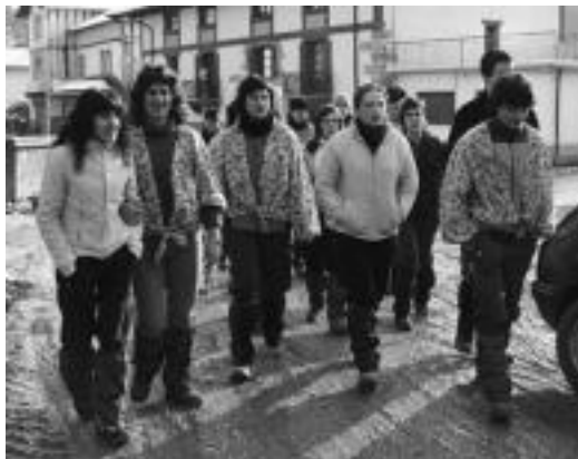
Gosaldu ondoren eskean hasi ziren Aresokoak. N. URBIZU