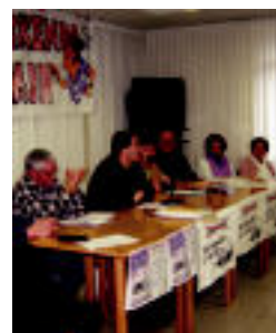
Atzoko agerraldia. E. EZEIZA

Gerontologikoaren Aldeko Plataformak informazioa luzatu die herritarrei ▶ 5