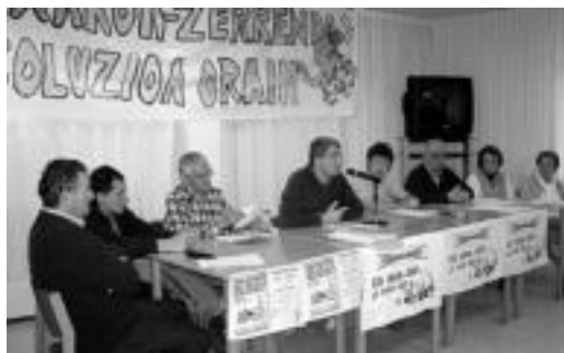
Gerontologikoaren aldeko plataformak atzo deitutako batzarra.

Oraindik ere, hasieratik plazaratu zuten proposamenarekin jarraitzen dute: aurretik zegoen egoitzan berrkuntzak egitea, eta hau, Iurreamendi Fundazioak kudeatzea. «Kudeaketa pribatua izateak kalitate kentzen baitio egoitzari, ho-