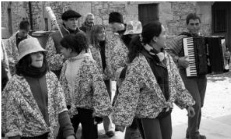
2006. urteko Aresoko inauterietan, eskean.

Areson inauteriak asteburu honetan soilik ospatuko dituzten arren, Lizartzako inauteriekin ez da gauza bera gertatzen, bi asteburutako iraupena izaten baitute