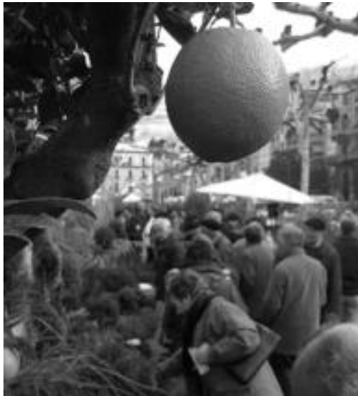
luz, San Frantzisko ibilbidean egin zuten Azoka Berezia. I. GARCIA

Aurtengoan, San Blas Eguna iristearekin batera etorriko zaigu urteko lehenbizikoa. Hala, bihar goizean goizetik Triangulo plaza zuhaitzez, zuhaixkaz eta bestelako landarez beteko zaigu, XII. Zuhaitz Egunean. Bertan, ez dute hutsik egingo urteroko mintegiek, eta mintegi berriak ere