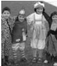
Lizartzako inauteriak, 2005. I.T.

txarangen irteera. Denak elkarrekin Errota ataririk aterako dira.