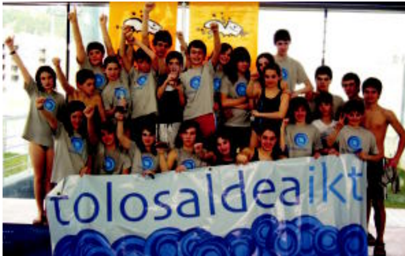
1995 eta 96 urteetan jaiotako IKTko igerilariak lan bikaina egin zuten joan den astean Lasarten. HITZA

TOLOSALDEA ▶ Joan den asteburuan Lasarten emaitza bikainak lortu dituzte 95 eta 96 urteetan jaiotako IKT taldeko igerilari gazteak