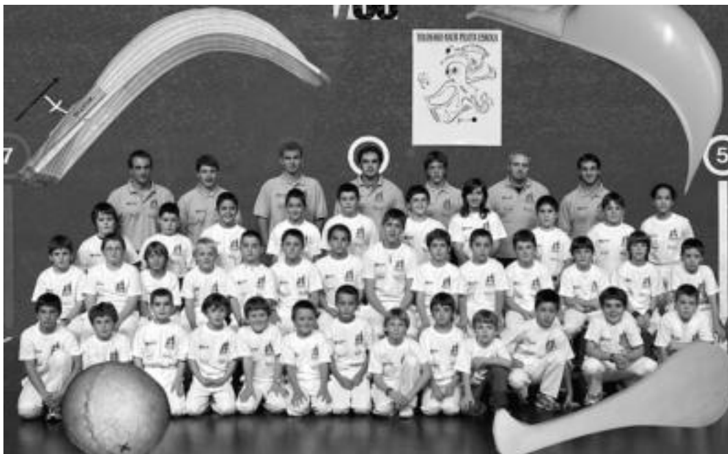
Tolosako Haur Pilota Eskolako taldea, ikasleekin eta entrenatzaileekin. HITZA

Gaur egun, gauza gehienetan, zenbat eta lehenago hasi ikasten, hobea dela, pentsatzen da, eta haurrak, askoz ere hobeto ikasiko duela txiki-txikitik hasiz gero. Baina talde honen kasua ez da hau, eta pilota mundurako, pentsaera ho-