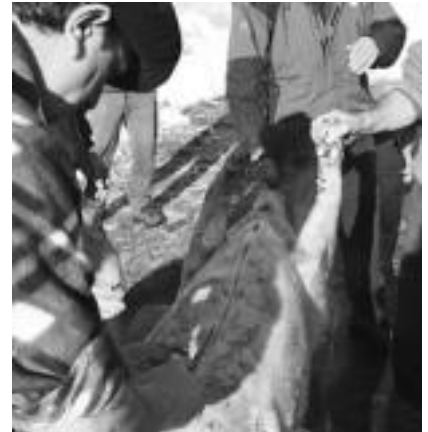
Azken pausoa, txerria hustu eta zatiak gordetzea.