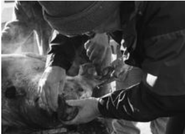
Ohitura jarraituz, txerria erre ondoren, teila zatiekien garbitu zuten azaleko zikina.