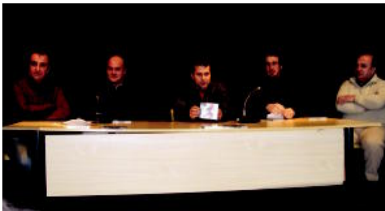
Larrañaga, Leon, Bildarratz, Iturzaeta eta Arandia izan ziren diskoa aurkezten. ENERITZ MAIZ

Txarangak hamasei abestirekin kaleratu duen diskoa, 10 euroren truke eskura daiteke dendetan eta tabernetan