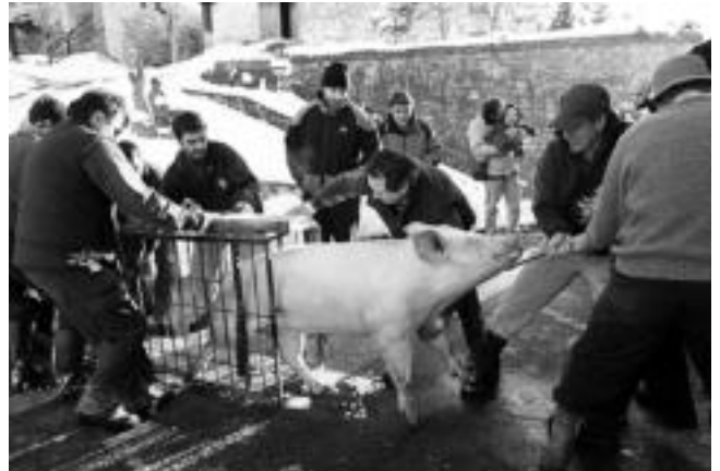
Ikusmira handia sortu zen herrian, txerria hiltzea, ordea, gizonen lana izan zen.