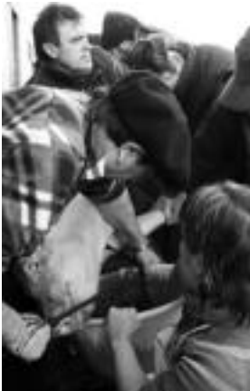
Odolkietarako beharrezko odola.