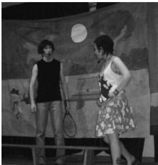
Inork bere herrian edota auzoan antzezten ikusi nahi badituzte, gogotsu daude Txotx antzerki taldekoak. HITZA