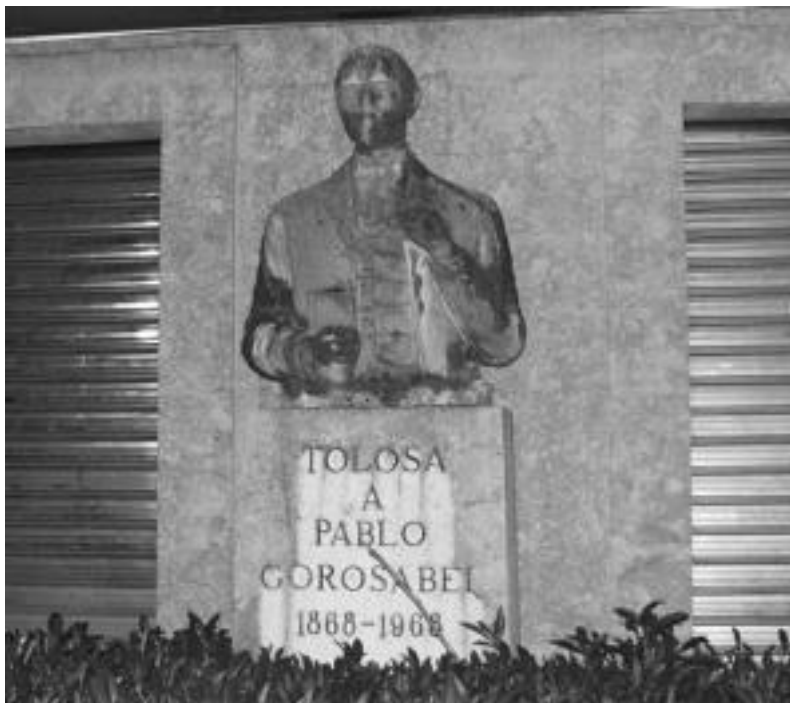
Bere izena daraman Tolosako kalean dago ipinita bere irudia.