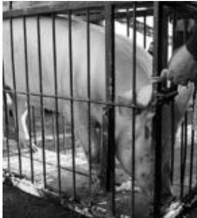
Beteluko txerri gazteari San Martina iritsi zitzaion.

Orexako herriak 100 biztanle-tik gora dituela ospatzeko txerri festa burutu zuten herritarrek atzo usadio zaharra jarraituz. Goizean txerria hil ondoren eta prestakizunetan murgildurik, bazkaria eta afaria egin zituzten herritarrek jai giroan.