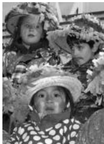
Umeak. Ikasle txikiak lotsatienak izan arren, gurasoen begirunea errez lortzen dute soinean dituzten koloreekin. N. GARZIA