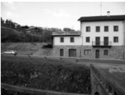
Irubitarte etxea eraitsi eta biribilgune berria egingo dute. I. GARCIA

Udalak BOEn inguruan herritarren kezka argituko ditu, otsailetik aurrera