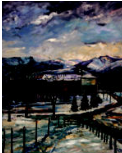
Urkiu. Gaurko eguna izan zitekeen Urkizuko paisaia: elurra mendian eta teilatuetan. Elurra irudikatze ez du zuria bakarrik erabili, ordea. I. M.