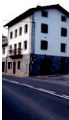
Irubitarte eraitsi eta biribilgunea egingo dute. I. G.

LEITZA ▶ Gazteek jaialdia egin zuten, musika eta dantzaz alaiturik; gaur eskean ariko dira eta gauean kontzertuak izango dira ▶ 7