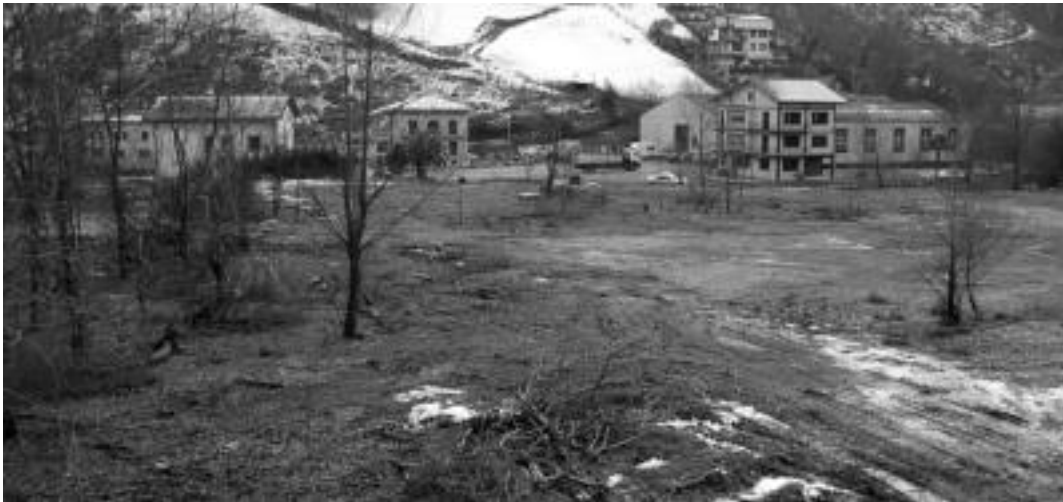
Lizarain zerrategia zegoen lurzorua irudia; atzean Villabonatik Asteasura doan errepidea ikusi daiteke. I. GARCIA