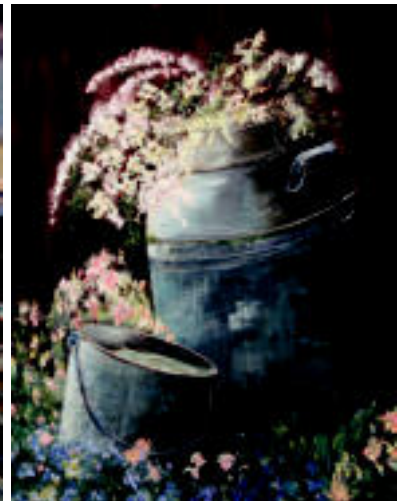
Marmitak. Tresna zaharra loreez apaindurik gehiago edertzen du margolana, marmitaren berezko funtzioa ia alde batera utziz. I. MUJIKA