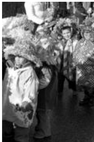
Txantxoak. Umeen artean bi talde atera ziren txantxo jantzita, batzuk txilabarekin, besteak, zakuarekin. N. GARZIA