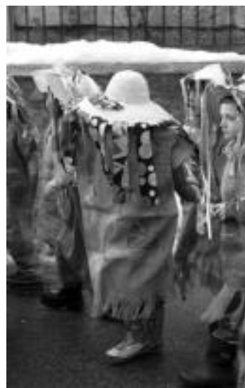
Kalejira. Musikaren laguntzarekin herrian gora joan ziren umebo guztiak, eskutik hartuta, dantzatzu. N. GARZIA