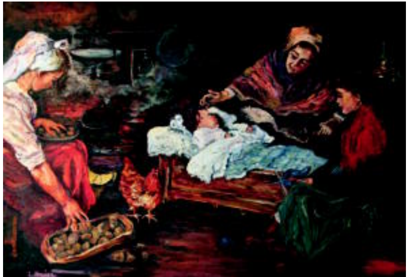
Antzinako sukalde. Eguneroko bizitza irudikatu du sukalde honetan: sukaldeko beroan, animaliak, janaria eta familia osoa elkarrekin. Duela mende batzuetako egoera izango litzateke. ISABEL MUJIKA

Artistaren margolanak otsailaren 12ra arte egongo dira Alegiko jubilatuen tabernan ikusgai eta salgai, eta urte osoan zehar, berriz, Tolosako Cafes Egian dauzka margolan batzuk.