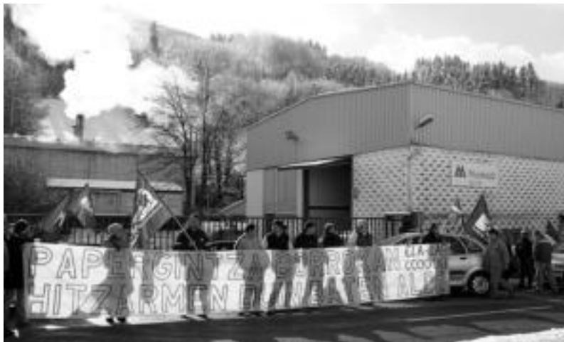
Berastegiko Munksjö enpresaren aurrean elkarretaratzea egin zuten atzo eguerdian. E. EZEIZA

ELA, LAB, CCOO eta UGTk adostuta, oraindik Adegirekin akordioetara iritsi ez direnez, batzarrak egiten hasiko dira