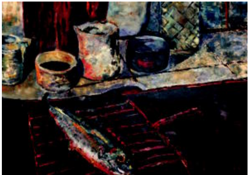
Txitxarro. Margolan honetan argi ikusten da xehetasuna bilatzen duela artistak kasu askotan. Gorriarekin berotasuna eta suaren isla egiten du. I. MUJIKA