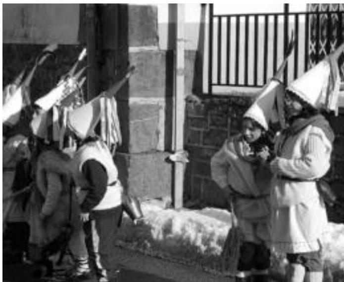
Zanpantzarrak. Zanpantzarrak Nafarroako inauterietako herri askotako simbolo dira. Eskolako kale-jiran horrelakoak ikustea ohikoa da. NAIARA GARZIA