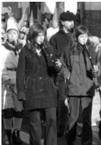
Txistua. Txistulariak ez dira inoiz falta herriko jai eta kale-jiratan. N. GARZIA