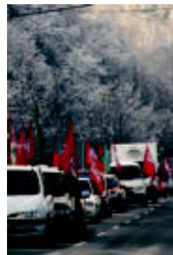
Auto karabana. E. EZEIZA

TOLOSALDEA ▶ Akordiorik lortu ez dutenez, batzarrak egingo dituzte