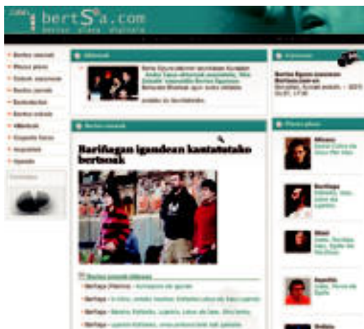
Bertsoa.com helbidearen atzoko hasiera orria.