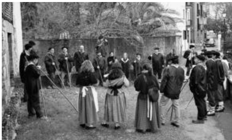
Iaz Santa Ageda bezperan Ibarako herritarrek kantatzen aritu zireneko irudia.

Goizeko ekitaldiei dagokionez, 09:30ean abiatuko da taldea San Bartolome plazatik eta ikastola dagoen alderdian —Ospela— baserriz baserri ariko da kantari. Eguerdian, indarrak berritzeko parada izango dute Sendi-Ekintza elkartearen antolatutako bazkarian. Bertara azaldu nahi duenak 12 euro ordaindu beharko ditu.