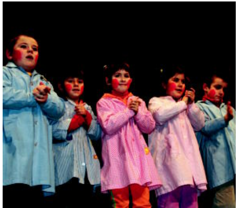
Astoa ikusi nuen abestia antzeztu zuten. I. GARCIA

VILLABONA ▶ Jesusen Bihotza Ikastolak antolatu duen I. Kultur Astearen baitan Lehen Hezkuntzako ikasleek emanaldiak egin zituzten atzo Gurea aretoan