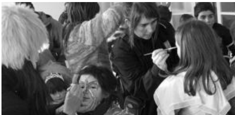
Aurreko urteko makillaje tailerra. J. ASTIBIA

Aurrera kirol elkarteak, Leitzako Udala, Guraso Elkarteak eta Atekabeltza Gaztetxearen artean antolatu dituzte 4 egun hauetarako ekitaldi guztiak