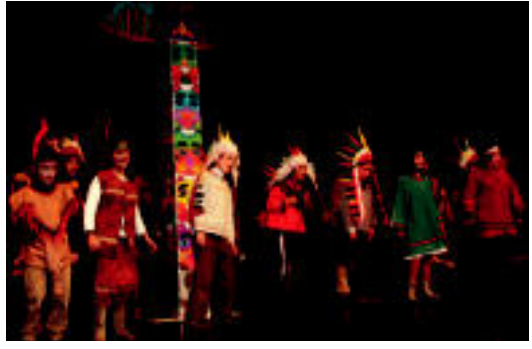
Ipar Amerikako indiarrei buruzko kanta bat antzeztu zuten. I. GARCIA