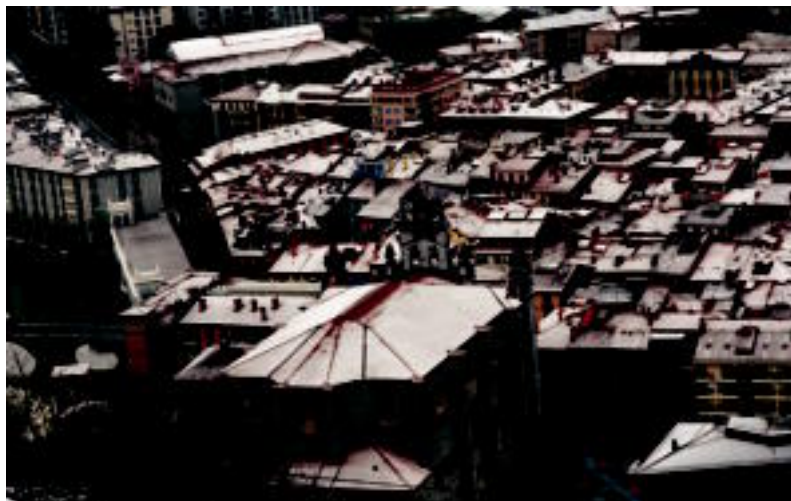
Itxura hau ageri zuen atzokoan Tolosako Alde Zaharrak. I. TERRADILLOS

65 zentimetro batu zituzten atzo Leitzan; ikusi beharko da gaurkoan zer ondorio uzten dituen elurrak, izan ere, iragarpenen arabera, gaurkoa izango da egunik gogorra.