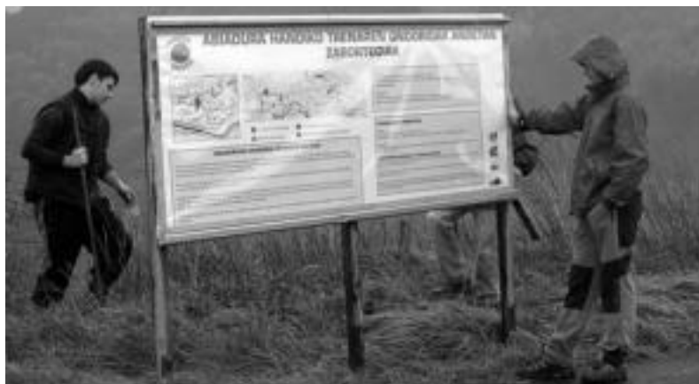
Joan den abenduan panel informatiboa jarri zuten Larratz zabortegiaren eta Hernialderen artean. N. URBIZU

Jardunaldiak, mendi martxa eta manifestazio bat antolatu ditu AHT Gelditu! elkarlanak bost egunetan zehar Tolosan