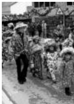
2006ko umeen kalejira.

aterako dira. Karrozak, berriz, ohiko lekutik: industrialdetik. 12:00. Txu-Txu trenak herrian barrena ibiliko da. 14:30. Atxauren herri bazkaria. 16:00. Txu-Txu trenak herrian ibiliko da. 18:00. Incansables txarangarekin atxaureen kalejira eskoletatik. 19:00. Gau-Bela taldea karrapen. 23:30. Gau-Bela taldea karrapen. Ondoren Incansables