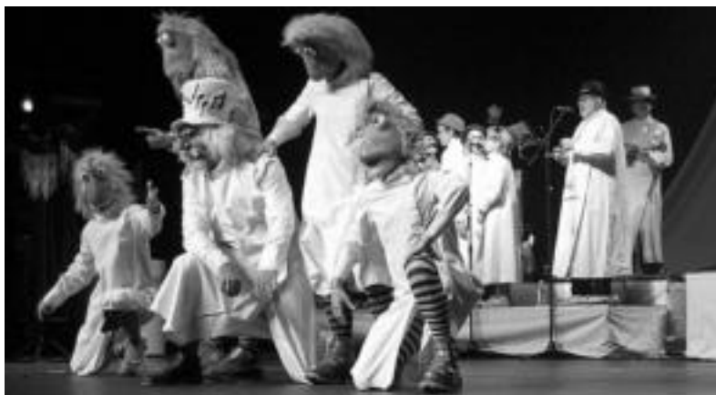
Oskorri eta Kukubiltxoren emanaldia izan zen ikusienetako bat, denera 758 ikusle jaso zituen. J. ASTIBIA

2006ko kultur balantzea agertu dute Udal ordezkariak; gustura daude antzoki eraberrituak jaso duen harrerarekin