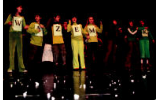
Wazemank telebista saioko esketak bertsotan eman zituzten. I. GARCIA

▶ HITZAK ez du bere gain hartzen egunkarian adierazitako esanen eta irizien erantzukizunik.