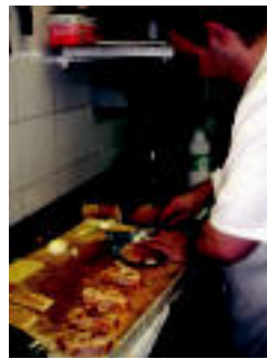
Pintxoak prestatzen. HITZA

Ikastaroa 20 euroren truke izango da eta gutxienez 25 urte izan behar dira izena emateko. Taldean gutxienez