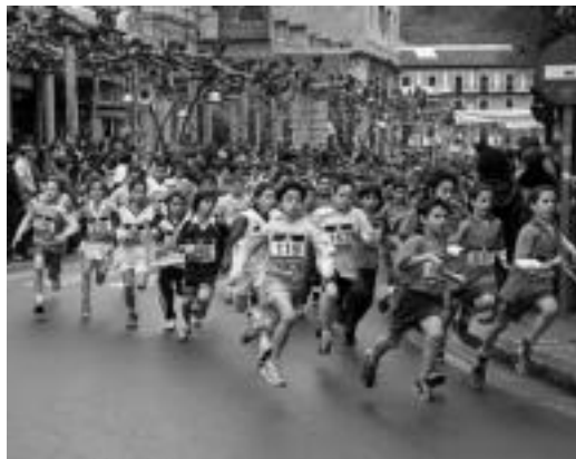
637 haurrek hartu zuten parte XX edizio honetan. N. LIZARTZA