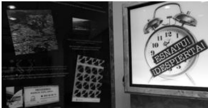
Amesgaiztorik ez! hiri hondakinen erakusketa ostiralera arte egongo da ikusgai Kultur Etxean. MADDI SOROA

«Konponbidearen zati bat gizartearen esku» dagoela ohararazi nahi dute hiri hondakinen erakusketarekin