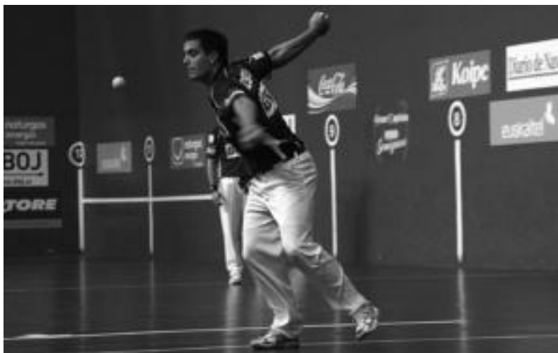
Bengoetxea VI.a Errastiren profesional mailako azken partidari. E.EZEIZA