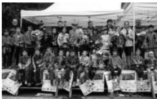
Lore sortak eta dominak banatu zituzten irabazleen artean. N. LIZARTZA

hartzailak adinaren eta generoaren arabera, ibilbidea ere ezberdina izan zelarik hauen-tzat. Lasterketaren ondoren