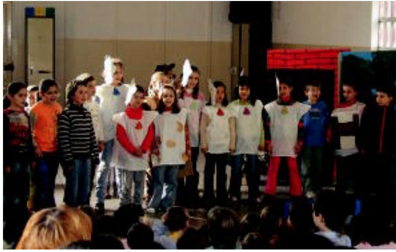
Gaztekoek ederki igaro zuten antzeztanean, guraso eta ikasleekin begiradapean.

Lehen aldia da Britainia Handitik kanpo egindako material didaktikoei sari hau ematen zaiena. Azken lau urteetan atzera eginez, Cambridge University Press, Oxford University Press eta ingelesezko hitzegiak egiten dituen McMillan argitaletxea izan dira, hurrenez hurren, sarituak. Aurten Gipuzkoako Ikastolen Elkarteari eman diote. «Ez da izan inondik ere sarian pentsatuta egindako CD-ROMa, aspaldidanik