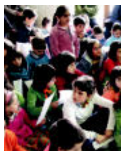
Pleno aretoa, atzo.

Ikasleek herriaren eta ingurunearen diagnostia egingo dute eta Udalari martxoan aurkeztuko dizkiote ondorioak ▶ 4