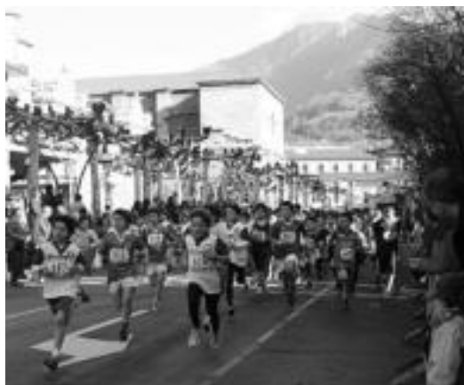
Pasa den urteko Ero-Etxe krosaren une bat.

11:30ean abiatuko dira gaztetxoak 3 mailatan banaturik; trafiko neurriak hartu dituzte krosak irauten duen artean