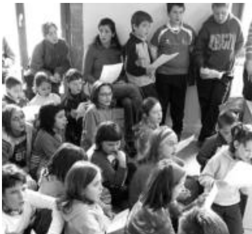
Ikasleek bertso bat abestu zuten ekitaldiaren amaieran.

Zizurkilgo Udalak eta herriko hiru ikastetxeek —San Millan Eskola, Pedro Mari Otaño Eskola eta Jesusen Bihotza Ikastola— hitzarmena sinatu zuten atzo Eskola Agenda 21aren inguruan, eta horrekin batera zenbait konpromiso hartu zituzten. Hiru ikastetxeko ikasleek, hondakinaren gaia ardatz hartuta, herria nola ikusten duten jasoko dute eta martxoaren amaieran berriro bilduko dira Udalarekin diagnostikoaren berri emateko. Udalak konpromisoa hartzen du bildutako informazio hori jaso eta erantzuna emateko. Ikasleek neurriak hartuko dituzte ahal duten hondakin gutxiena sortzeko.