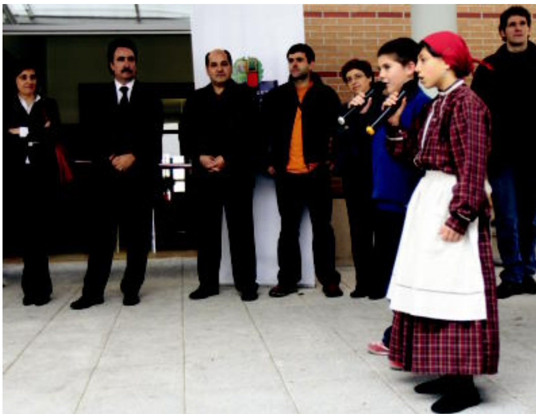
Eskola berriaren atarian, agintariak eta bertsoak abestu zituzten gazteboak, atzoko ekitaldian. M. SOROA

ALDAKETA ▶ Eraikin berria oso egokia dela eta toki onean dagoela dio Renobales zuzendariak ▶ 6