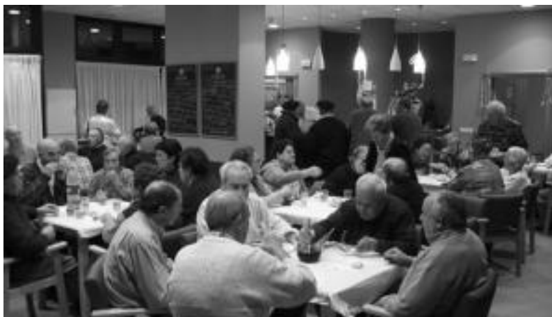
Berrogei lagun inguruztako toki dago Alkartasuna Biltokiko jantokian.

Aurkezten diren eskaintza guztiak aztertuko dituzte, adinekoen beharrak ondoen betetzen dituen aukeratzeko