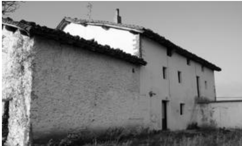
Kalea baserrian eguneko zentroa eta gazteentzako areto bat egiteko asmoa dute. N. URBIZU