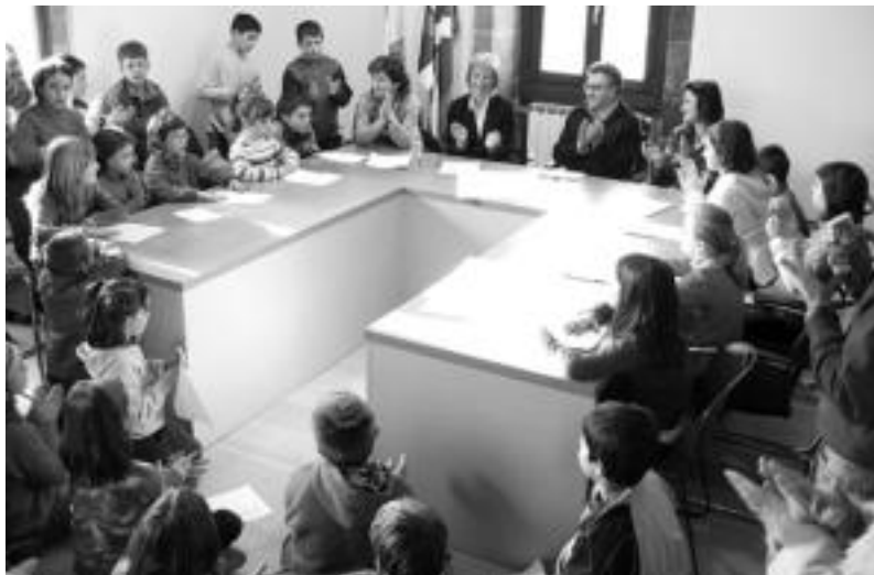
Udaletxeko pleno aretoan bildu ziren, atzo, hitzarmenaren sinaketa egiteko.

Udalak eskolek egingo duten diagnosiari erantzuna emateko konpromisoa hartu du eta ikasleek ingurunea zaintzekoa