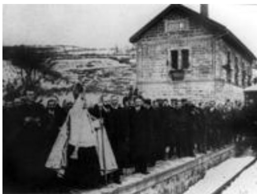
Plazaolak inauguratu zuten egunean bedeinkazioa jaso zuen. HITZA

bestetik etorritako trenak elkartu eta Iruñera abiatu ziren, elurra mara-mara ari zuen nekuko egun hotz hartan. Iruñera 12:45ean iritsi zen Plazaola eta bidaia amaitutakoan otordu