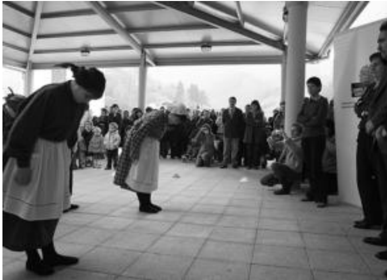
Eskolako haurrak agurra dantzaten aurrean eskolako zuzendaria eta ordezkariak dituztela. M. SOROA

Berrobiko eskola ofizialki atzo inauguratu bazuten ere, lehen aldiz iraileko lehen eskola egunean ireki zituen atea. Orduantxe ikusi eta ezagutu zuten eskola bertako ikasle eta irakasleek. Eskola berrira joan aurretiko bidea, ordea, ez da erraza izan askorentzat; sarritan ez baita erraza izaten pazientziatzain zahar jakitea. Lehengo eskola zabaldu zuten zegoen dagoeneko eta kokapena