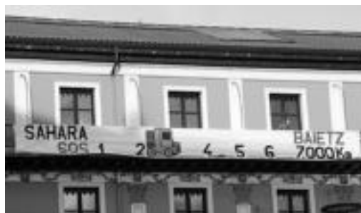
2.000 kilo baino gehiago bildu dituzte jada. I.T.