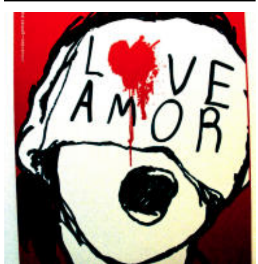
Ruben Egidoren eta Villuendas + Gomez Disseny-ren lanak.