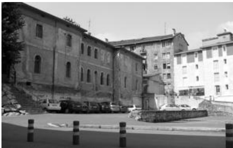
Inguru hauetan eraikiko dira Gerontologiko berria, eta 500 aparkalekuak. E. EZEIZA

Alondegian inguruan eraikiko dituzten 500 aparkalekuetarako sartu-irtena errazteko erosi du Udalak eraikin zaharra