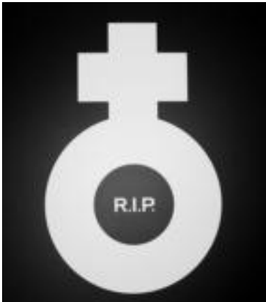
Pepe Quintas-ek eginikoa da hau.