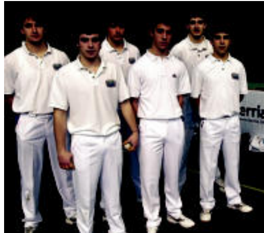
Zazpi-Iturrikoak, I. Berria Txapelketako txapeldunak.

Pilotariak beste txapelketetan ere dabilta: Berrian, Euskadiko Klub Txapelketan eta Udaberriko Txapelketan. Zazpi-Iturrikoek igandean Euskadiko Txapelketako norgehiagoka batzuk izango dituzte, eta Aurrera-Saiazekoen etzi, 17:00etatik aurrera Beotibar pilotalekuan. Jubenila eta se-