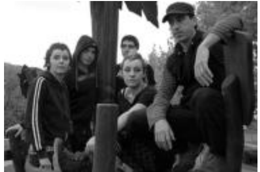
Keike musika taldea bost kidek osatzen dute. HITZA