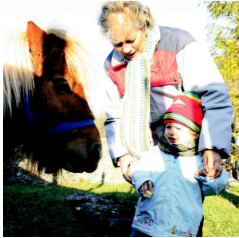
Haurbo bat Poni izeneko poneyari jaten eman nahian eta izuari aurre eginez. MADDI SOROA

BERASTEGI ▶ Urtero moduan San Anton Eguna ospatu zuten atzokoan Berastegiko ermitan, herriko animaliek urte ona igaro ahal izateko