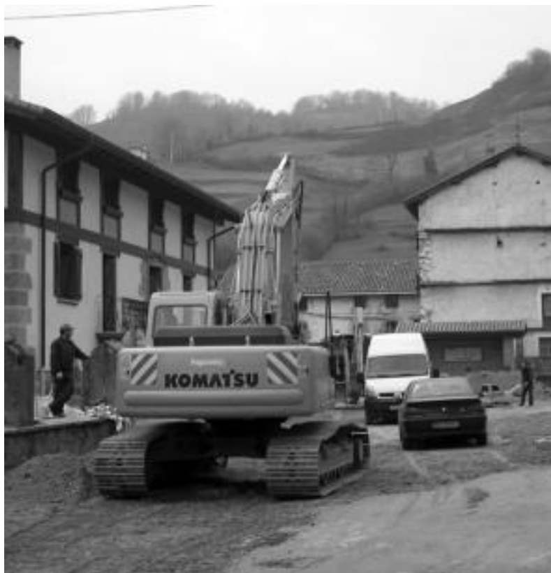
Autoak eta makinak, denak batera. N. GARZIA

Elutseder industrialdeko lanak, berriz, ez dira oraindik hasi, Udala Nafarroako Gobernuko baimen baten zain baitago