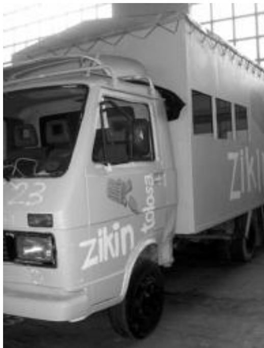
Dagoeneko ari dira aurtengo Inauterietako gauzak prestatzen. E. EZEIZA