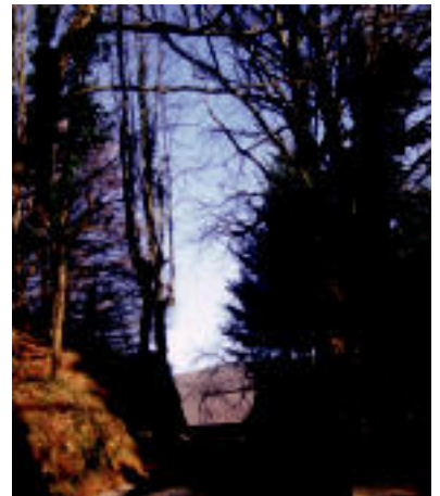
Orain. Ostegunean amaitu zuten Iruñegira baserrira doan pista. Hainbeste urteren ondoren asfaltatzeko bidea egin dute eta bizilagunak pozik gelditu dira emaitzarekin. N. GARZIA