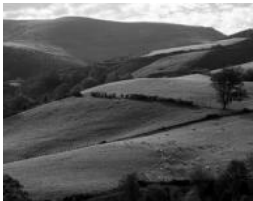
Artzamendiko 926 metroko altueran kokatzen da. HITZA

Txangoan parte hartu nahi dutenek 943 69 44 58 telefono zenbakira deituz eman ahal