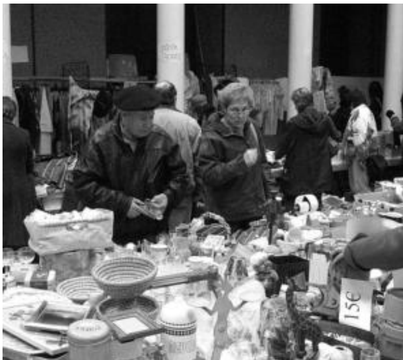
Pasa den urtean baino jende gehiago izan dela aurten azpimarratu dute antolatzaileek. IÑIGO TERRADILLOS

Ekuadortarrak eta sahararrak lagunduko dituzte aurten, Ikastolak antolatutako ekimen honekin lortutakoarekin