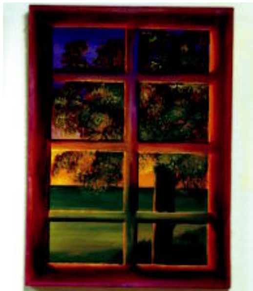
Margoarekin erliebea irudikatzen. Erliebean dagoela badirudi ere, dena margotuta dago, maila berean guztia. EDURNE SUDUPE