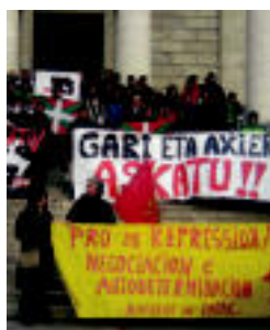
Konzentrazioa Pauen. HITZA

Beharrezkoak diren dokumentu ofizialak falta direla argudiatu dute ▶ 6