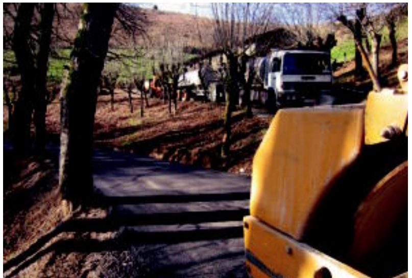
Lanak. Asfaltatze lanak ez dira oso luzeak izan. Baserri bakoitzeko pistak egun berean hasi eta amaitu dituzte. Pista hauek oso luzeak ez diren arren, makinaria ugari jarri zuten marbxan metro horiek asfaltatzeko. Gauzak horrela, ostegun eta ostiralean, Elutseder ingurua kamioiez josia egon zen. N. GARZIA