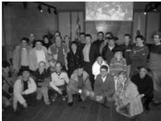
Joan den urteko irabazleak Udal ordezkariekin batera. N. LATABURU

Antolatzaileek azaldu dutenaren arabera, debekatua dago konpartsa edo karrozen publikitate egitea. Arratsalde-