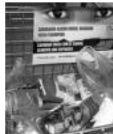
Janari bilketa Eroskin. E. MAIZ

Kultur Etxean nahiz udaletxean. Eskualdeko herri gehienek hartzen dute parte III. Euskal Karaban. Herriko Kultur Etxean nahiz udaletxean utzi ahalko dira dilistak, hegaluzea, arroza, azukrea eta konpresak hilaren amaierara arte.