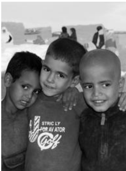
3 saharar gazteko. Atzean iristen den laguntza jasotzen. i. t.

Sahararen Aldeko III. Euskal Karabana martxan da; dilistak, hegaluzea, arroza, azukrea eta konpresak bilduko dituzte