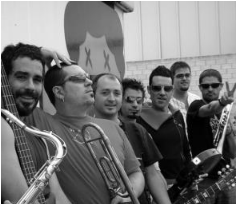
Betagarrikoen kontzertua izan zen Alegiko Gaztetxeko arrakastatsuen. HITZA

XIX. urteurrena bukatuta Betagarriren kontzertua, egunez egindako ekitaldia eta playback-a azpimarratu dituzte