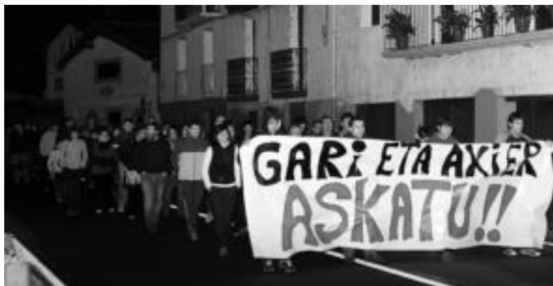
Berrehundik gora lagunek «Etxeberria eta Larrinaga askatzeko» herenegun eginiko manifestaldia. M. SOROA

tenbidea den bake prozesuan konpromisoak har ditzaten exijitzen diogu inplikatu guztiei».