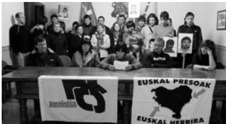
Axurdario plataformako kideak «kezkatuta» agertu dira Etxeberria eta Larrinagaren egoeraz. MADDI SOROA

Halaber, «Euskal Herriak Frantziako eta Espainiako bi estatuekin duen gatazkaren ir-