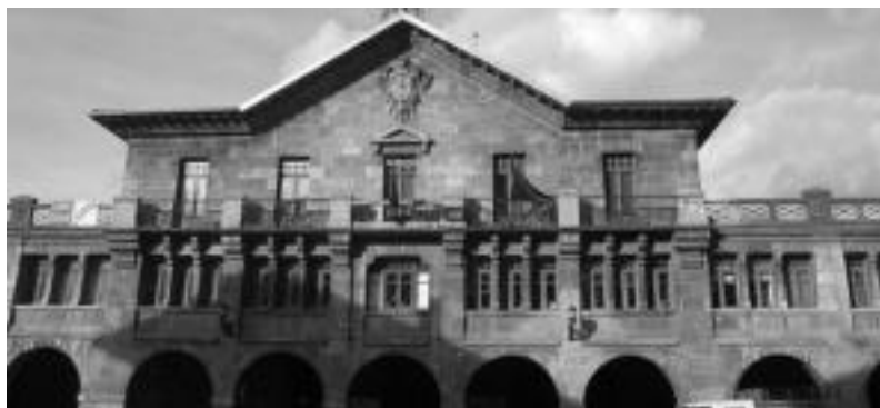
Leizako udaletxea. N. GARZIA

Herriko talde politiko guztiak izan ziren joan den asteleheneko osoko bilkuran eta hiru mozio onartu zituzten