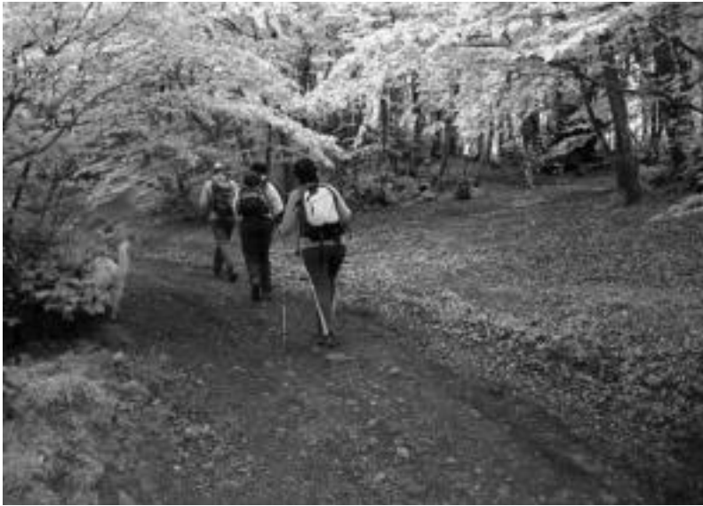
Kerexetako basoan zehar Aizkardi mendi elkarteak egindako mendi irteera. HITZA

Urteroko mendi irteeren egitarauak atera dituzte mendi taldeek; Euskal Herri osoan zeharkaldiak egiteko aukera eskaintzen dute