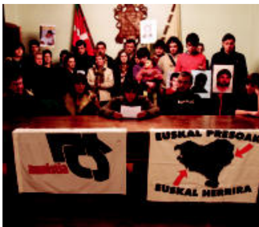
Axurdario plataformakoak, atzo eginiko prentsaurrekoan.

ALDARRIKAPENAK ▶ Axurdario plataformak «kezka» azaldu du eta Etxeberria «aske uztea» eskatu du ▶ 5