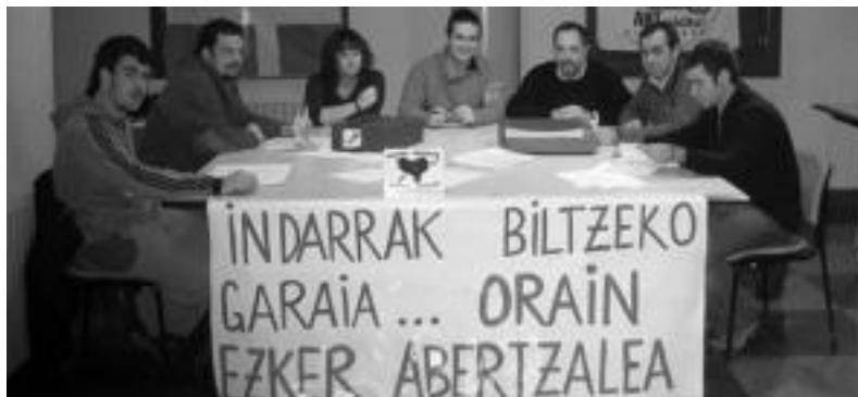
Anoetako ezker abertzalearen udal hauteskundeetarako koordinazio-taldearen kideak.

Herriaren diagnostika egin eta diagnosi hori batzarrean eztabaidatzea izan da lehen pausua. Ondoren, herri programa lantzeari ekin zioten. Zirriborroa prest izan zutenean batzar batean aurkeztu eta denen artean aztertzeak aukera izan zuten. Hori honetan, «kidegoaren eta herritarren ekarpenak jaso eta herri programa osatzen ari gara, gero herriko eragileekin gure iritzia kontrastatu, eta batzarretan, guztion adostasunez, programa hori fintzeko».