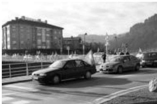
Tolosatik abiatu zen auto karabana. I. TERRADILLOS

Andoaindik Hernanira joan ziren Celulosas de Hernani eta Zikunaga lantegiak dauden le-