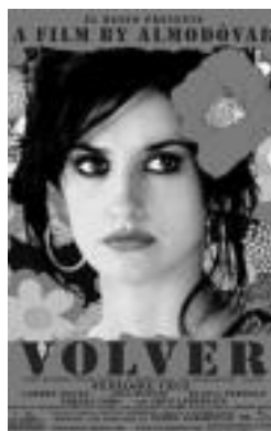
Filmaren kartela. HITZA

mundua aztertzen du beste behin zinema zuzendariak. Unibertso hau abiapuntutzat hartuz, heriotzari begietara so egiten dio zuzendariak, hildako emakume baten istorioa