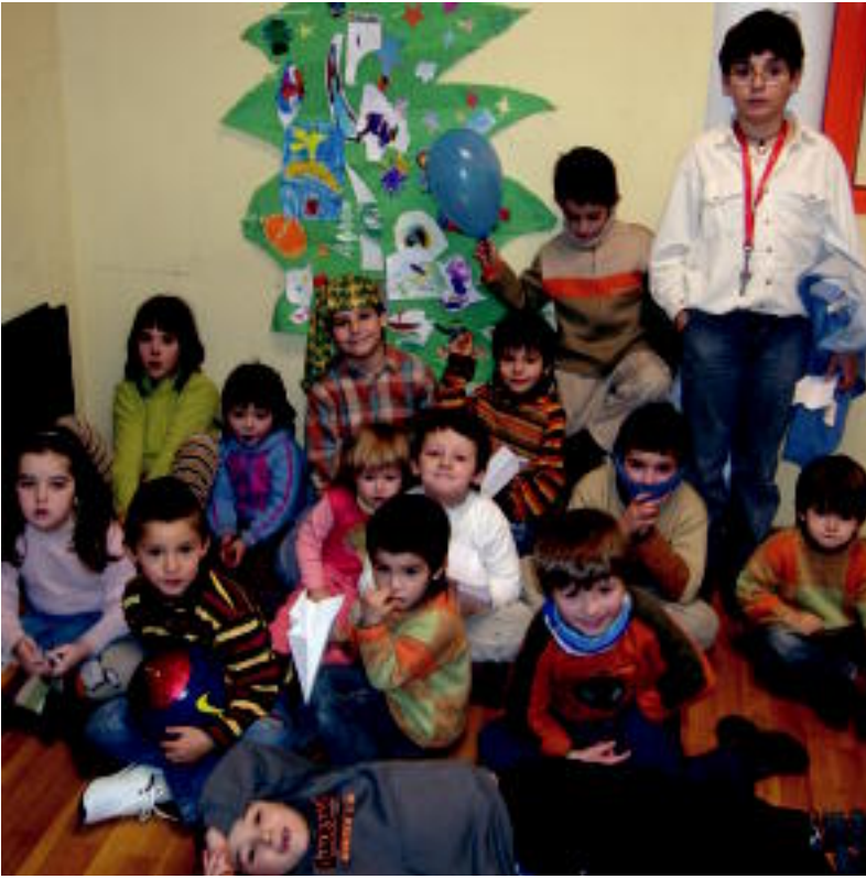
Jolas ugari egin dituzte Gabonetan eskualdeko gazteboek Galtzaundi ludotekan. HITZA

TOLOSA ▶ Galtzaundik Gabonetako ludotekaren gaineko balorazio «oso baikorra» egin du; Ibarra, Tolosa, Anoeta eta Irurako haurrak izan dira bertan