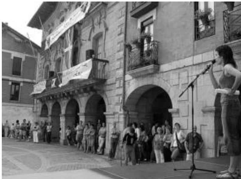
Alegian, UEMA Eguna ospatu zuten: euskara sendo dagoen arren, euskara taldea garrantzitsua da. M. SOROA

Tolosaldean Bai Euskarari akordio eta konpromiso prozesua garatzen ari da; 13 entitatek dute Ziurtagiria