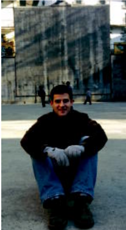
ANEXO ONEILLA / AIZGARI PRESS

Kontua ez zen uzte muen ala ez, lur jota murgola eta gaizki pasatzen ari nintzela baina. Lesioak itzultzeko egia zenuen lehen aldiz ez al zela goiztiago izan? Orain begiratu da Ordehan, atera nintzenezan, munduko fedeguztariaren irten nintzen, eta nire burua manomanista