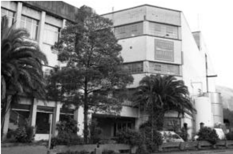
Amaroz auzoan kokatuta dago 175 urteko historia duen Amaroz paper fabrika.