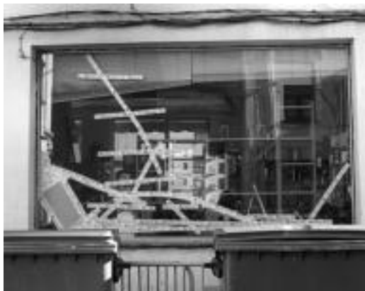
Kristala pitzatu zen sutearen ondorioz. N. GARZIA

da: «Nire ustez kanpoko norbaitek egindako baldarkeria bat da, hemen parranda asko izaten dira urtean zehar, baina ez da inoiz horrelakorik gertatu. Landa tabernaren aurreko edukiontzia ere bota egin zituzten. Axolagabetasun handiz jokatu dute drogeri baten aurrean hori egitean».