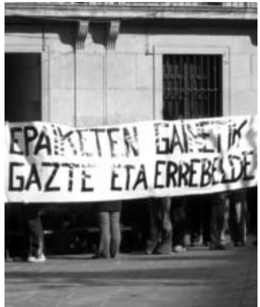
Epaiketa salatzen Borroka Eguna deitu zuten Segikoek. O. ESKITXABEL

Jarrai-Haika-Segi epaiketaren sententzia hilaren 18a baino lehen jakingo da