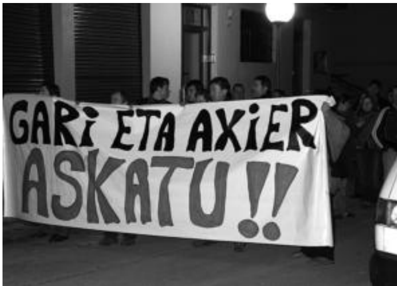
Atzo iluntzeko zortzietan, atxilotuen aldeko manifestazioan, 100 lagundik gora bildu ziren. MADDI SOROA

Atxiloturiko bi gazteak Atxondoko eta Zornotzan aurkituriko lehergai gordelekuekin lotu dituzte bi toki horietan aurkitutako zuloekin zerikusia dutelakoan. Joan den hilaren 4tik ari omen ziren Larrinagaren bila, Ertzaintzak Atxondoko ehun kiloko lehergaiak bidia aurkitu zuenean. Gau horretan bertan, Ertzaintzak Larrinagaren etxebizitza miatu zuten. Aipaturiko aurkikuntza, abenduaren 23an Zornotzan