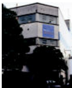
Amaroz paper fabrika. E. EZEIZA

Egoera ekonomiko larria bizi du paper fabrikak; 120 langile dira ▶ 2