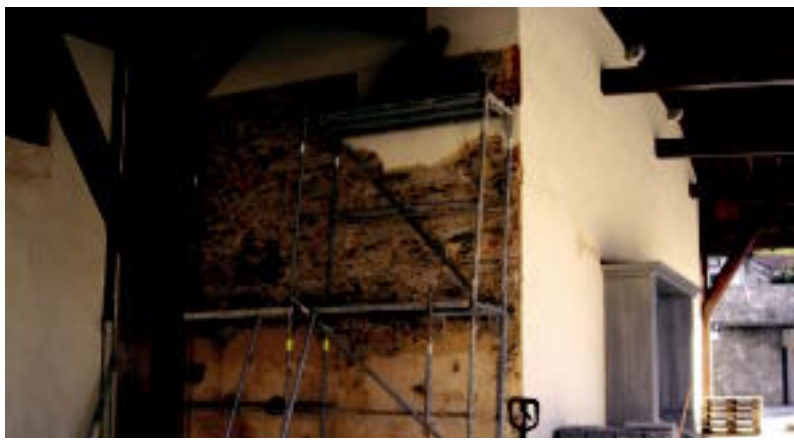
Elizako horma batean frontoitxo bat ari dira egokitzen. Arkupean bertan dago, euriaz babestuta. ENERITZ MAIZ

IKAZTEGIETA ▶ Plazako lanen azken fasearen baitan, eliza inguruko lanetan eserlekua, lur berria eta frontoitxo bat egiten ari dira eta atari bat berritzen