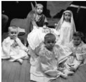
Ezkerrean, Haur Eskolakoak. Eskuinean, berriz, lehenengo zikloko gaztetxoak. HITZA