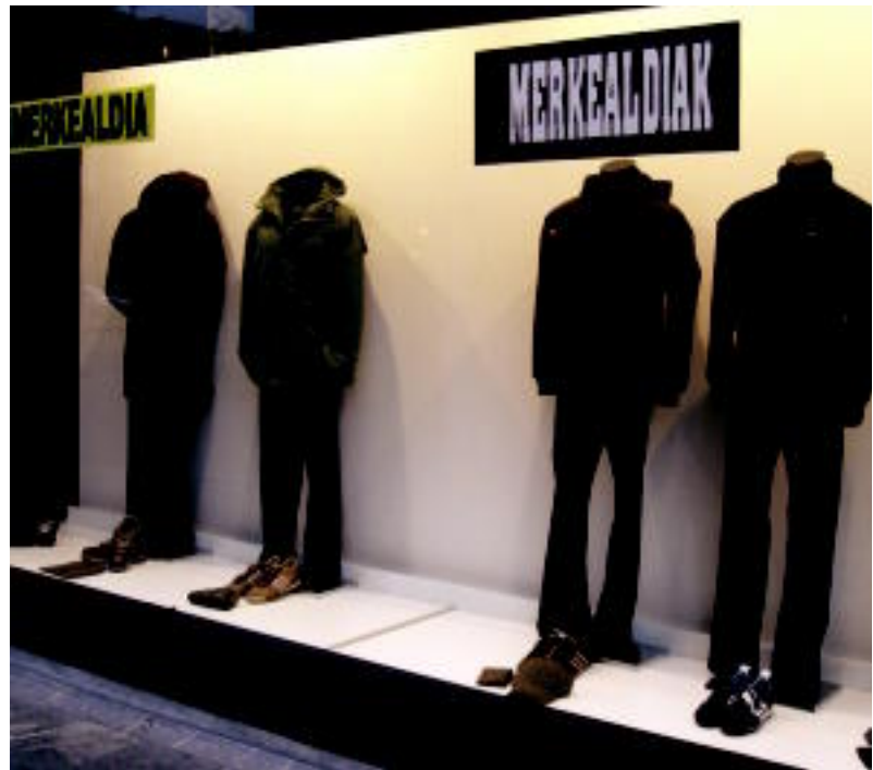
Dendetako langileek nabaritu zuten atzo merkealdiaren lehen eguna. I. TERRADILLOS

TOLOSALDEA-LEITZALDEA ▶ Atzo hasi zen merkealdia bi eskualdeetan; batez beste 122 euro gastatuko ditu herritar bakoitzak