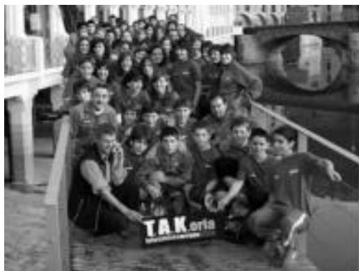
Tolosaldeko Arraun Klubeko arraunlariak, aurkezpenean. N. LIZARTZA

Erakustaldiaren ondoren, Zelai presak eskainita, lunch bat eman zieten arraunlariei, eta hauen senitartekoei. Honekin batera, Eguberrietako saskia entregatu zioten zozketaren irabazleari. Hau Xabier Or-