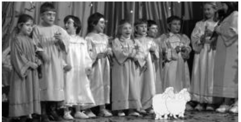
Lehen Hezkuntzako ikasleak Lasto artean antzezlaneko une batean. HITZA