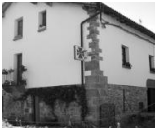
Aresoko botika. J. ASTIBIA