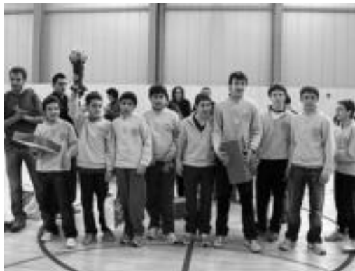
Infantilen mailan, Intxurrekoek irabazi zuten. NEREA LIZARTZA

Tradizio bilakatu da dagoneko txapelketa hau eta urtero-urtero eskualdeko neska nahiz mutil ugari hartzen dute parte torneo honetan. Aurtengoan eskualdeko 65 talde lehiatu dira ligaxkan, eta 107 partida jokatu dira denera.