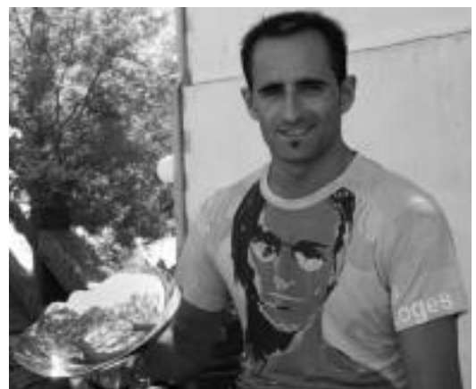
Zeberio txapelketa final atarian izango da gaur Galarretan.