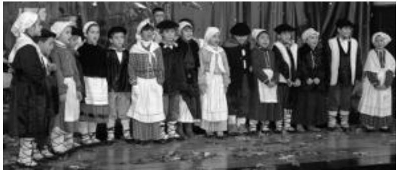
Lehenengo zikloko ikasleak kantu kantari. HITZA

«Oso festa bereziak» igaro dituztela antolatutako ekitaldiekin diote Hirukiden. «Gabonez gozatu eta, aldi berean, deskantsatu ere egin baitugu; orain, berriz, bigarren hiruhilabeteari gogoz eusteko garaia heldu zaigu denoi».