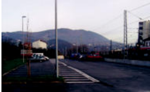
Geltokiaren aurreko aparkalekua dagoeneko erabili daiteke. HITZA

Ondorengo faseak Aurrera plaza eta Ugare auzoan oinarrituko dira. Lehenengo pauso bezala, Udalak plazaren eta Ugareko zati txiki baten lanak esleitu ditu 376.522,85 euro-rengatik. Lanen bitartez, herri-erretarrek erabili ahal izango duten