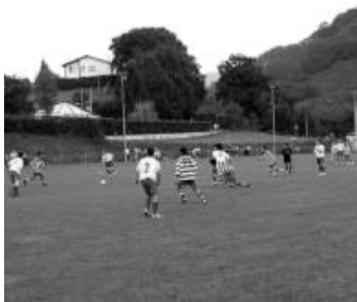
Aurrera taldearen denboraldi honetako partida bat. J. ASTIBIA

Anttolin, Olano, Sagastibeltza eta Arangoaren baja du taldeak; gutxienez hilabete eta erdi eginen dute jokatu gabe