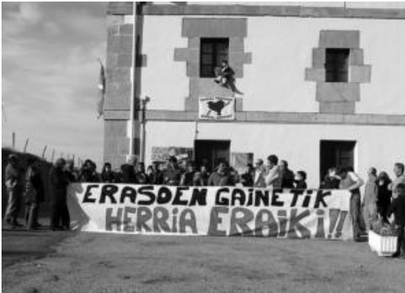
Inputatuei babesa emateko urte amaieran udalebearen aurrean eginiko kontzentrazioaren irudia.

«Ezker abertzalearen aurkako epaiketa politikoa» izan dela eta «gutziz zentzugabea» dela salatu dute inputatuek