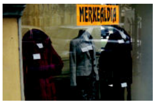
Kartel handiekin iragartzen dute dendek merkealdia. I. TERRADILLOS

IRRATIA Xtolarre irrati (107.5, 101.2 FM) 11:00-14:00. Tolosaldeko ahotza magazina: eguraldia Joxe Landarekin, HITZAren errepasoa, elkarrizketak, agenda, lehiaketa, disko eskainiak... 18:00-20:00. Tolosaldeko ahotza (errepikapena). 20:00-21:00. Goiko eskolatik betti. 21:00-22:00. Izarrak eta ilargia. ▶ HITZA ez du bere gain hartzen egunkarian adierazitako esanen eta irizien erantzukizunik.