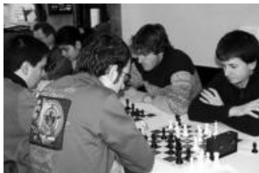
12 lagunek hartu zuten parte aurtengo lehiaketan.