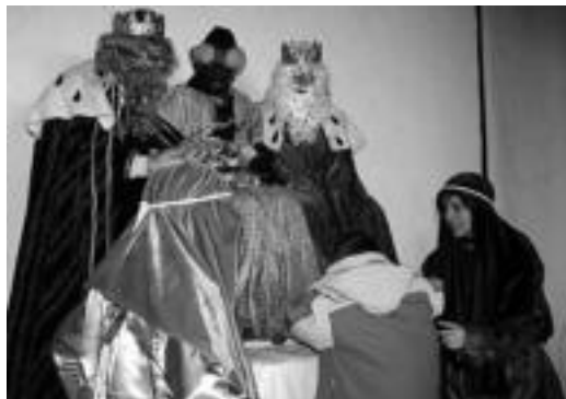
Banan bana igo ziren haurrak Errege Magoengana. E. EZEIZA

zeuden. Meltxor, Gaspar eta Baltasarrek, pajeen laguntzarekin, haurrei goxokiak banatu zizkieten. Gazetxoak, ilaran jarri, nola hala txandaren zain, eta banan bana igo ziren Errege Magoak zeuden lekura. Hemen, lotsa eta ilusioa nahasirik Erregeengana gerturatu, eta bi musu eman zizkieten. Bien bitartean guraso askok seme-alabean harridura aurpegia bertikotz nahi izan zuten argazki argazki kamerarekin. Goxoki banaketa amaitu ondoren, zaldirik eta gamelurik ez bazuten ere, beraien bidearekin jarraitu zuten. Baina lehenengo, Frai-