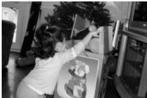
Jeiki eta lehenengo gauza opariak irekitzea egin zuten haurrek. HITZA

sorotik pasa ziren, han geldialditxo bat egiteko, eta bide luze-rako indarrak hartzeko.