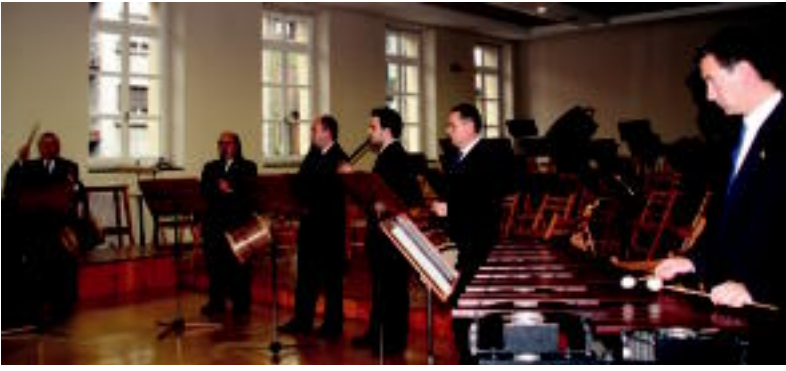
Udal Txistulari Bandak marinba-jole baten laguntza izan zuen. ESTI EZEIZA

TOLOSA ▶ Musika alai eskaini zuten, beste behin, Udal Txistulari Bandak eta Musika Bandak, Errege egunean egin ohi duten kontzertuan