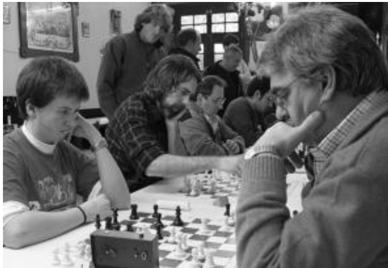
lazio Intsaustiren omenezko Erregetako Xake Txapelketaren une bat. HITZA

Parte-hartzaileak Aurrera elkartera (Santa Maria kalean) joan behar dira 10:00ak baino lehen, izena emateko. Nahi duen guztiak parte har dezake. Xakelari bakoitzak bost minutu izango ditu beharrezko mugimenduak egiteko. Beraz, gehienez partida bakoitzak hamar minutu iraun dezake. Horrek «erakargarratasuna» ematen dio txapelketari. 40 jokaldi kalkulatu ohi dira batzuetan beste partida bakoitzeko. Ondorioz, 10 segundo eskas izan ohi ditu xakelariak mugimendua pen-