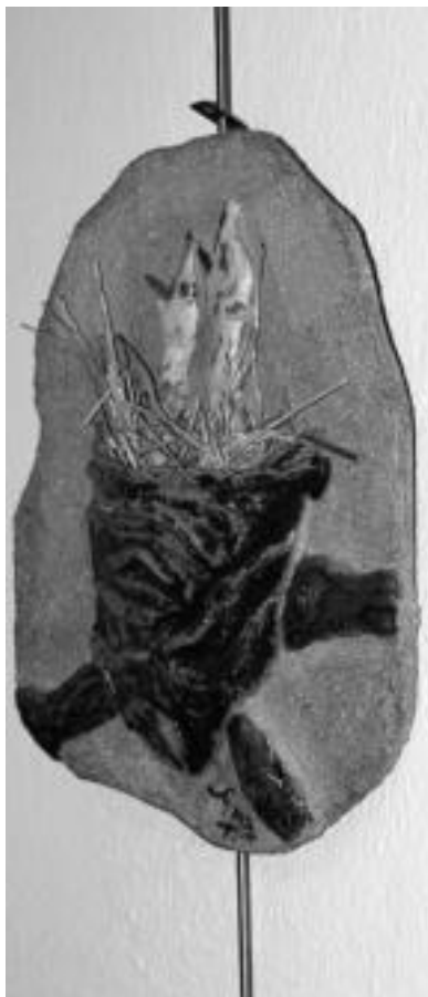
Kabia. Naturako elementu biziak erabili ditu kabia egiteko orduan ere. Benetazko lastoa ipini du kabia izango zen horretan. Erliebeak momentu batean kontaktua galdu du koadroarekin berarekin. N. URBIZU