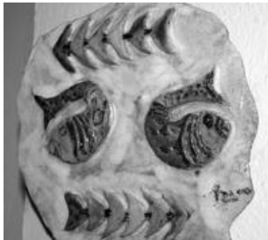
Arrainak. Arrainen ezkatzen dizdira irudikatu nahian, erabili dituen koloreetan bizitasuna gehitu dio artistak. Simetria zainduak, eta borobilak eta angeluak konbinatu egiten ditu. Dena, nolabaiteko bizkarrezurrean dauden 6 koloreekin osatu du koadroa. N. URBIZU