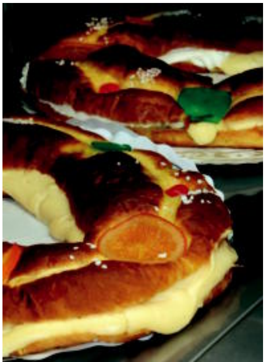
Errege-opilak barra-barra saldu ziren atzo bi eskualdetan. Ezker-eskuin, Leitzako eta Tolosako dendak.