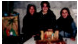
Irurako 2007ko jaiotza lehiaketako irabazleak.

Erregeen desfilea amaitzean, Hasiera batean hiru mailatan banatu behar baitzen ere lehiakideak, azkenik bitan bakarrik izan ziren. Ohihurtari jarraituz, gazteboiek muntatu behar izan zuten jaiotza eta figurak ere berakiek egin zituzten. Atzo arazaldean eman zituzten