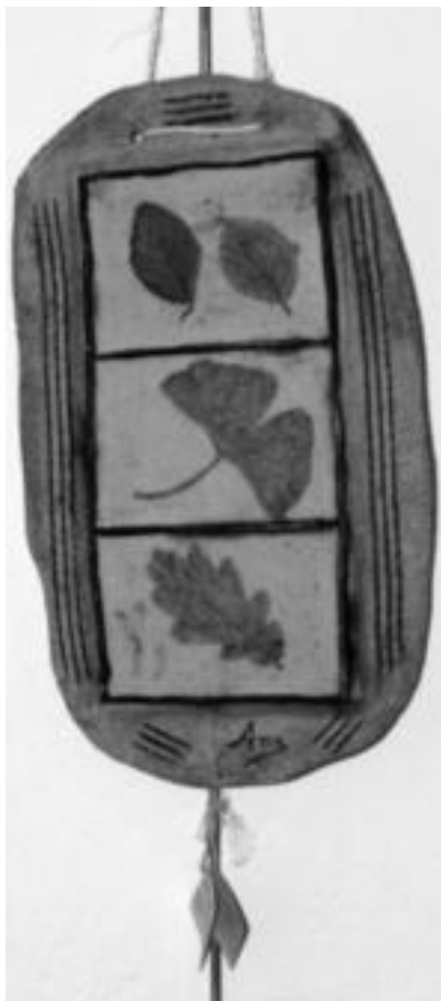
Udazkena. Kasu honetan, erliebea kanpoaldera baino barrualdera dago landuta; hau da, irudiak edo hostoak, maila sakonenean daude eta hondo zurizka kanporago dago. N. URBIZU