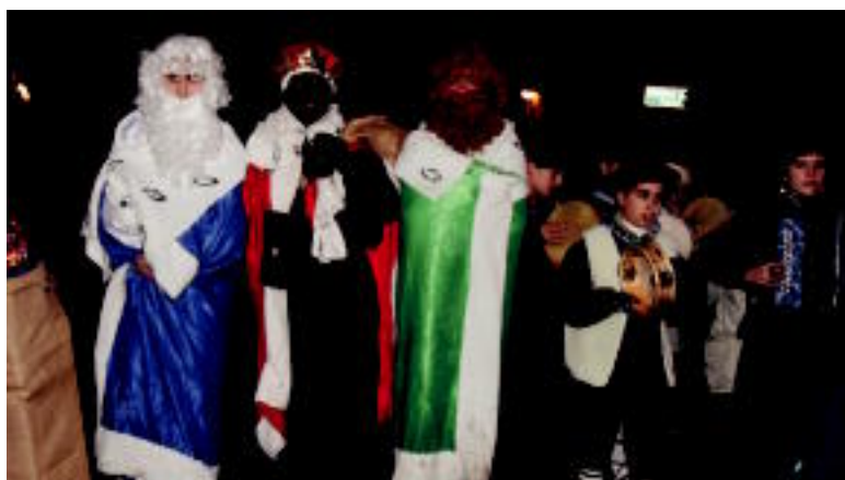
Tolosaldeko eta Leitzaldeko gaztetxoek irrikaz egon ziren hiru Errege Magoak noiz etorriko zain. Desio duten oparia eskatzeko baliatu ahal izan zuten unea.