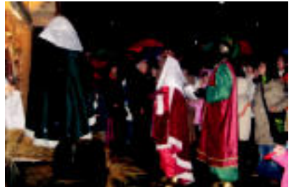
Leitzan, desfilean ibili ondoren Jesus haurtxoa agurtzera joan ziren hiru Errege Magoak.