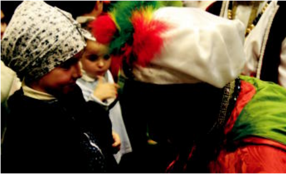
Meltxor, Gaspar eta Baltasar Errege Magoak lurramendi egotzan izan ziren atzo. Tolosaldeko haurrei harrera egiteko, irudian, haur bat Baltasar erregeari opari eskatzen beldirra.