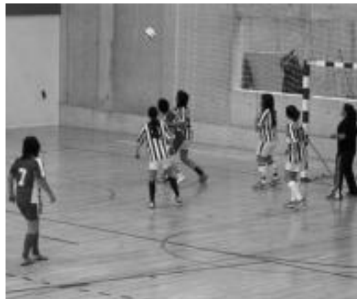
lazio nesken arteko partida bateko une bat. N. LATABURU

25 urte bete ditu aurten Eguberrietako futbol txapelketa honek. Urtero urtero bezala, bai Tolosaldeko bai eta inguruko herrietako 60 talde inguruk hartu dute parte aurten. Azkenean, 8 jardunaldi eta gero, bihar erabakiko da zein izango diren aurtengo lau talde irabazleak.