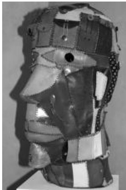
Oroitzapen biltegia. 35x80x60ko neurria du eskultura honek. E. EZEIZA