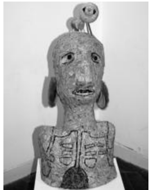
Buru bat ametsekin. 38x82x50 zentimetroko neurria du eskultura honek. E. EZEIZA