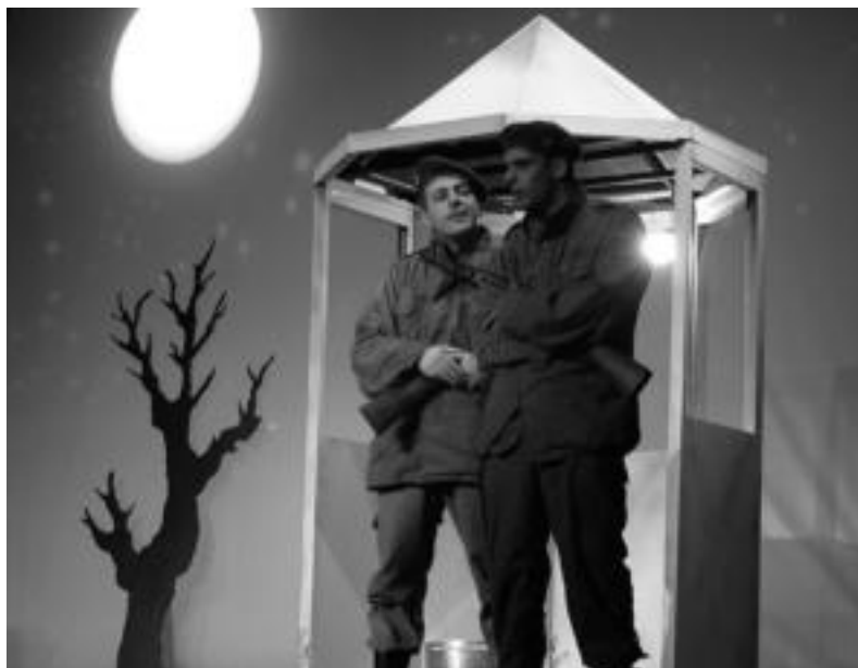
Erreleboa antzezlan hilaren 12an izango da ikusgai Leidor aretoan. HITZA

Gaztetxoenei zein helduei zuzenduriko pelikuletan eta antzezlanetan eskaintza handia izango da urtarrilean