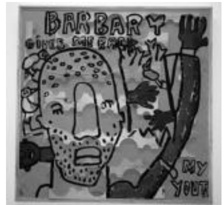
Energia gela. Tabla baten gainean, oleo eta collage bitartez egina dago kuadro hau. E. EZEIZA