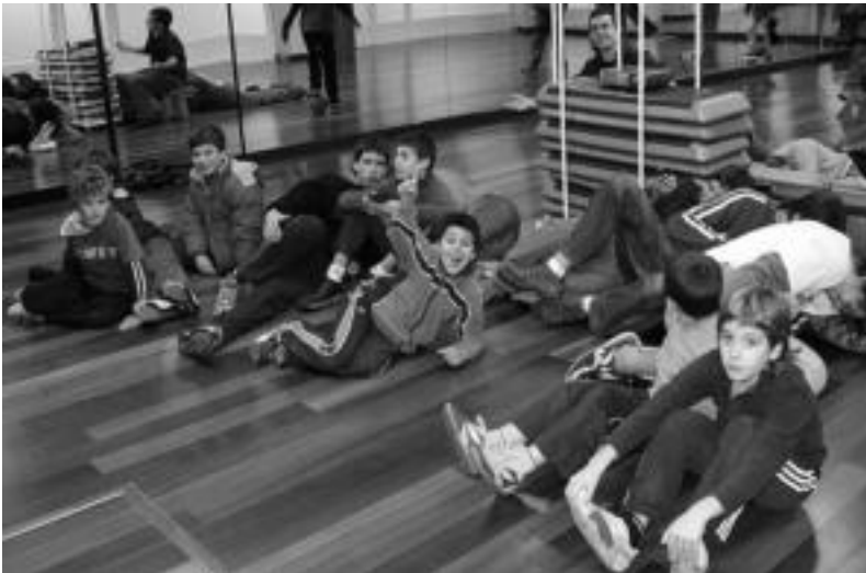
Eguraldi txarraren ondorioz kiroldegiko gela batean aritu ziren jolasean ibarrako gazteak.

Play Station 2.go Buzz jokoa aritu ziren ibartarrak atzo, galdera-erantzunen bitartez puntuak eskuratu zituztelarik