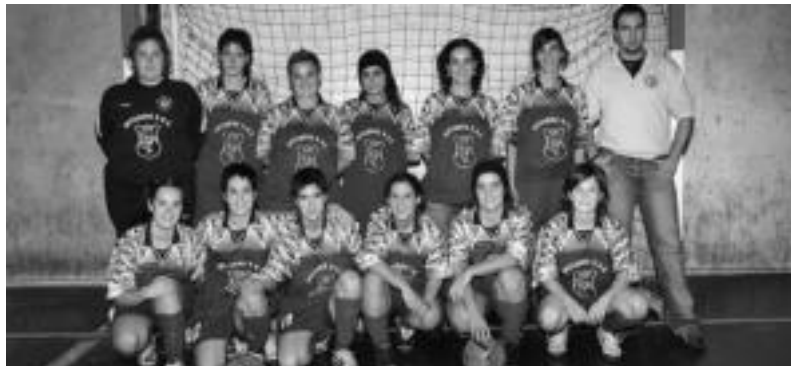
Senior mailako neskek bigarren daude sailkapen nagusian, 23 punturekin. PATXI RENOBALDES

Seniorrek, lurraldekakoek eta kadeteek sailkapen orokorrean lehenengo lauren artean geratuta fase berria hasiko lukete; gazteek Gipuzkoako Kopa jokatu dute