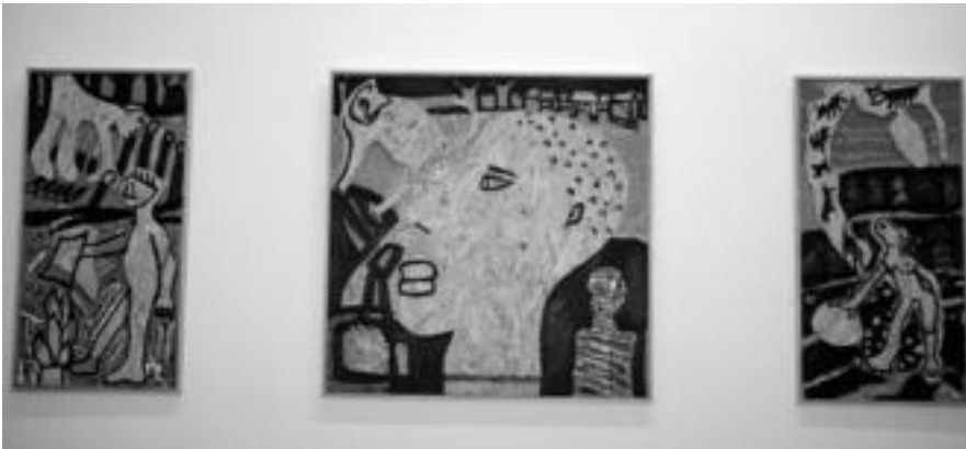
Fruta bilketa. Hiru kuadroz osatutako triptiko da hau. Oleo eta collagea dago tabla gainean eginda. 150x90 zentimetroko neurria du. E. EZEIZA