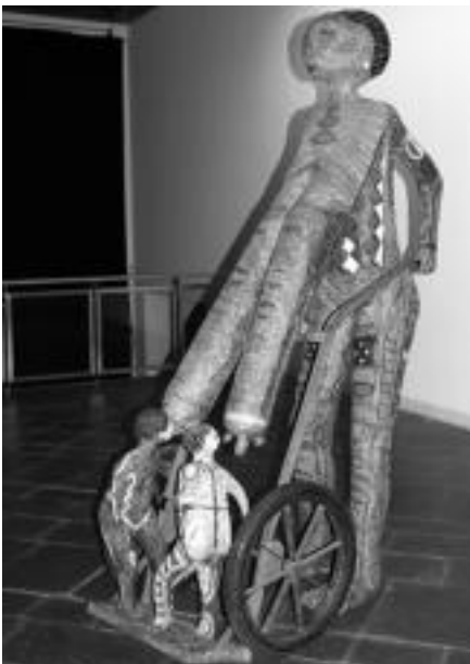
Ama. 80x140x120 zentimetroko nerria du eskultura berezi honek. E. EZEIZA