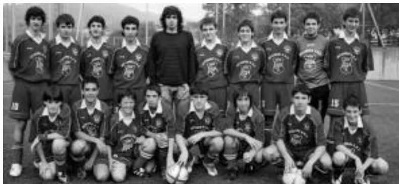
Kadeteek hurrengo norgehiagoka etzi dute Orion, Orioko taldearen aurka. PATXI RENOBALDES