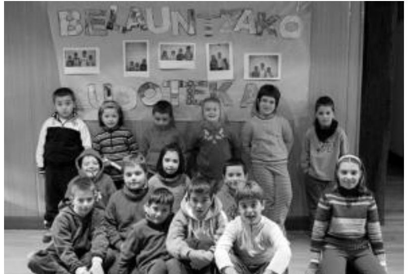
Belauntzako Kultur Etxean elkartzen dira egunotan herritar gaztetxoak. M.SOROA

Ludotekara doazen haur kopuruaren hazkundearen arrazoia argi ez badago ere, esan daiteke, herri txikiak haur kopuruaren igoera izan dela arrazoi nagusietako bat. Bestetik, berriz, argi dago gurasoek geroz eta konfidantza handiago hartzen dutela haurren begiraleekin eta beraz, lasaiago geratzen direla begiraleak ezagunak direla jakinda; izan ere,