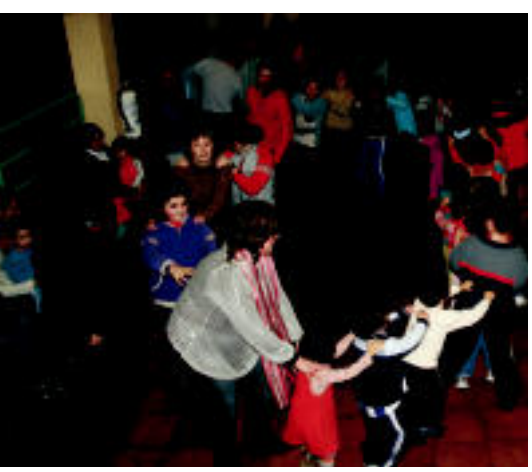
Lehendabizi merienda jateko aukera izan zuten Trinketera gerturatu zirenek; gero etorri zen dantzarako ueña. I. GARCIA