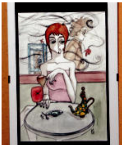
Akuarela. Txindoki tabernan dauden 11 margolan akuarelaz eginda daude. MAITE GURRUTXAGA