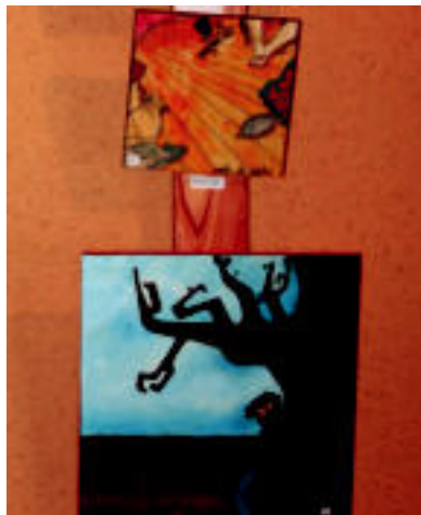
Esaldiak. Margolan bakoitzak olerkiko esaldi bat dauka, bi ideiak lotuz. M. GURRUTXAGA