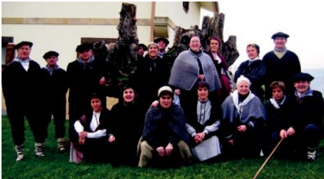
Gabon bezperan abesten atera ziren Eresargi abesbatzako kideak. HITZA