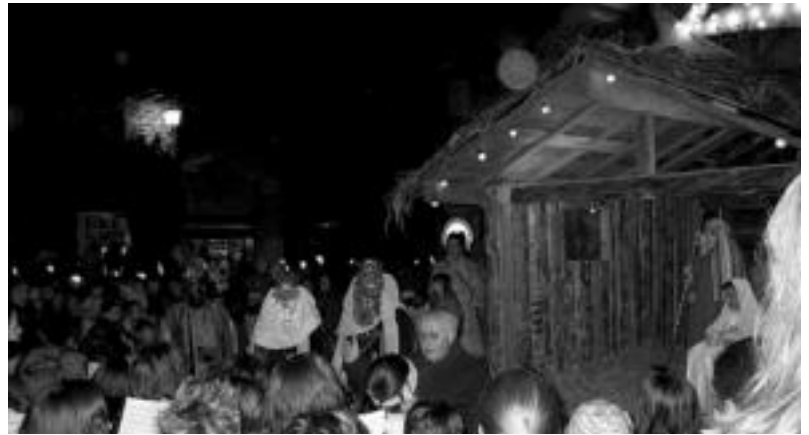
Errege kabalgatarekin batera ikusgai izango dira jaiotzak. J. ASTIBIA

Jaiotza irabazlearen egileak 90 euro eraman ahal izango ditu. Bigarrenak, 60; hirugarre-