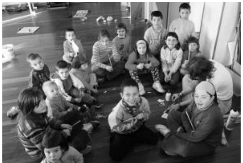
Leaburuko haurrek herriko elkarte dute Eguberrietako egunetako topagune. M.SOROA

urtero begirale berberak izan daitezkeen saiaten dira antolatzailak.