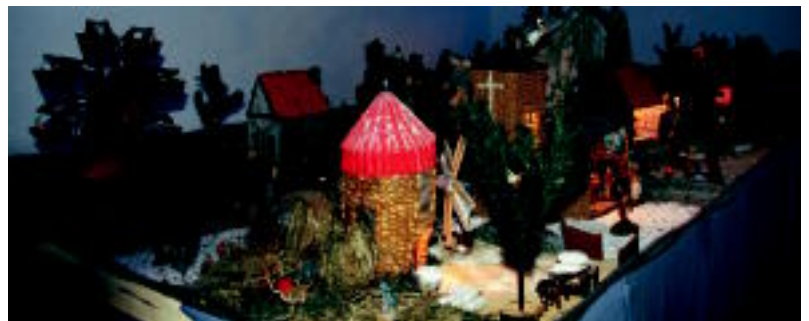
Jaiotza mekanikoa. Zezen Plazako mekanismo ugari ditu. Ondorioz irudi asko mugitzen dira. N. GARZIA