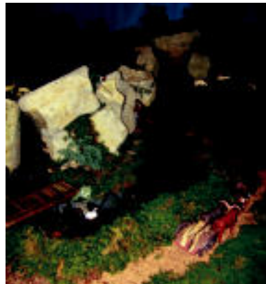
Erreka. Jaiotzetan beti bada erreka bat eta Orkatz Erbitik berea ere jarri du. N. GARZIA

Bai, tradizioan oinarrituta gauza berriak egiten saiatzen naiz beti, eta horregatik esan dezaket ez dela ohiko jaiotza bat. ◀