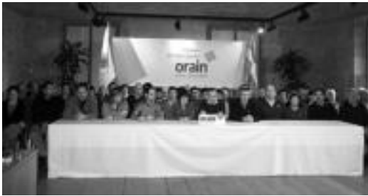
Tolosako Ezker Abertzaleko kideak atzoko agerraldian. E. EZEIZA