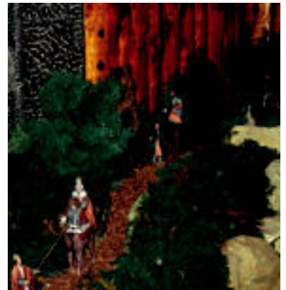
Erregeak. Jaiotzako iskiean jarri ditu Errege magoak, mendian behera datozela, leitzarrak. N.G.