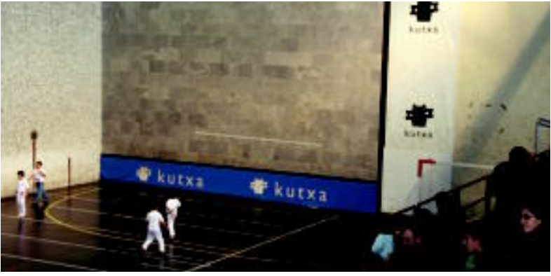
Atzoko finaleko lehenengo partida. N.GARZIA

ALEGIA ▶ Alegiko Eguberrietako bosgarren pilota topaketen barruan, atzo jokatu zituzten lau finalak: prebenjaminak, benjaminak, alebinak eta infantilak