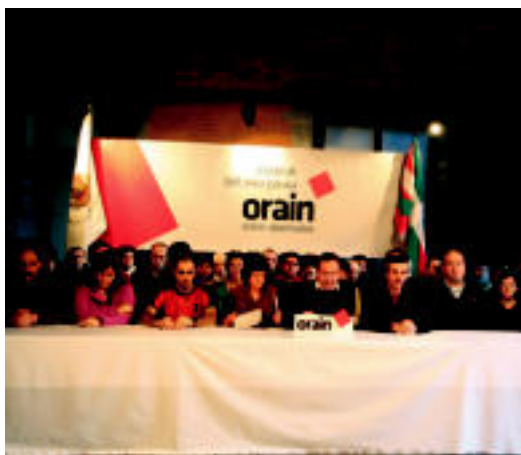
Tolosako udaletxean atzo eskainitako prentsaurrekoko une bat.

ALDERDIEN LEGEA ▶ «Prozesu demokratikoa aurrera eramateko hori deuseztea ezinbestekoa da» ▶ 6