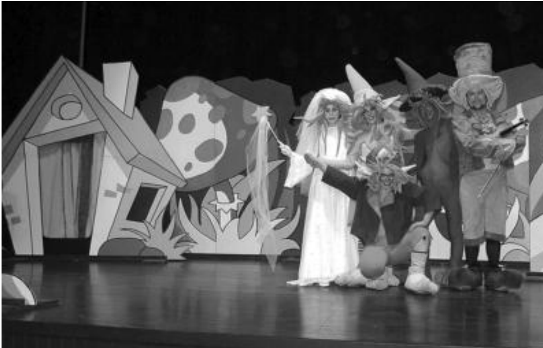
'Xurdir kobazuloan galdurik' antzerki musikatuaren bost protagonistak taula gainean. HITZA

Hiru tolosarrek Sointek produkzio-etxea sortu zuten duela zazpi urte; herriz herri dabilta 'Xurdir kobazuloan galdurik' antzerki musikatuarekin