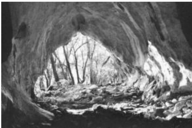
Ataungo Usategi kobazuloa. Hantxe aurkitu zituzten Aralarko lehen giza aztarnak. 'KULTURBIDEAK ARALARREN'

Bi zati ditu liburuxka. Lehenbizikoan, Aralarren bizi izan den populazioaren bilakaera kronologikoa egin dute: lehen aztarnak aurkitu zirenetik gaur egun arte. Ataungo (Gipuzkoa) Usategi haizuloan aurkitu zituzten Aralarren bizi izandako lehen gizakien aztarnak. Egin-dako ikerketen arabera, duela 27.000 urtekoak dira: «Horrek