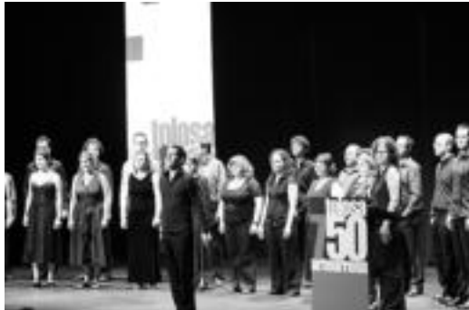
Hodeiertz Abesbatza emanaldi batean, Leidorren.