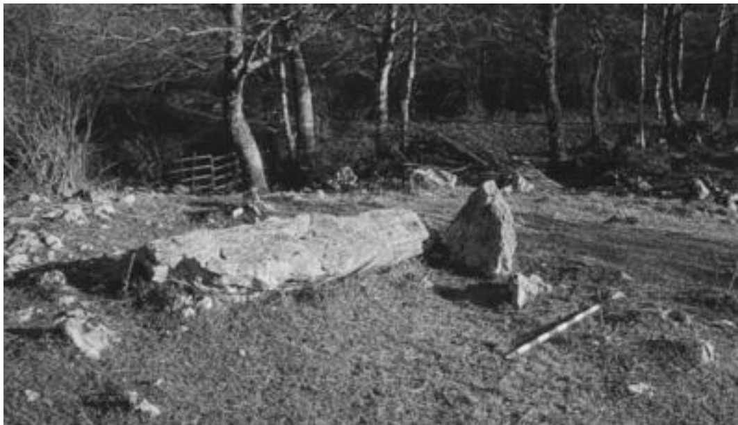
Urritzako trikuharria, Amezketan. Mota honetako asko topa daitezke Aralarren. 'KULTURBIDEAK ARALARREN'