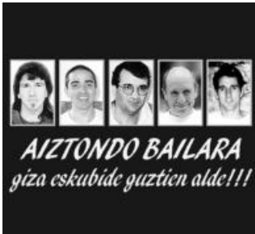
Aiztondo bailarako bost preso politikoak. HITZA

Aiztondoko bost udalek babesturiko deialdia Zizurkilgo Joxe Arregi plazatik abiatuko da, Villabonako plazaraino