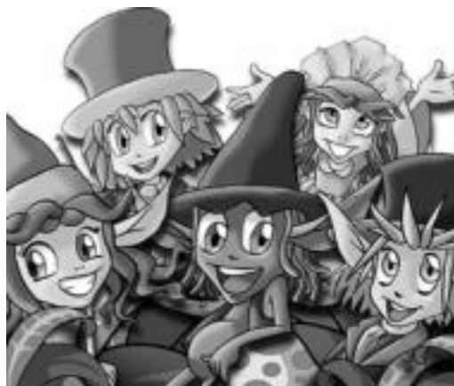
Bost protagonisten irudi marraztuak. HITZA

Abentura politak bezain nahasiak eskainiko dizkiete ikuskizunera hurbiltzen diren haurrei eta hauen gurasoei. Ikasiz, ondo pasatuko dute denek. Izan ere, kantuz eta jolasez betetako mundua ezagutu nahi dutenentzat aproposa da Xur-