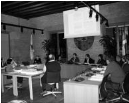
Udala osatzen duten zinegotziak herenegungo osoko bilkuran. E. E.

Aurrekontu bateratua 33.490.254 eurotakoa da. Honek barnean hartzen ditu Udalaren aurrekontua eta Udalaren parte diren enpresa publi-