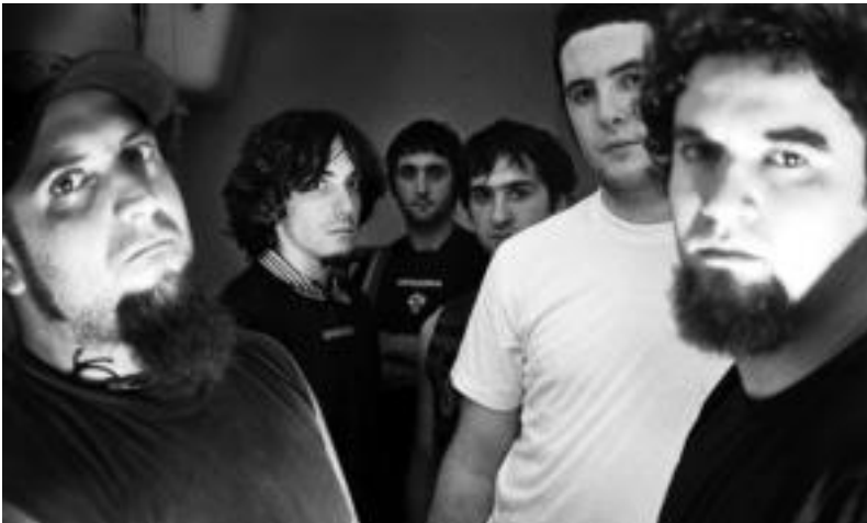
Eko4 taldea Amezketan izango dira. Ezkerretik bigarrena eta laugarrena Leitzako Aizagirre eta Erbiti. HITZA