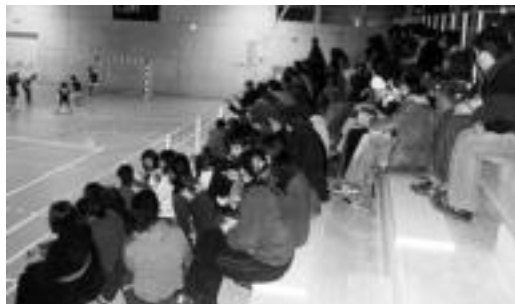
Jende asko hurbildu zen kiroldegira. HITZA

rezitako gosaria egiteko. 30 gazte inguru bildu ziren eta horretarako Gaztetzera bertara joan ziren. Gosaria, txapelketa bezalaxe, Gazte Asanbladak