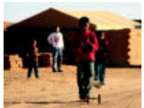
Jolasean. Gazteboak euren autobekin jolasten. I. I.