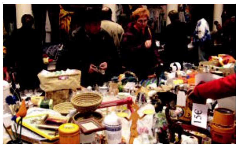
Era guztietako materiala topa dezakete Kultur Etxean dagoen Merkatu Txikira gerturaten direnek. i. r.

TOLOSA ▶ Urtarrilaren 7ra arte Laskorain ikastolak urtero antolatzen duen Merkatu Txikian «jendetza» izan dela azpimarratu dute antolatzaileek