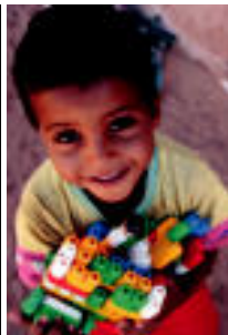
Jostailuak. Hemendik bidaiatuko jolasteko gauletan pozik ageri da gazte saharar hau. Bertan, ez dituzte horrelako jostailuak izaten. I. TERRADILLOS