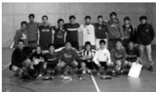
110 jokalarietako zenbait kide. HITZA

Jende askok parte hartu zuen bai jokalaririk moduan, bai jarraitzaile bezala ere, kiroldegia «erabat» bete baitzen