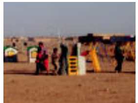
Proiektuak. Golan, Dajlako baratzak. Proiektu baten bidez lagunduta erakili zuten, izan ere, desertuan beste edozein lekutan baino zailagoa da lurra erretzea. Behean, Tolosaldea Sahararen elkartek lagunduta erakili den aisialdi gunea Aulim, Internet gelak, jolas parkeak eta igerileku truki batek osatzen dute, besteak beste. I. I.