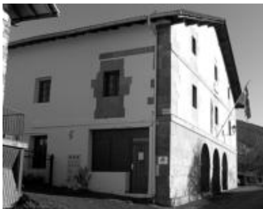
Gaur egun, Kultur Etxea zena udaletxea eta taberna da. N. URBIZU

Pleno bat egiteko asmoa erakutsi du inkulpatuen mozioa jasotzearekin batera; etzi kontzentrazioa egingo dute