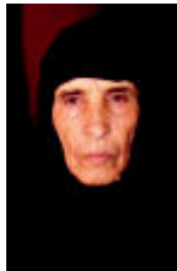
Sahararak. Duten adinagatik argi dago batzuk egoera larriagoak bizi izan dituztela, euren lurraldeetik alde egin beharra, esaterako. I. I.

Bestalde, aurtengoan erroka edo lelo batekin dator Sahara bizi Tolosaldea Sahararen elkartea eskualdean ahalik eta elkagai gehien bildu ahozko. Batez 7.000 kilo/duztienez kopuru hori berdintzea edo gainditzea lortu nahi dute elkartekoek. Horretarako, neurgailu bat jarriko dute Tolosaldeko Triangulo plazan zentratu kilo biltzen doazen ikusteko; omodu honetan herritarrek animatu nahi ditugu muga hori gainditzeko elkagaiak ekar ditzaztena.