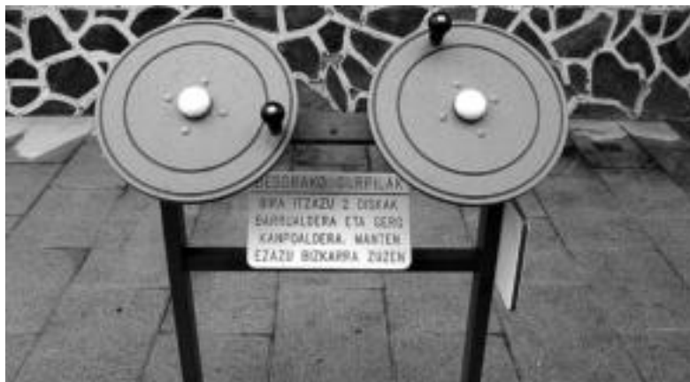
Villabonako helduentzako parkean besoak lantzeko dagoen tresna. IMANOL GARCIA

Geroz eta gehiago dira horrelako parkeak jartzen dituzten herriak. Tolosaldean, Villabona izan zen horietan lehena. Ibarako Udalak apustua egin du horrelako proiektu berritzailearen alde. Denborak esango du zer nolako harrera eta erabilera ematen dieten Ibarako helduek. ◀