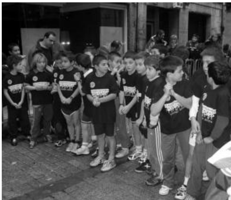
Joan den urteetan bezala, aurten ere Elkatasun Krosa egingo dute Tolosan zehar. I. TERRADILLOS

Hilaren 31n IX. Elkatasun Krosa egingo dute Tolosan, eta XXIII. Urte Zaharreko Lasterketa Villabonan eta Zizurkilen