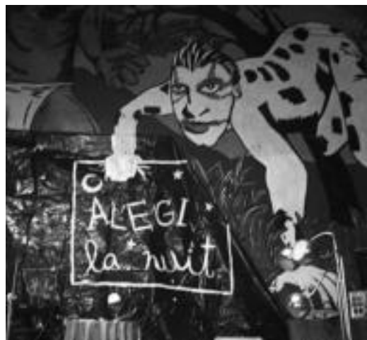
Iaz Alegi la nuit -ek arrakasta izan zuen. N. URBIZU

Gaztetxearen XIX. urteurrenaren baitan, ekitaldiak izango dira gauean