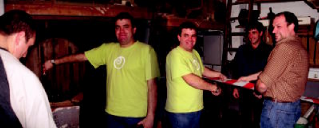
lurpean, eta beste inon baino lehenago egin dute Amezketa aurtengo sagardo denboraldi berriaren inaugurazioa.