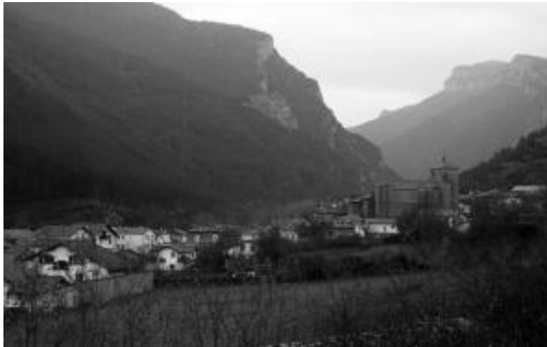
Burgi herria Nafarroako ipar-ekialdean, Erronkari haranean dago kokatuta. JOXEMI SAIZAR

Bere kokapenagatik, Elizpe izena eman zioten etxeari eta sortu zuten elkarteari. Logotipo lehiaketa bat egin zuten eta Burgiko zubia eta eliza biltzen dituen aukeratu zuten. Nafa-