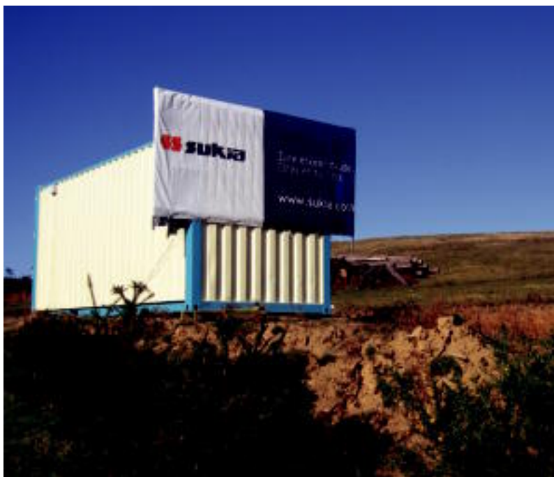
Lanen ondorioz, Elutsederko tontorra desagertu egingen da, zelai bihurtuko baitute. NAIARA GARZIA

IRAUPENA ▶ Hamalau hilabetez egingen ditu Sukia enpresak; ordainetan hiru lursail jasoko ditu ▶ 3