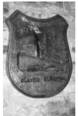
Elkartearen logotipoa. J.SAIZAR

Urte hauetan ehundaka tolosar izan da etxean eta Pirinioa ezagutzeko erreferentzia gunea bilakatu da