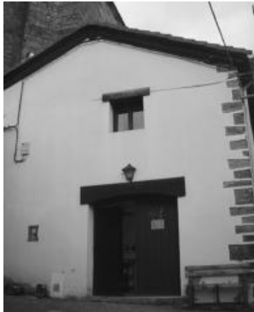
Elizpe etxea, Burgiko plazatik gertu dago, elizaren ondoan. J.SAIZAR

Hamabost urte beteko ditu laster Elizpe etxeak Burgin. Tolosar askori aisialdi eta oporraldi aukera paregabeak eskaini dizkio urte hauetan. Sortzaile haien seme-alaba asko hango egonaldietan hazi dira eta belaunaldi berria dator atzetik. Aurrerantzean ere tolosar askorentzat Pirinioetako txoko eder hura ezagutzeko erreferentzia gunea izango da etxea.