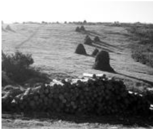
Elutsederren obrak hastear daude. N. GARZIA

Proiektu hau aurrera eramateko dirulaguntzei dagokienez, orokorrean 93.000.000 pezeta-takoa izango da jasoko duten kopurua. Kopuru hauetatik guztietatik haratago joanez gero, idazkariak azaldu duen bezala, proiektuaren kostua kontutan hartzen badugu (50.000.000 pezeta), Udalak 500.000.000 pezeta inguruko irabaziak izanen ditu. Honetaz gain, Aresoko idazkariak argi utzi nahi izan duen bezala, «ez dugu proiektuaren helburu bikoitza ahaztu behar: batetik ekonomikoa, eta bestetik soziala, bertako jendeari lana eskaintzea baita helburu nagusienetarikoa».