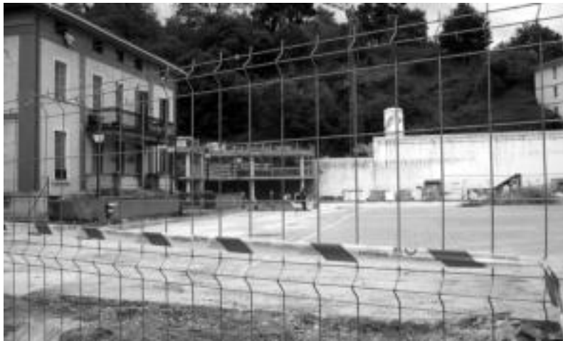
Aldaketa nagusien artean frontoia estali egingo dute eta argiztapena izango du. MADDI SOROA

Adin guztietako herritarren topagune izateko helburuz, frontoia, futbol zelaiak eta haur parkea berrituko dituzte; helduentzako parkea ere egingo dute