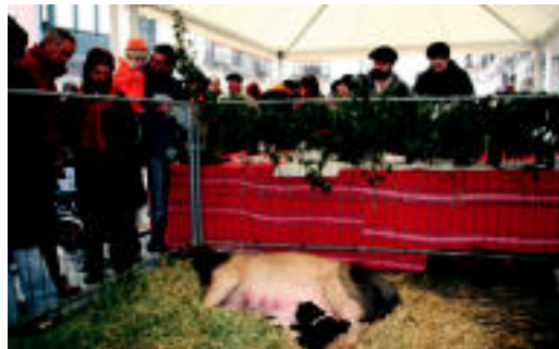
Herritarrak berrikumeei begira atzoko azokan. N. URBIZU