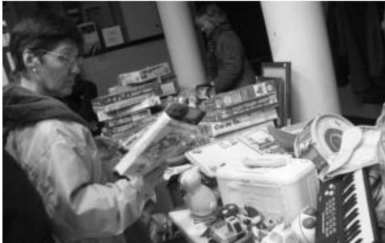
Emakume bat Merkatu Txikiko postu batean produktuak begiratzen, arxiboko irudian. IRATXE ETXEBESTE

Gelaz gela ikasleekin landutako unitate didaktikoaren ekimenetako bat da hau. Aurten bereziki, euren ikasleekin «baliok, jarrerak eta portaerak poliki-poliki hobera aldatzeko asmoz» balio hauek landuko dituzte: errespetu gauzei, pertsoneri eta ideiei; norbanakoaren eta gizartearen giza esku-bideak kontuan hartzea; gatazkak era baketsuan konpontzeko elkarrizketa bultzatzea; esku-hartzea ez ezik, gizarte justuago, berdinago eta solidarioagoa eraikitze elkarren arteko ardura eta konpromisoa bultzatzea. Kontsumo ardurasua bultzatzea, erosten dugu-