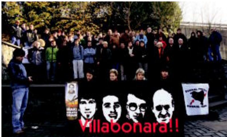
Villabonako presoen eskubideen aldeko Topagunearen parte-hartzaileen familia argazkia.

Ibaetako Manifestuaren bidez, arlo ezberdinetako eragileek presoen aldeko eskubideak bermatzea eskatu dute