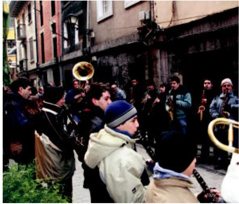
Gazteboek ere parte hartu zuten atzoko txaranga erraldoian. N. URBIZU

TOLOSA ▶ Bonberenea sortu zela zazpi urte bete ziren atzo; ospatzeko kaleetan zehar jotzen aritu ziren, herriko hainbat txarangekin batuz