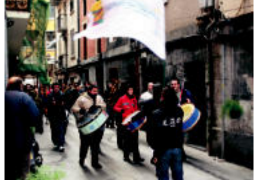
Bonberenea Txarangaren ikurra eskuan gidatu zuten ibilbidea. N. U.