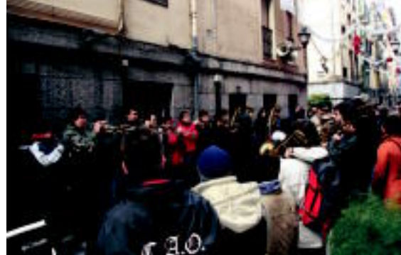
Alde Zaharrean geldidunak egin zituzten jendearren harridurarako. N. URBIZU

Hurrengo urtean 8 urte beteko dituztenean ere, ziurrenik kaleetan zehar ikusiko ditugu Bonbereneakoak, musikaz eta giroz blai, herritarrek festarako gonbita eginez.