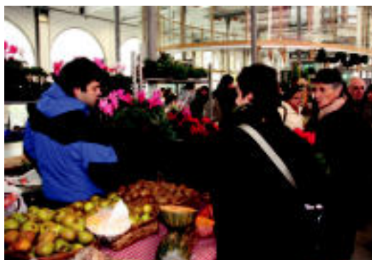
Goian eta behean eskubian, azokako une desberdinak. Behean, ezkerrean Odolki Lehiaketako sari banaketa. NEREA URBIZU