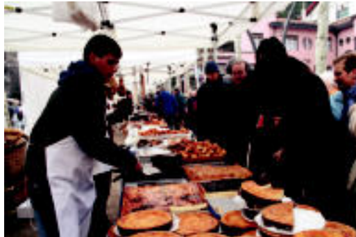
Gozo postuetako bat San Frantzisko etorbidean. N. URBIZU

Orioko Kepa Loidi lehengo urteko irabazleak 100 kilo odolki ekarri zituen Tolosara, jendeak dasta zitzan. Jende asko hurbildu zen hura probatzera. Hurrengo urtean ere irabazleak beste 100 kilo inguru prestatu beharko ditu Azoka Berezira ekartzeko.