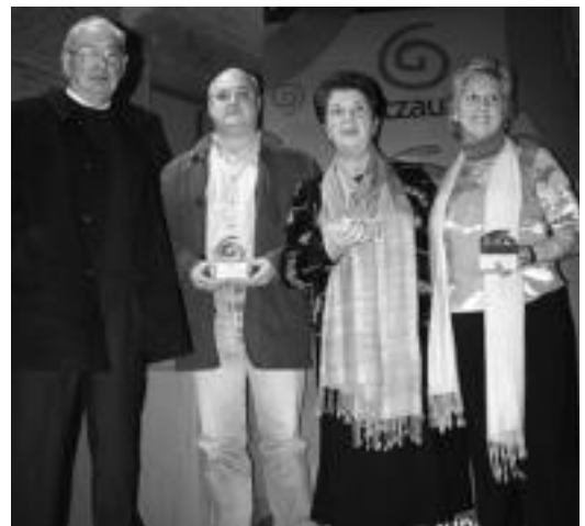
Joan den urteko Eskerrak Zuri Aipamen Berezien irabazleak.