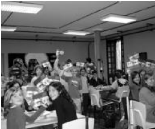
Zenbait gazteko, Topagunean, izen-emateko orriekin. HITZA

Herenegun aurkeztu zuten ofizialki egitasmoa, hala ere,