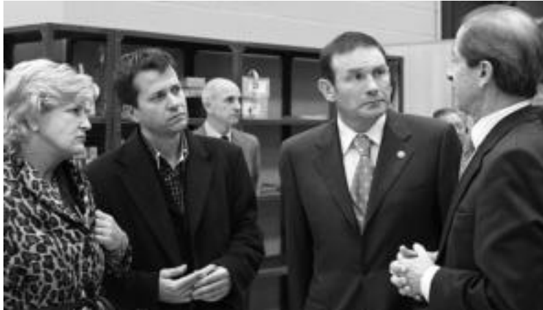
Ibarra eta Tolosako alkateak Ibarretxekin batera, Voitheko kudeatzailearen azalpenak aditzen.

Bisitaturiko hirugarren eta azken enpresa Voith izan zen. Bertan, aurreko bi enpresetan egindakoa errepikatu zen, hau da, bulegoak bisitatu, enpresaren inguruko datuak jaso eta tailerreko lanak gertutik ezagutu, baita langileekin hitz batzuk elkartrukatuta ere.