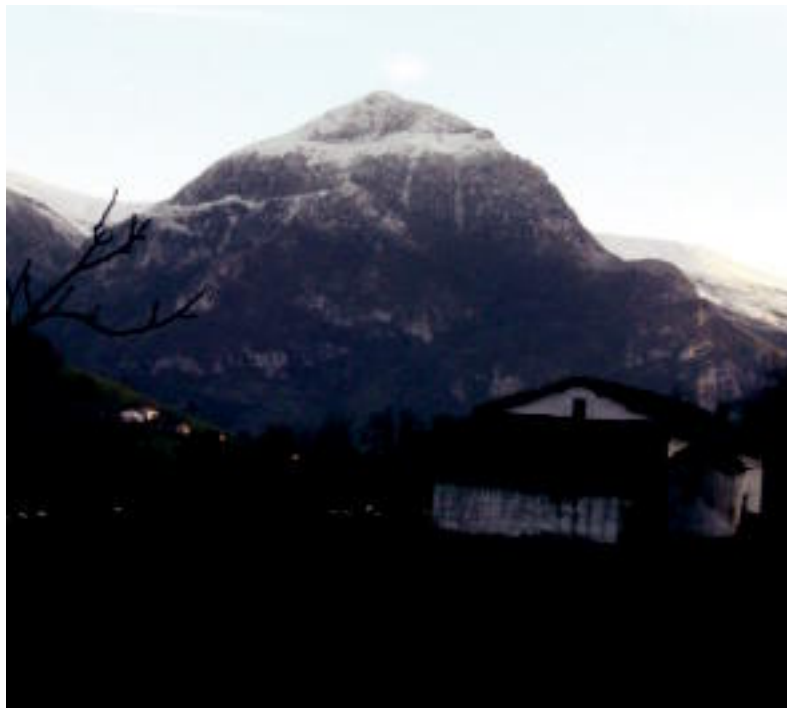
Txindokiko tontorra elurtuta esnatu zen iragan asteburuan; argazkian, mendia Baliarraindik. N. URBIZU

TOLOSALDEA-LEITZALDEA ▶ Asteburuan bota zituen lehen elur-marutak Aralarren; hala ere oraindik «oso gutxi» bota duela diote guardetxetik